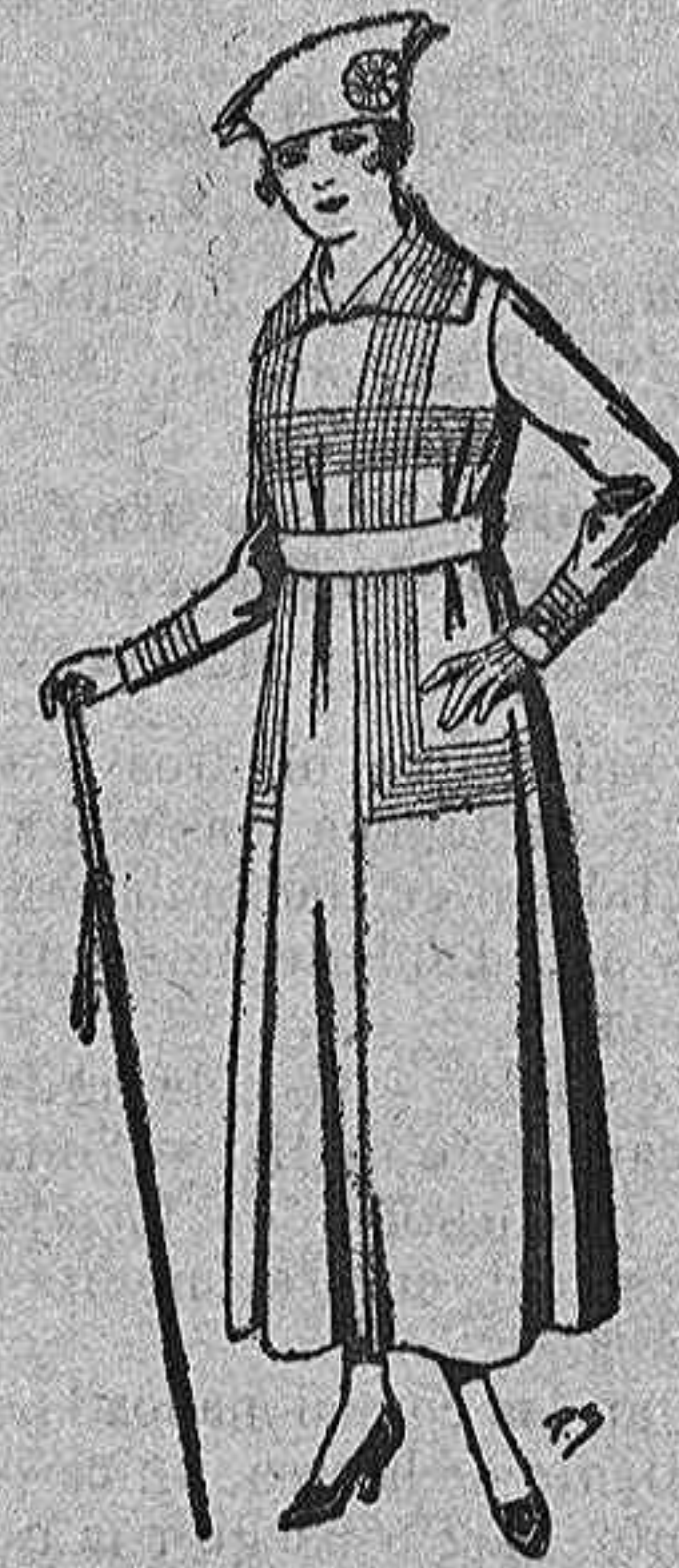
Vestidos de gabardina, en negro, azul y color, bordados. de pta. 60 a 85.