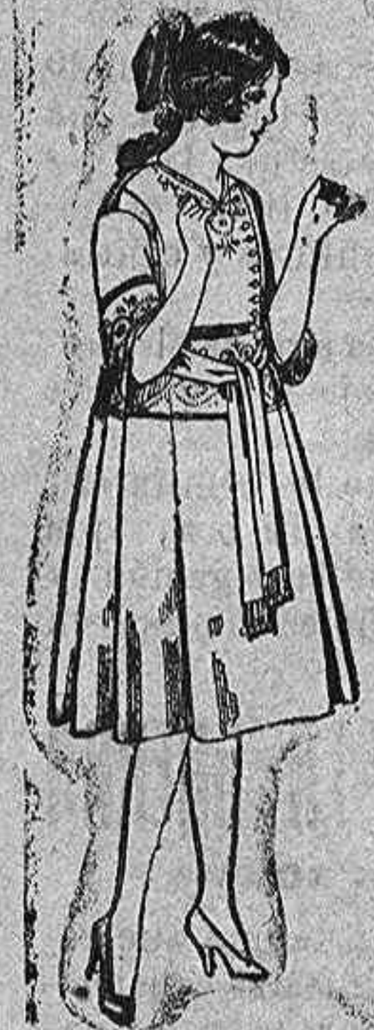
Vestidos de sarga inglesa azul bordados, para vicuñas de 12 a 15 años. de pta. 42 a 46.