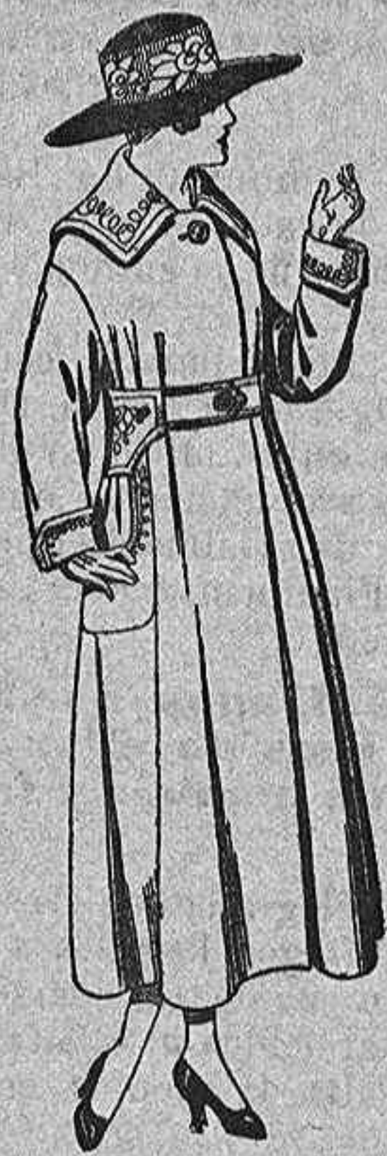
Abrigos de saba dina, paño, etc. en azul y color, bordados. de pta. 75 a 95.

Ropas confeccionadas para Caballero, Señora, Niño y Niña.