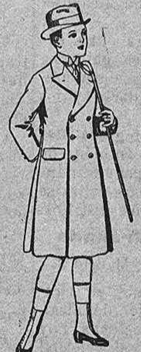
Gabanes de patén, para niños de 4 a 8 años. de pta. 10 a 60