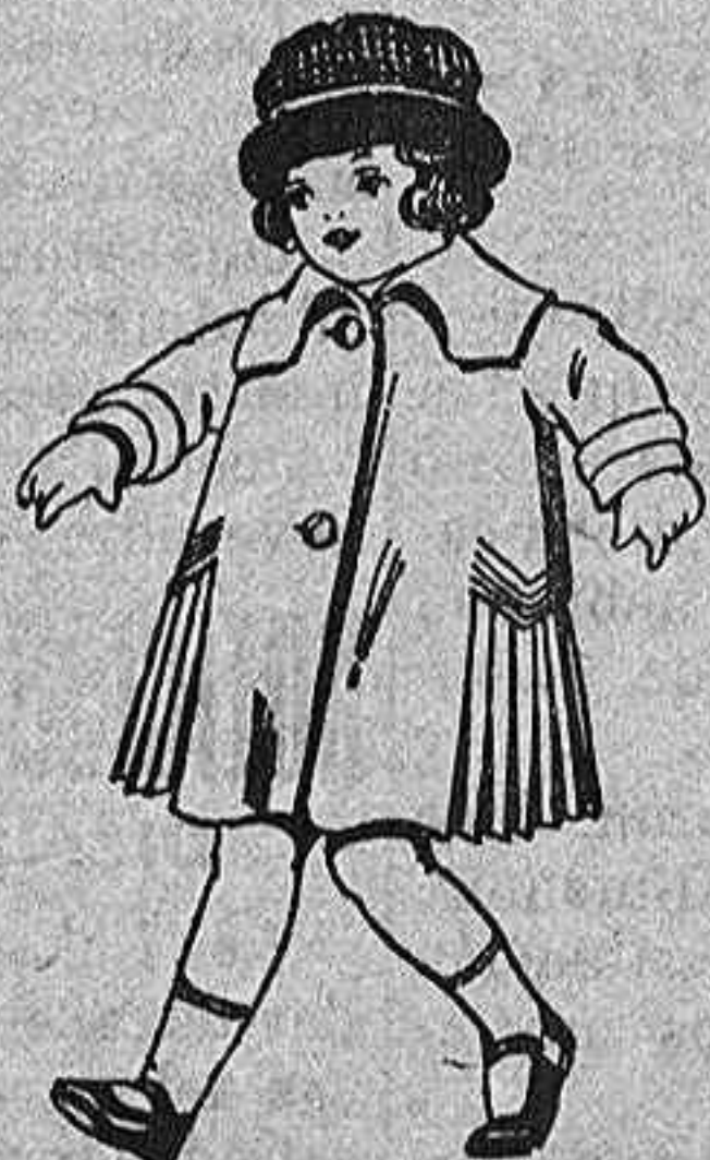
Abrigos de paño, gamuza, etc. para niñas de 4 a 9 años. de pta. 24 a 36.