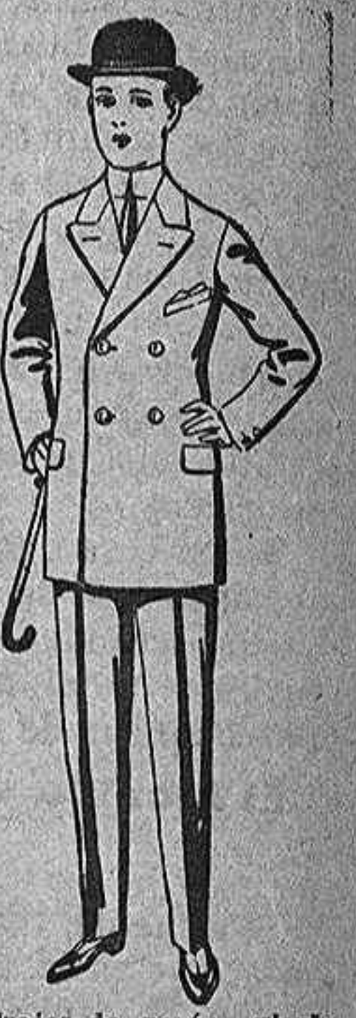
Trajes de patén, vicuña o c. para niños de 10 a 12 años, de pesetas 23 a 50. Los mismos, para jóvenes de 13 a 16 años de pta. 25 a 58

Gran exposición de artículos para la presente temporada.