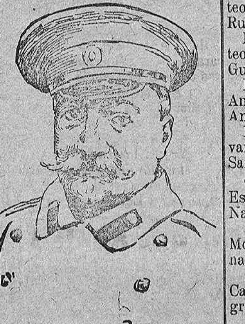
Generalissimo ruso Sakaroff que ha tomado el mando de las fuerzas que operan en el Báltico, para contener el avance alemán.