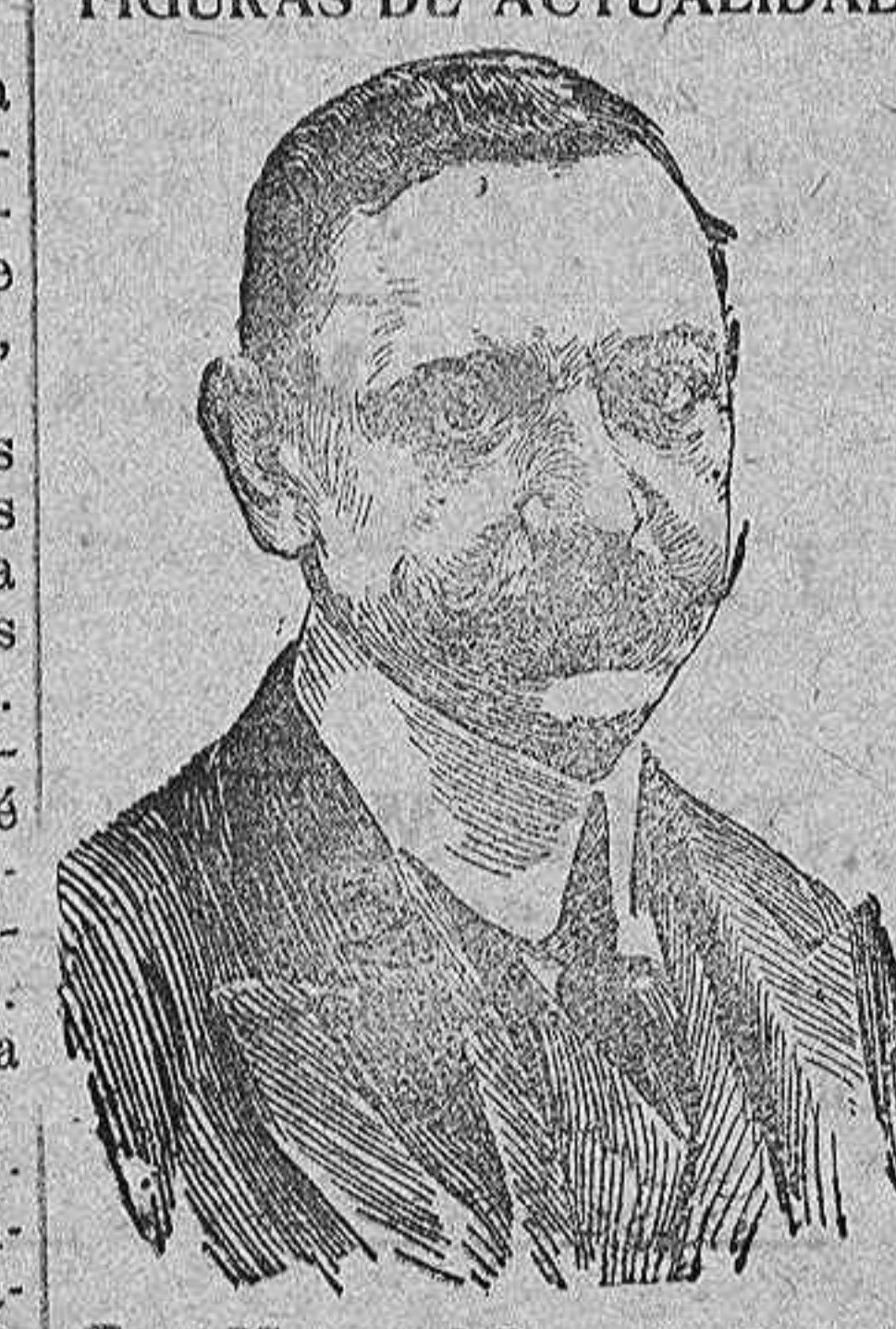
Don Manuel García Prieto, Presidente del nuevo ministerio, que jurará hoy.