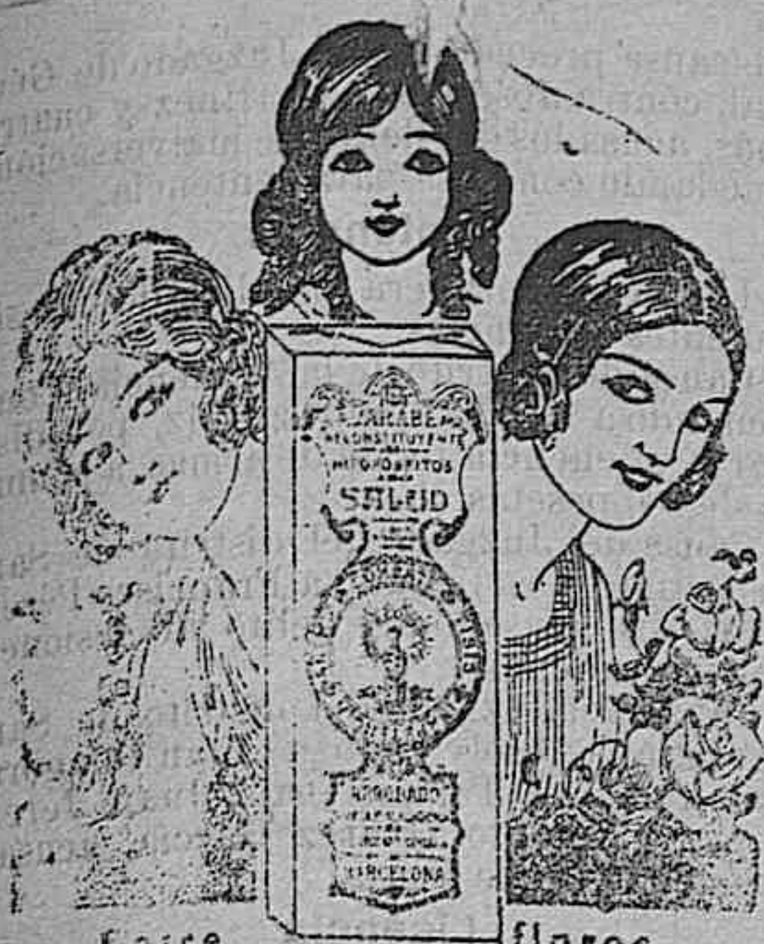
Entre flores vive la mujer defendida por el