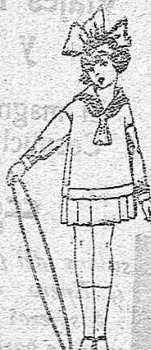
Trajes modelo «Marinera» inglesa, de sarga, vieña, azul etc., para niñas de 4 a 9 años, de ptas. 45 a 70

Ropas confeccionadas para caballeros, señoras, niños y niñas.