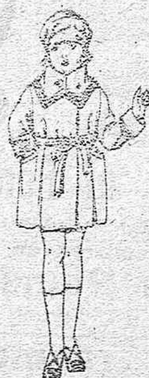
Abrigos de terciopelo, en azul y color, para niños de 4 a 9 años, de ptas. 50 a 65

Ropas confeccionadas para caballeros, señoras, niños y niñas.