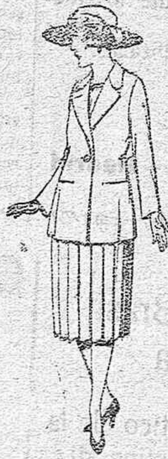
Vestidos de sarga inglesa, estambre, en azul y color, adornos bordados, de ptas. 65 a 90