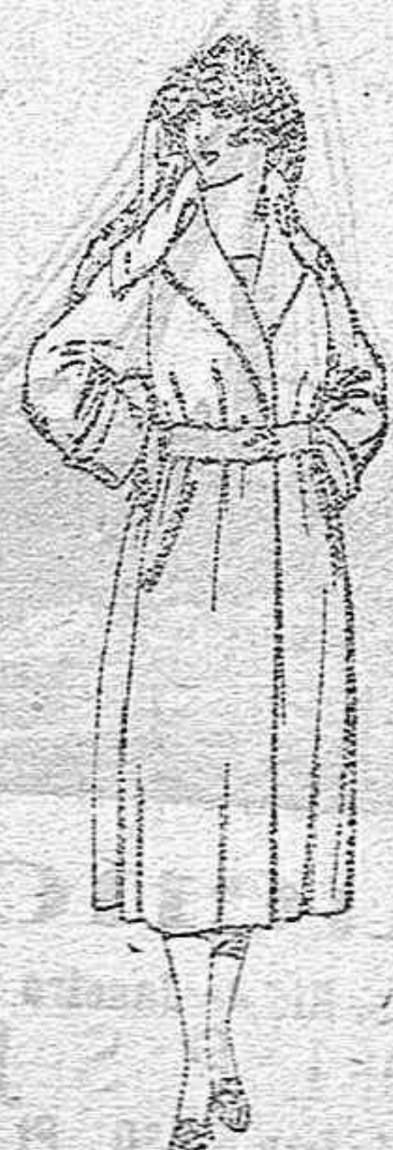
Abrigos de gabardina inglesa impermeabilizada, en negro, azul y color, de ptas. 110 a 200