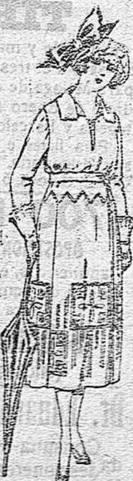
Vestidos de sarga inglesa, lanilla, estambre, etc. en negro, azul y color, adornos bordados, de ptas. 115 a 150