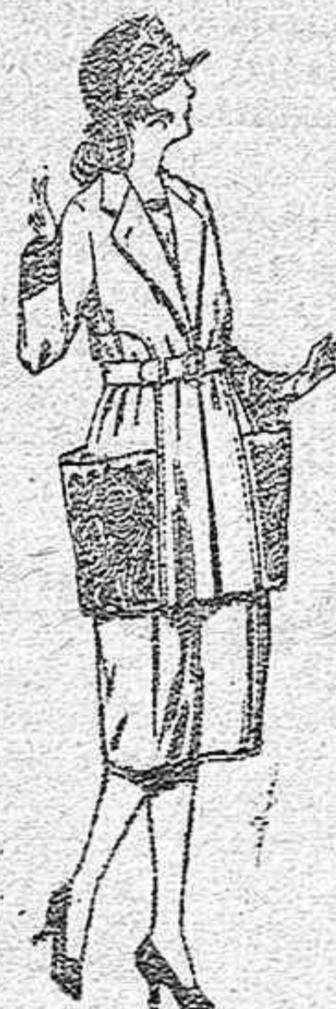
Trajes de gabardina, lanilla, sarga inglesa, etc. en azul y color, adornos bordados, de ptas. 100 a 120