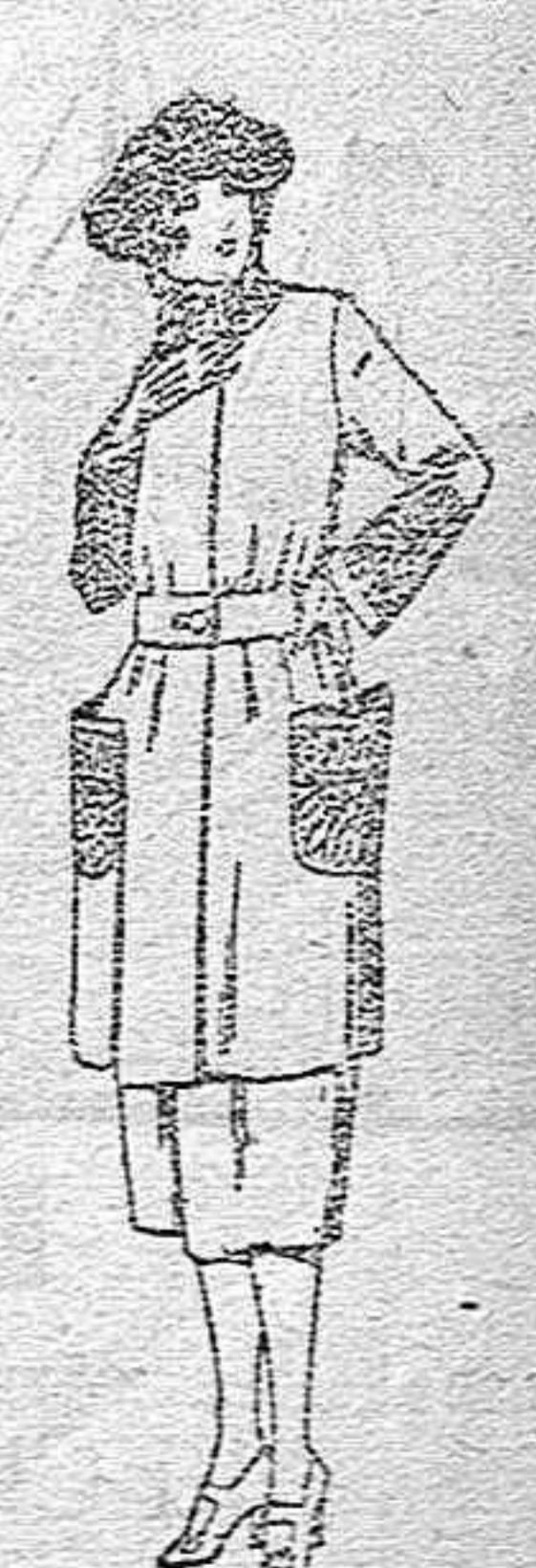
Trajes de sarga inglesa, estambre, lanilla, etc. en negro, azul y color, adornos bordados, de ptas. 145 a 185

Peletería, Camisería, Géneros de punto, Corbatería, Guantería, Sombrerería, Zapatería, Paraguas Bastones, y artículos de viaje.