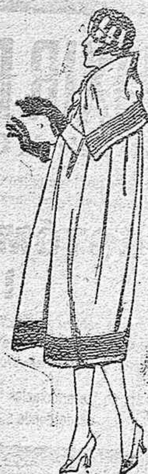
Capas de gabardina inglesa, diferentes colores, pespunte de adorno, de ptas. 130 a 160