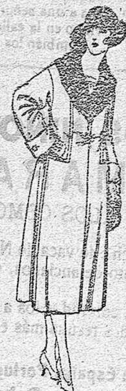
Abrigos de gamuza, pañete en negro, azul y color, adornos terciopelo negro, de ptas. 120 a 150