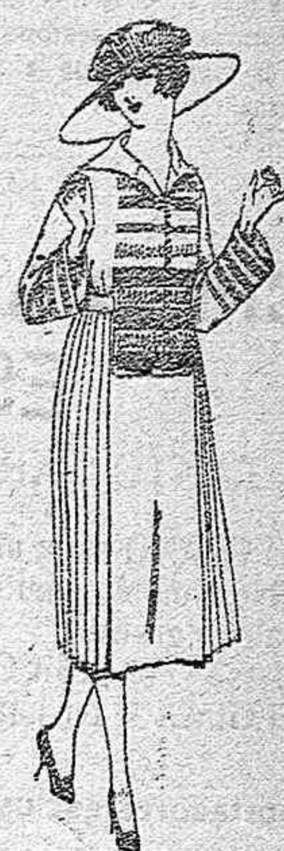
Vestidos de sarga inglesa, lanilla, etc. en negro, azul y color, adornos bordados, de ptas. 100 a 140