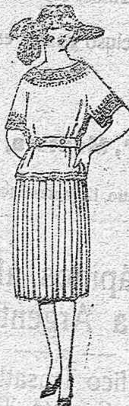
Trajes de lanilla, sarga, etc. en azul y color, de ptas. 90 a 120