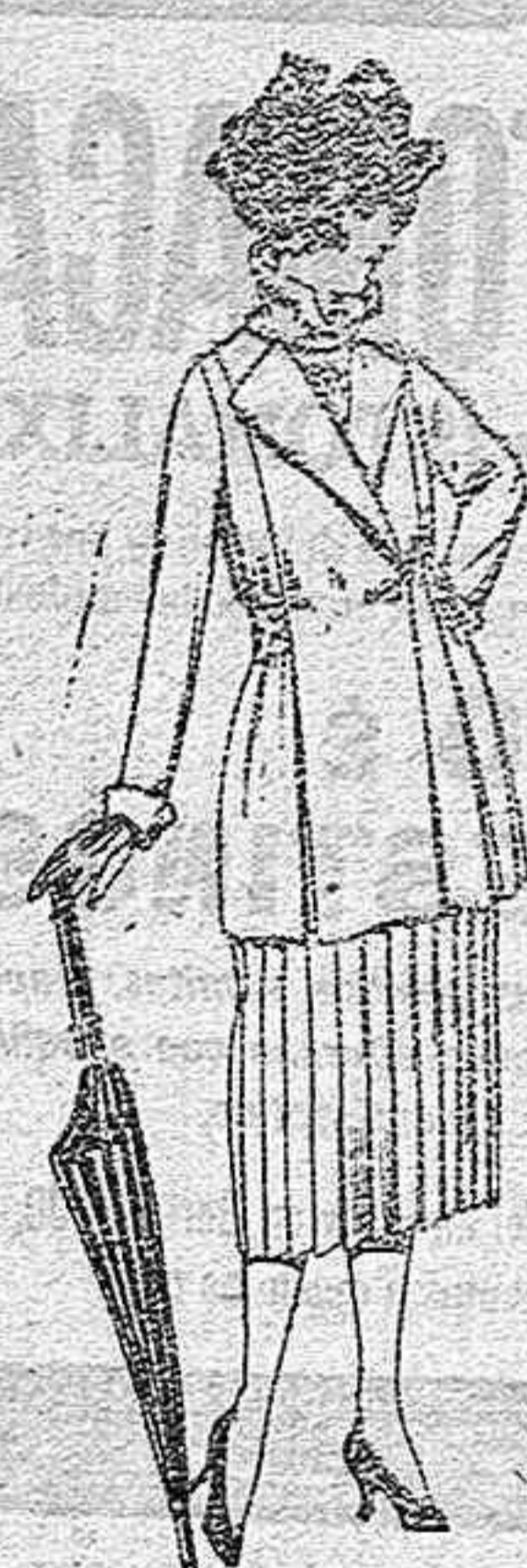
Trajes de gabardina, lanilla, estambre, etc. en negro, azul y color, de ptas. 130 a 160

Sucursales: Madrid, Barcelona, Alicante, Bilbao, Cádiz, Cartagena, Gijón, Granada, Málaga, Palma de Mallorca, Santander, Sevilla, Valencia, Valladolid, Zaragoza.