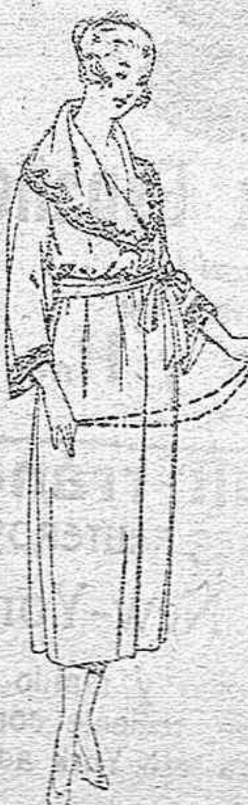
Batas franela, diferentes colores, con adornos bordados y de marabú, de ptas. 20 a 60