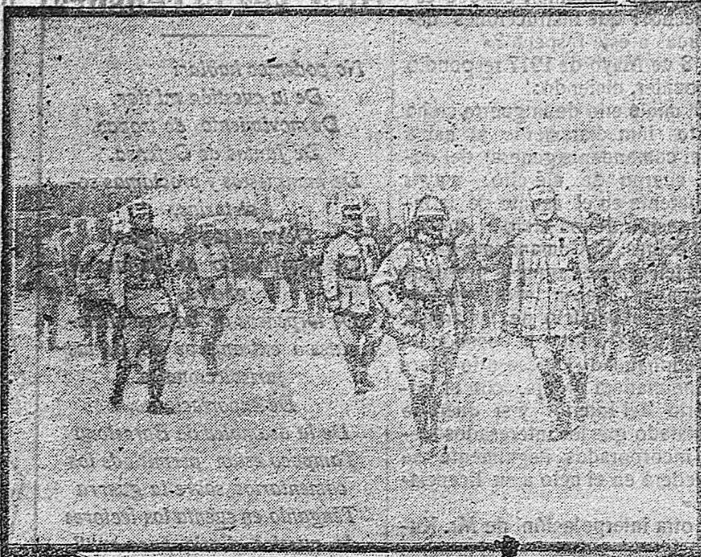
REVISTA DE TROPAS FRANCESAS EN ATENAS

Pero en la misma novela de Julio Verne, y en el mismo episodio, hay algo que el señor Dato no recuerda. Nosotros, sí. Uno de los personajes quiere dar un consejo a todos los viajeros antes de que se emprenda la arriega aventura. Nadie quiere escucharle. Nadie quiere que se ponga en duda su intrepidez. Se le abochorna, se duda de su valor, y el personaje que allí representa la sensatez y la serenidad se ve obligado a tragarse su consejo. Hasta que después de haber pasado el tren por el espantoso abismo logra hacerse oír. Y dice entonces: «Señores: lo que yo quería decir era que podíamos haber pasado los viajeros a pie, uno a uno, por lo que queda de puente, y luego el tren, sólo con el maquinista; así hubiéramos salvado nuestras vidas de la catástrofe, ca-