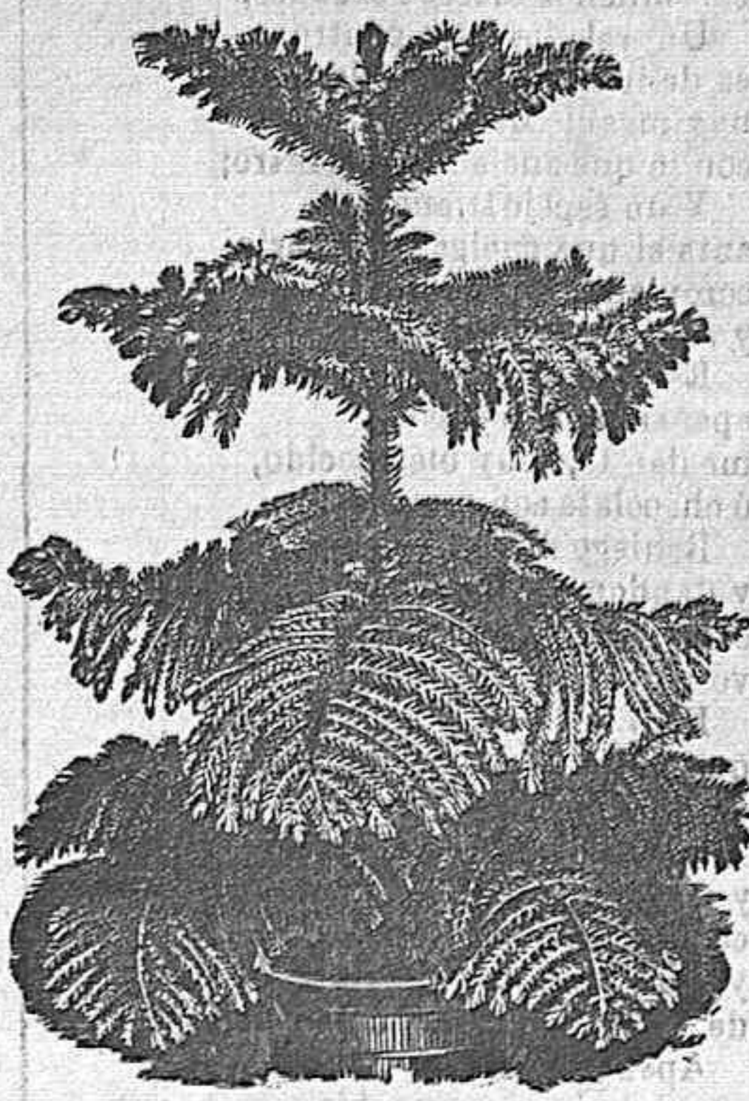
Adorno con plantas y flores de salones, comedores, bailes, etc.

Arboles, plantas, semillas y flores de todas clases. 3-8