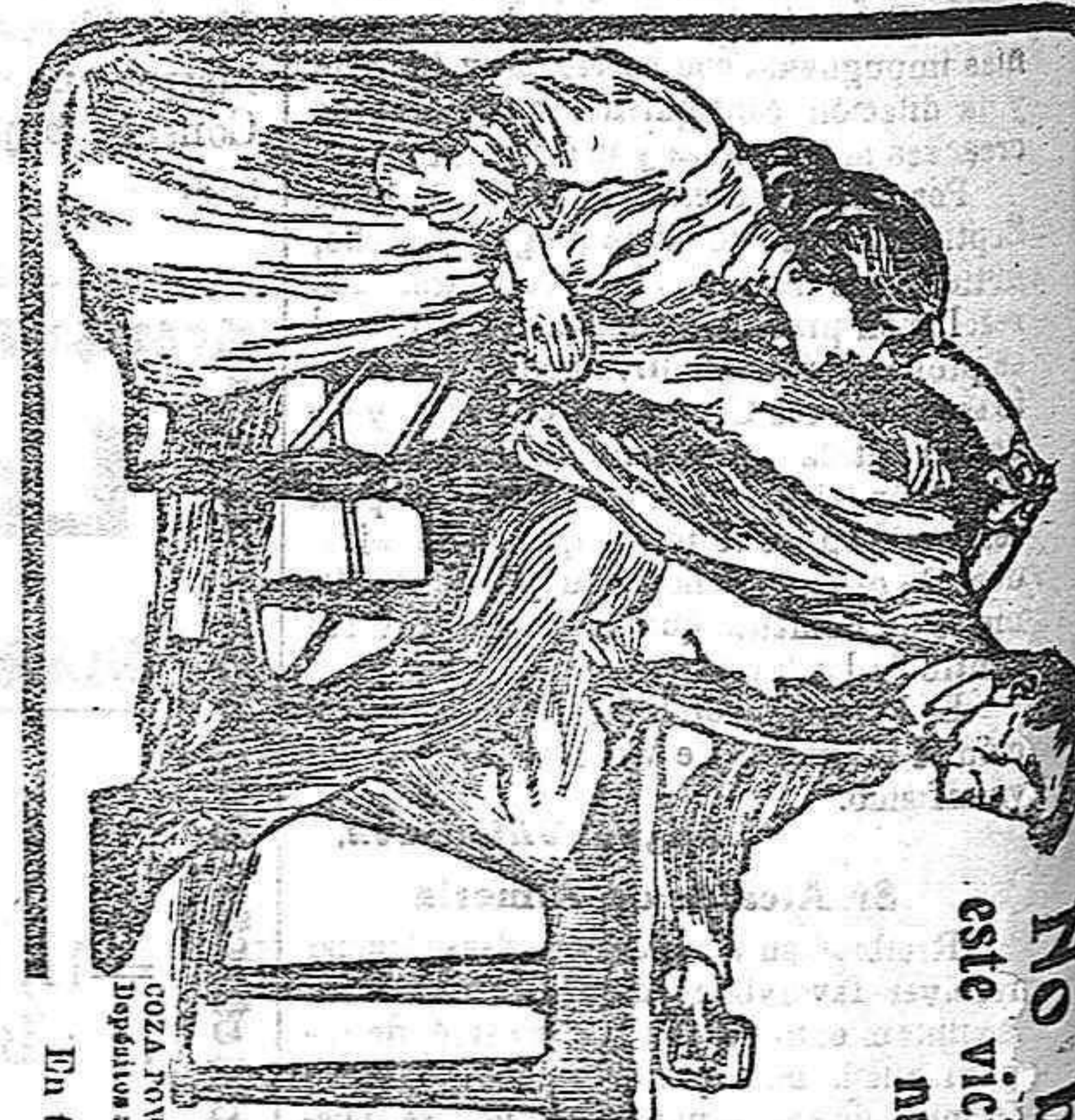
En todas las buenas farmacias.

No bebas más, este vicio no es más que nuestra ruina.