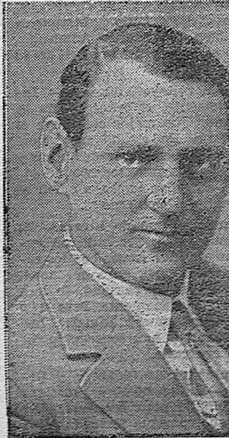
El príncipe Frederik, heredero de trono de Dinamarca, cuyo enlace con la princesa Ingrid de Suecia está anunciado para dentro de unos meses

Una de oficial de Oficinas militares en el Estado Mayor Central; otra de capitán de Ingenieros en