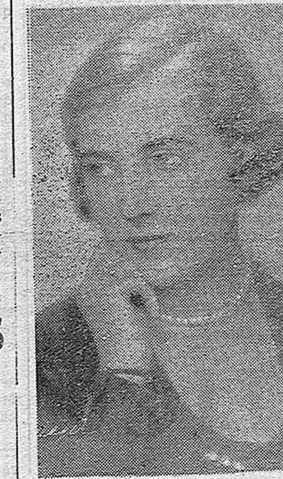
La princesa Ingrid de Suecia, prometida del príncipe Frederik