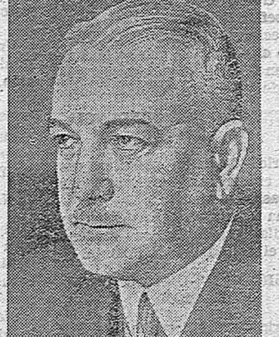
BARON VON NEURATH