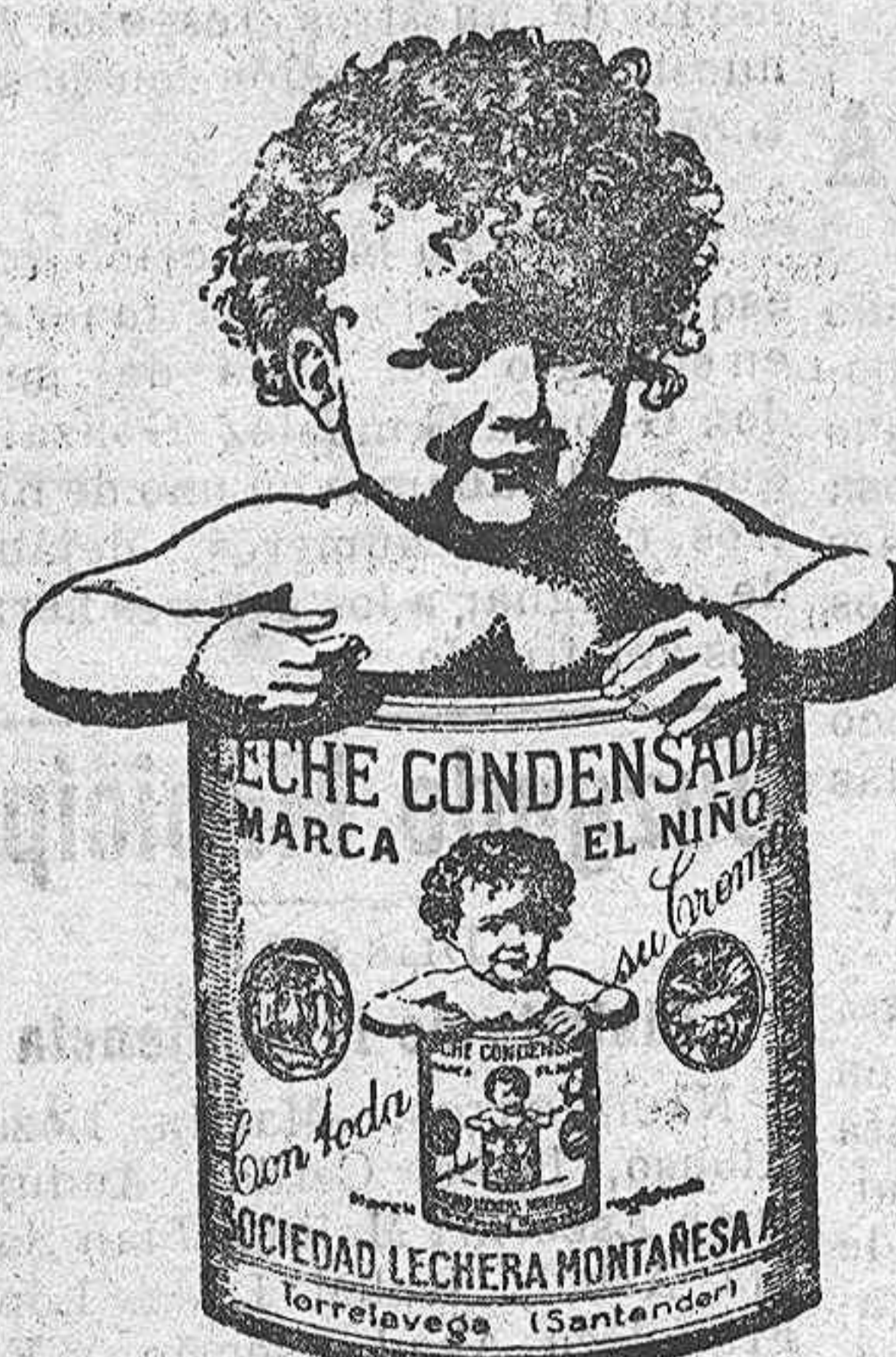
MARCA NACIONAL Diploma de Honor y Medalla de Oro en la Exposición Agrícola de Barcelona, de 1927