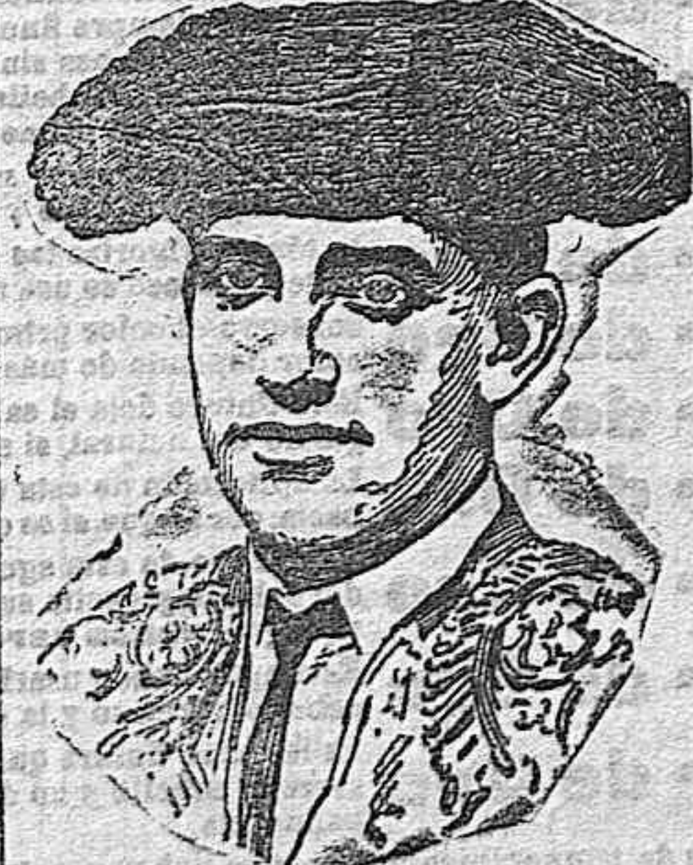
El gran torero Juan Belmonte, que ha sido herido por un toro en la plaza de Sevilla