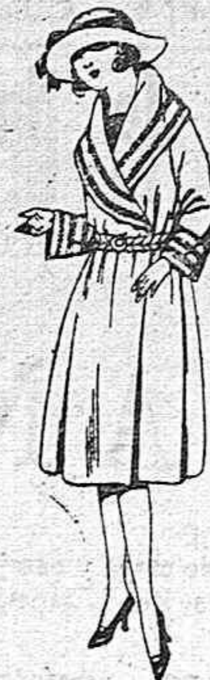
Abrigos de terciopelo de lana, gamuza, etc., en negro, azul y color, para jovencitas de 12 a 15 años. De ptas. 65 a 95