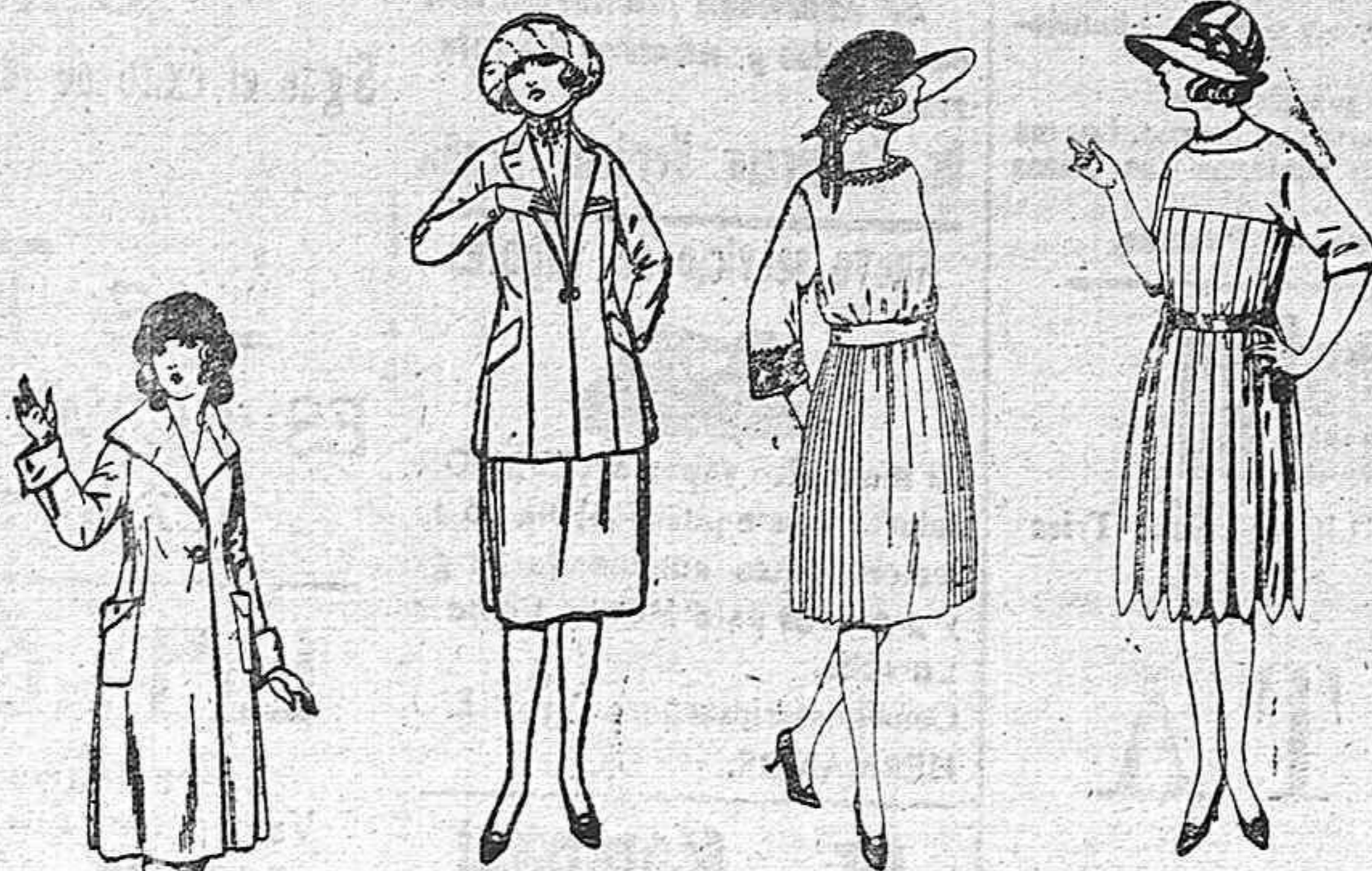
Trajes de sarga inglesa, gabardina, etc., en azul y color. De ptas. 85 a 100