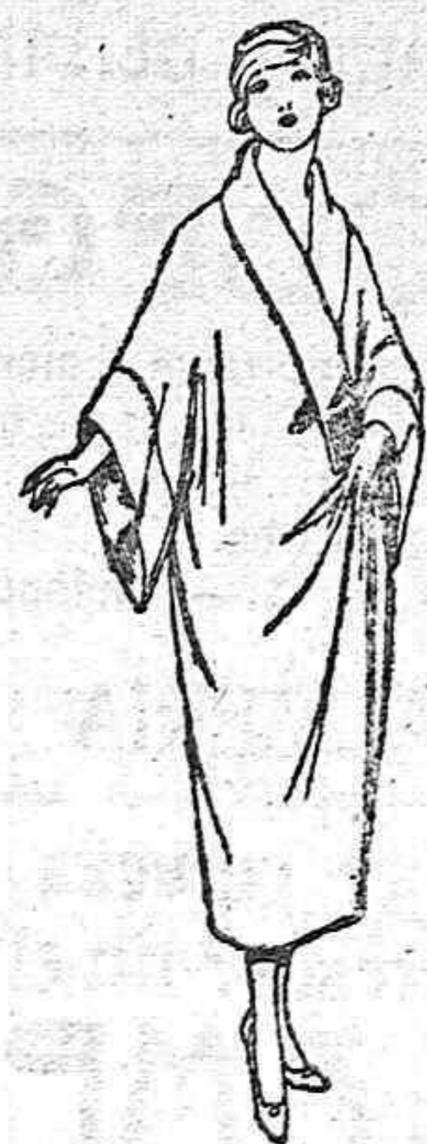
Batas de franela de la a, adornos de diferentes colores. De pesetas 30 a 45.