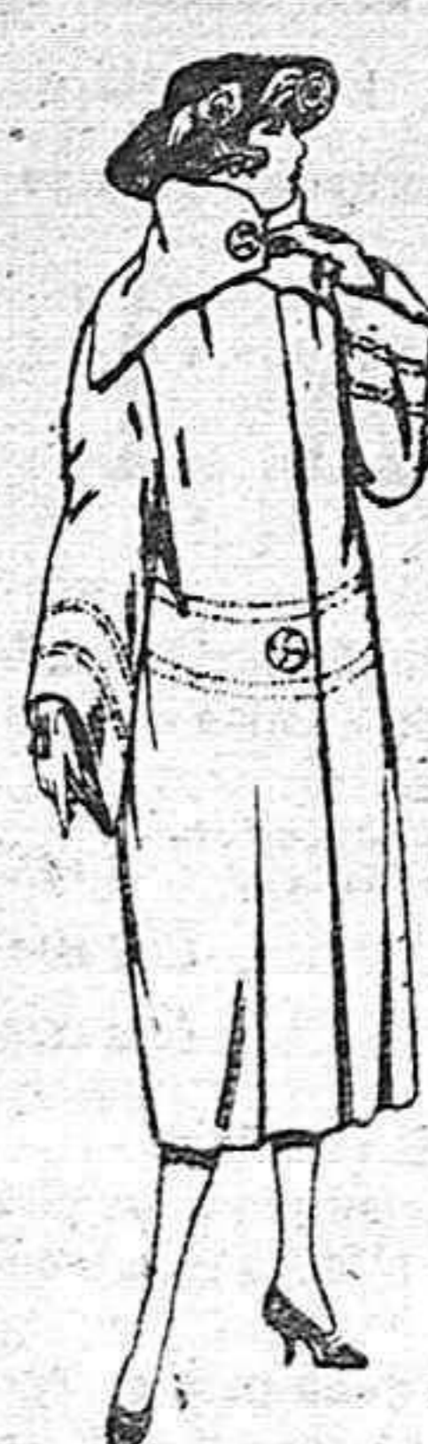
Abrigos de terciopelo de lana, ratina, etc., en negro, azul y color, adornos pespunte seda. De pesetas 110 a 200