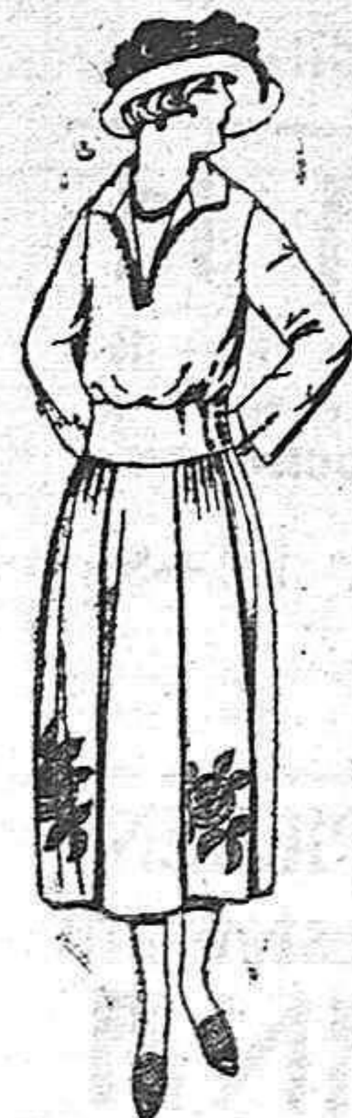
Vestidos de sarga inglesa, estambre, etc., en negro, azul y color, adornos bordados a mano. De pesetas 100 a 140.