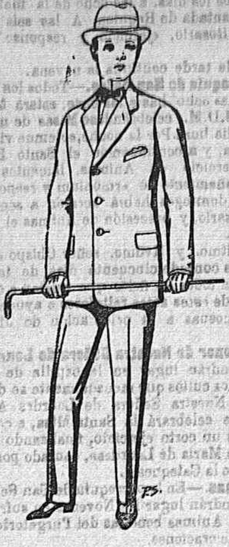
Trajes de pates para juveniles de 10 a 16 años De Ptas. 14 a 50