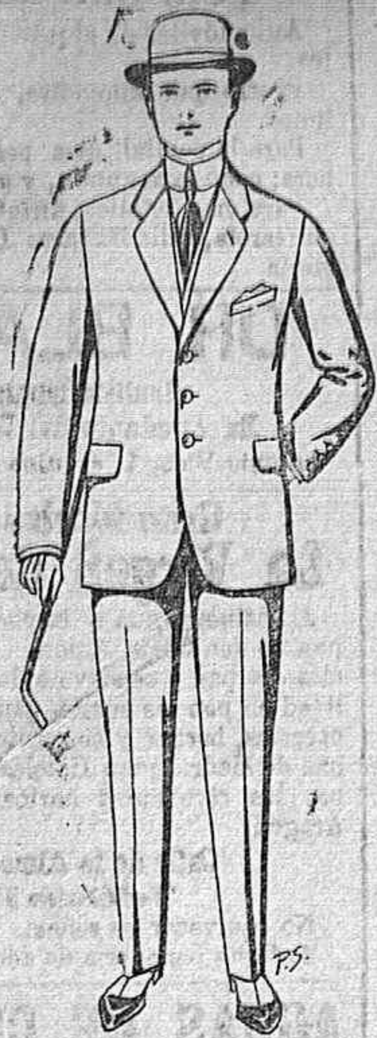
Trajes de cheviot, pates, etc. De Ptas. 17.50 a 70