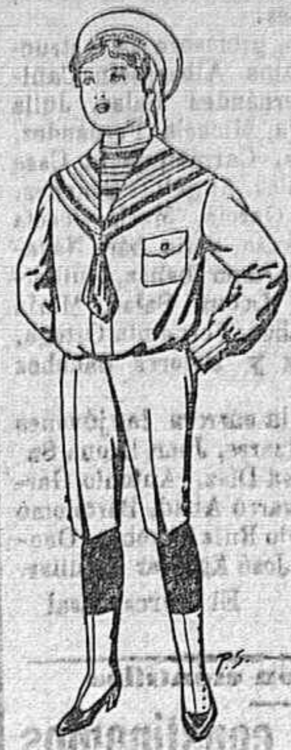
Trajes de jersey azul o negro para niños de 4 a 9 años De Ptas. 10 a 25