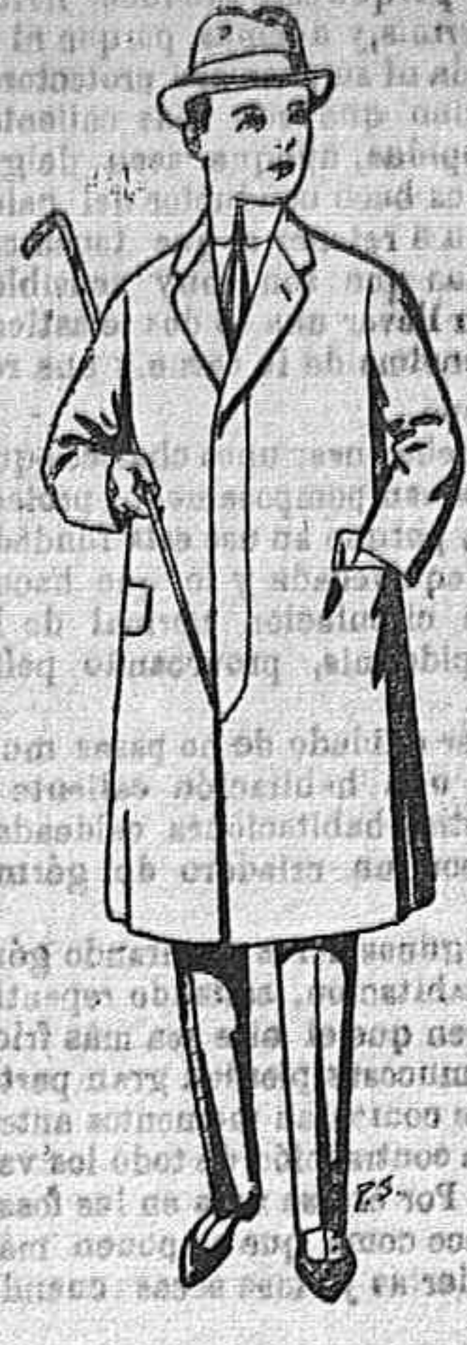
Chabanes de lana para juveniles de 10 a 16 años De Ptas. 14 a 50