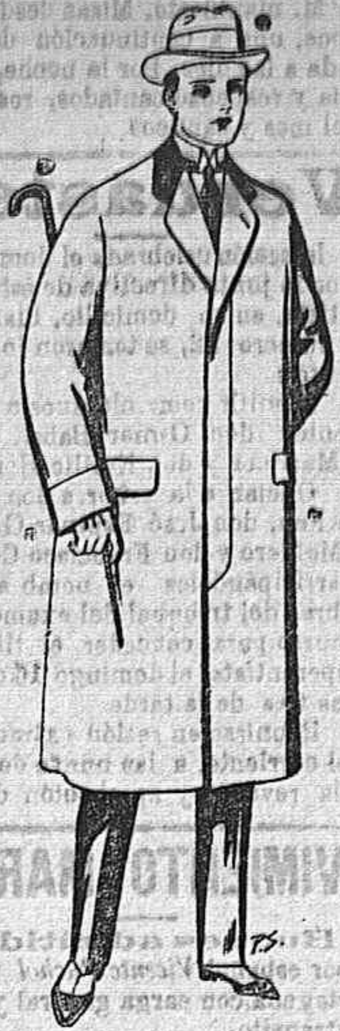
Chabanes de pates, cheviot o melton De Ptas. 25 a 100