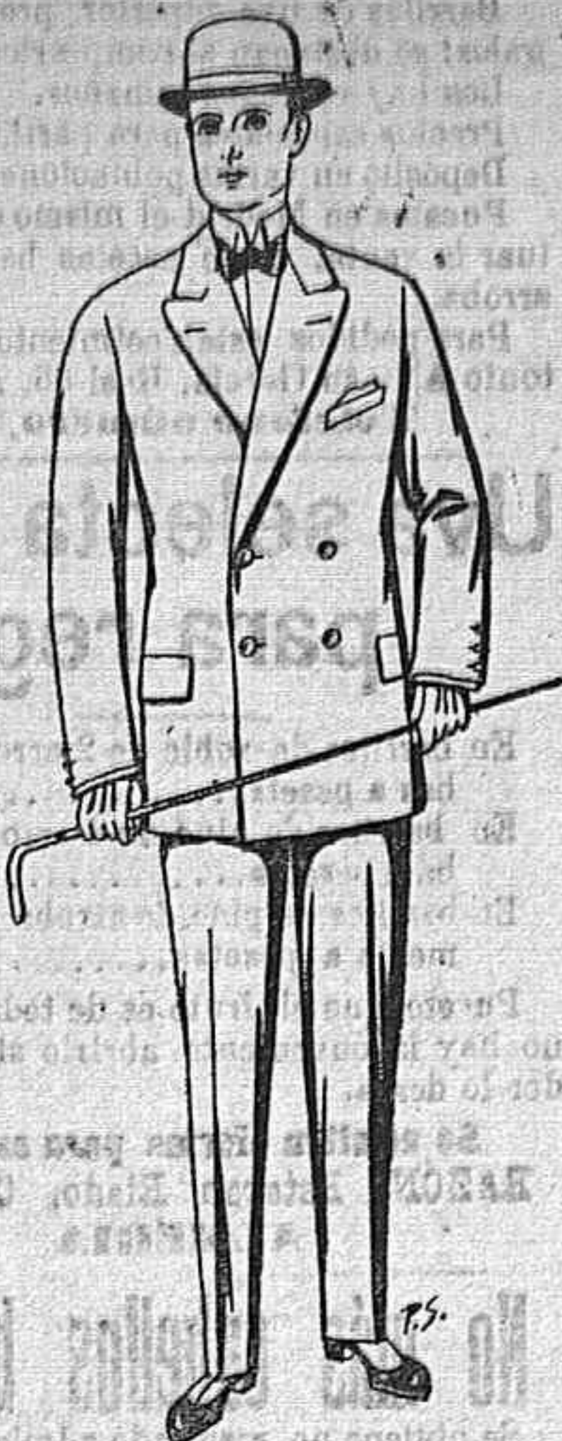
Trajes de pates, cheviot, etc. De Ptas. 25 a 80