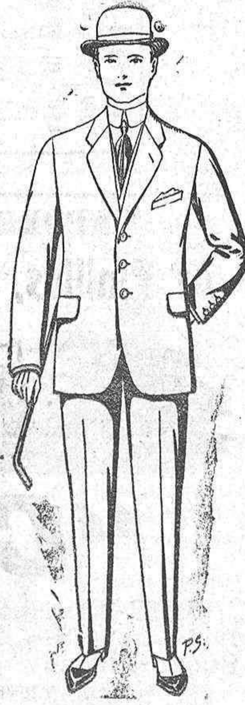
Trajos de paten, cheviot, etc. De pesetas 25 a 30