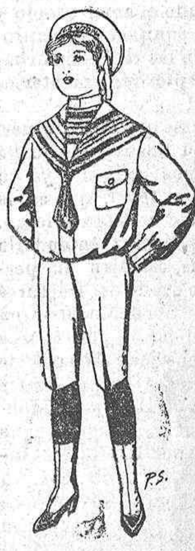
Trajos de jerga azul o negra niños de 4 a 9 años De pesetas 10 a 26