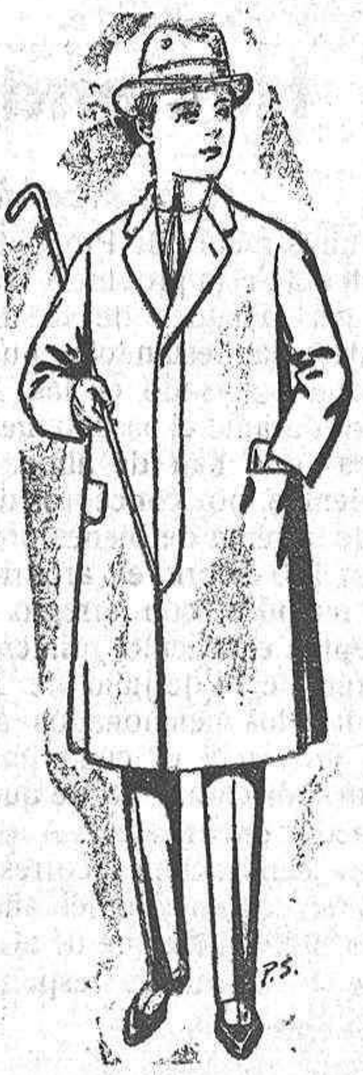
Gabanes de lana para jovencitos de 10 a 16 años De pesetas 14 a 50