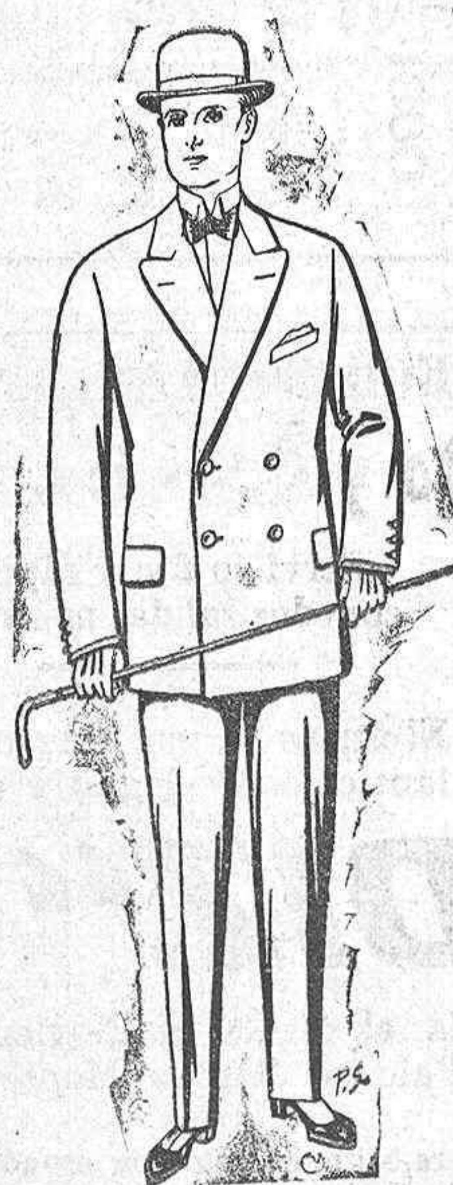
Trajos de cheviot, paten, etc. De pesetas 17'50 a 70