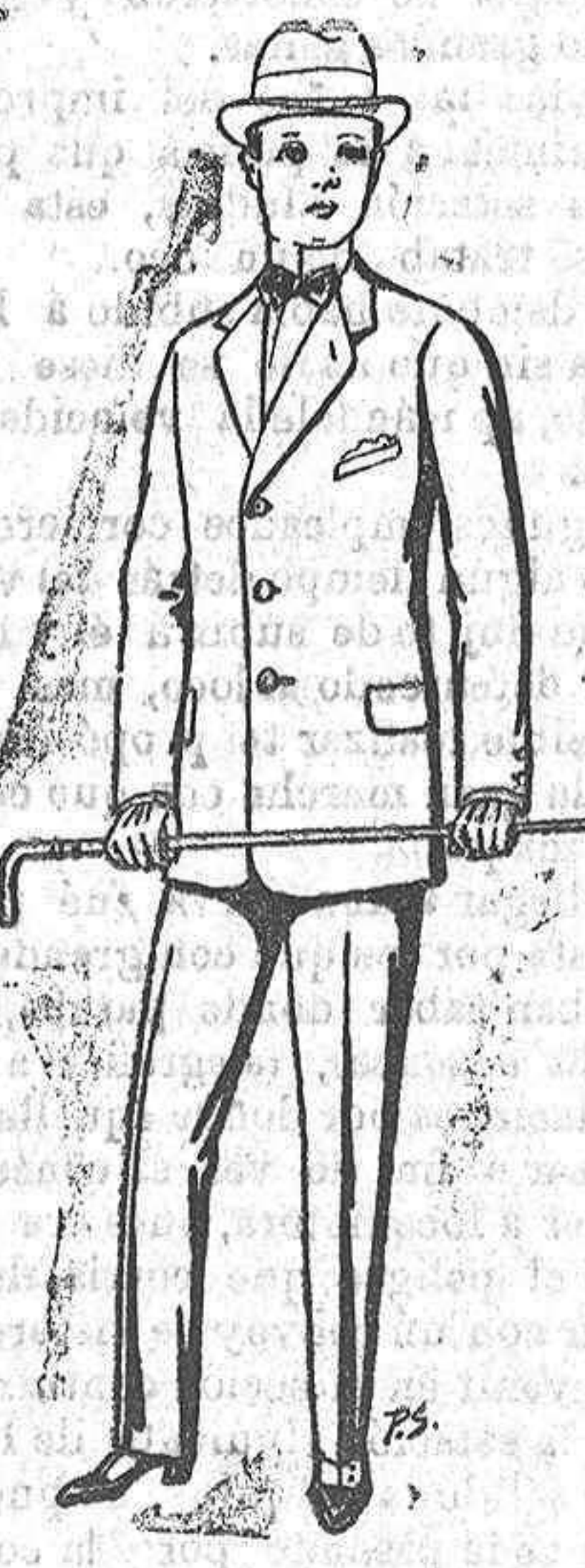
Trajos de paten para jovencitos de 10 a 16 años De pesetas 14 a 50