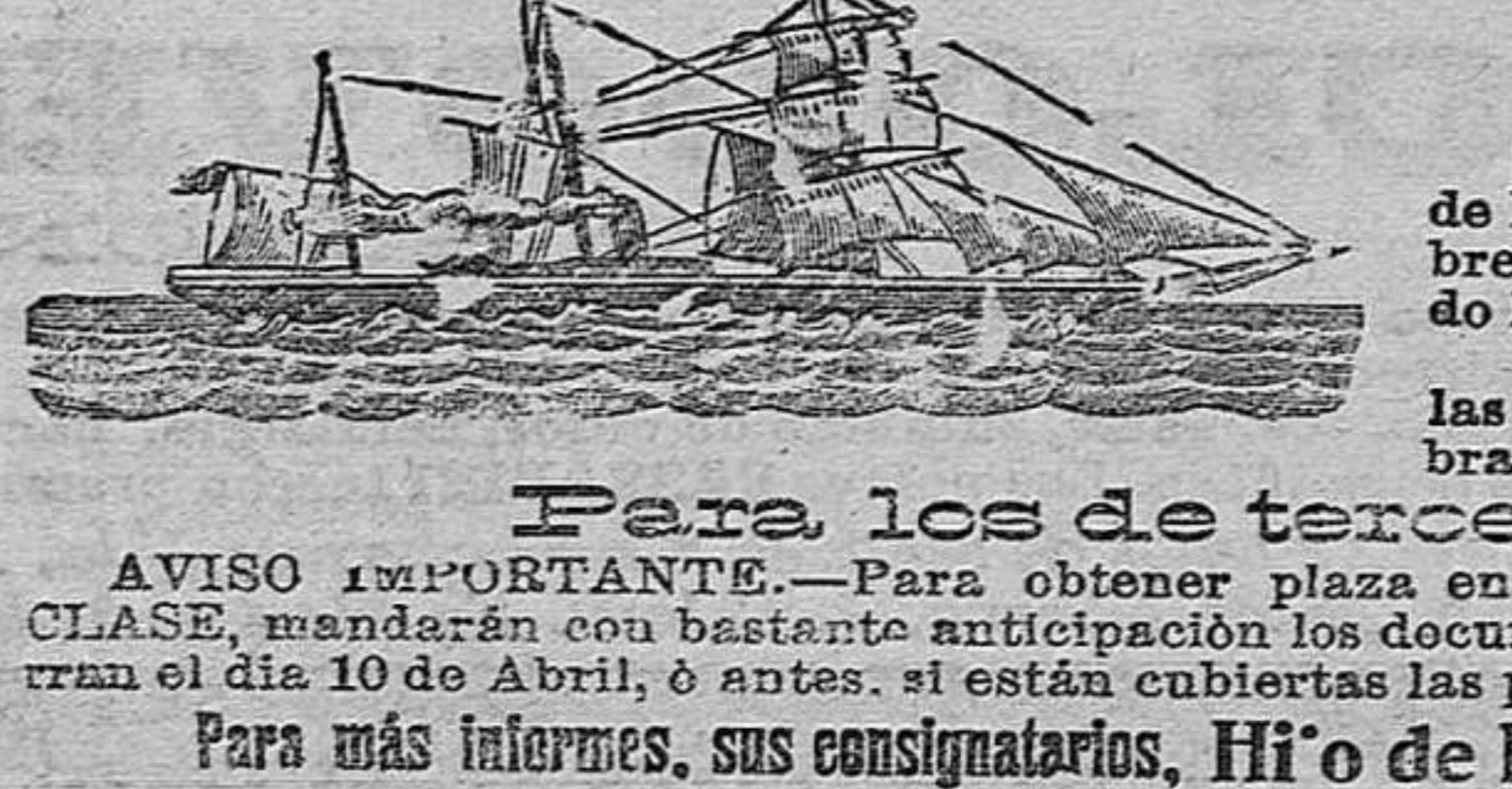
AVISO IMPORTANTE.—Para obtener plaza en estos vapores correos hay que solicitarla con bastante anticipación los documentos que ordena la vigente ley de emigración.—Los manifiestos de pasaje se cierran el día 10 de Abril, o antes, si están cubiertas las plazas asignadas a este puerto.

Servicio fijo, rápido y directo EL 12 DE CADA MES por el puerto de ALMERIA para el transporte de pasajeros con destino al BRASIL y BUENOS AIRES (América del Sur)