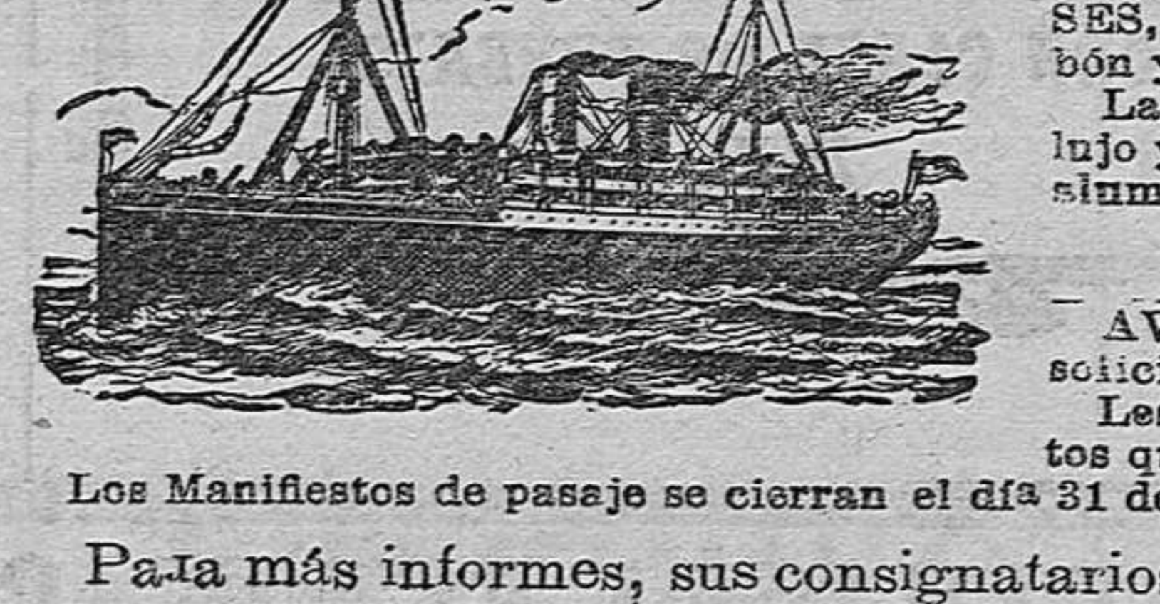
Los Manifiestos de pasaje se cierran el día 31 de Marzo o antes si están cubiertas las plazas asignadas a este puerto.

Servicio extraordinario, rapidísimo y directo el 2 de Abril por el puerto de Almería para el transporte de pasajeros con destino a SANTOS, MONTEVIDEO y BUENOS AIRES (AMERICA DEL SUR)