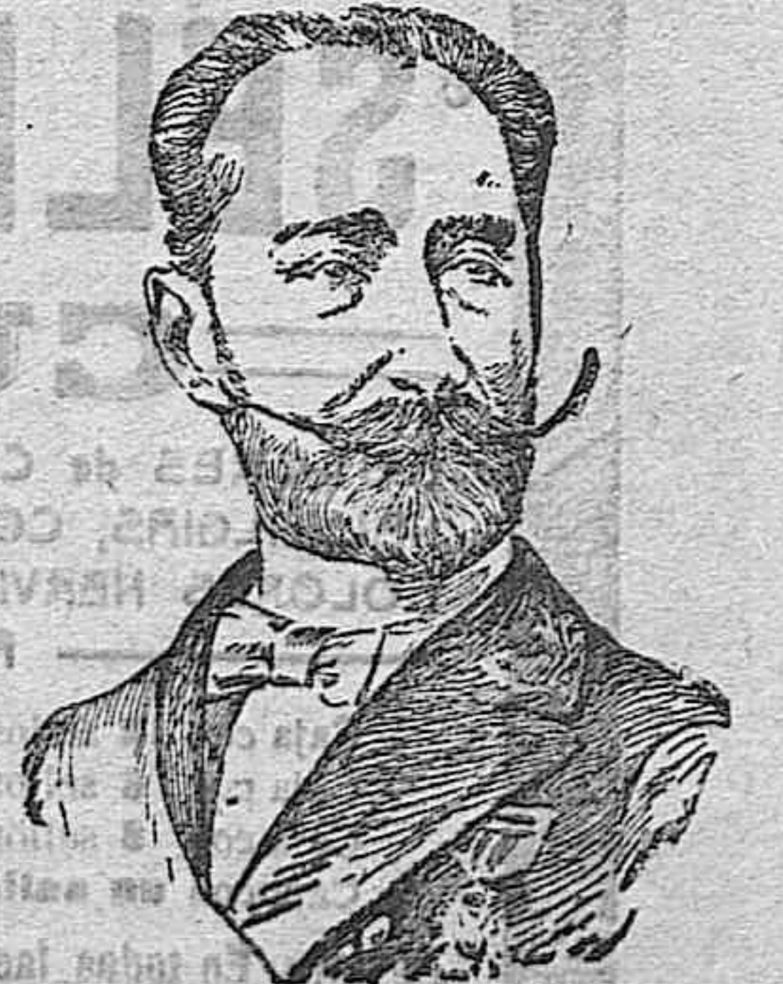
El exministro D. Amós Salvador que ha logrado la unión de los liberales

La emoción intensa de este momento, en el que a sinceridad y el hondo afecto transforman el acto vulgar de una comida íntima en función solemne de sentimientos nobles,