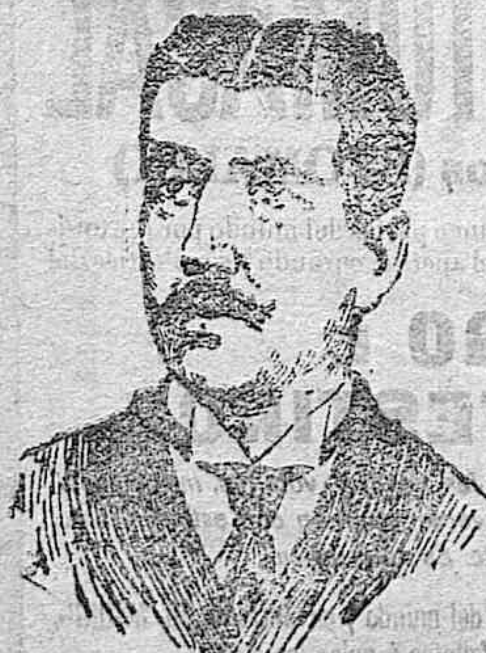
El ministro don Francisco Bergamín que ha sido nombrado recientemente Presidente de la Academia de Jurisprudencia.

la denuncia formulada en la sesión anterior por un concejal contra un empleado de la policía urbana que hacia varios meses no habia prestado servicio por que estaba trabajando casa de un particular.