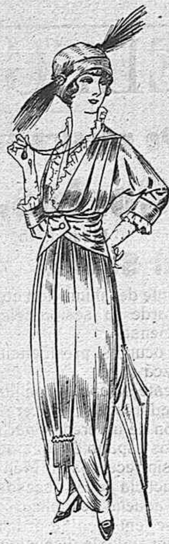
Traje de jerga azul o negra y géneros novedad para señora de 35 a 40 pesetas