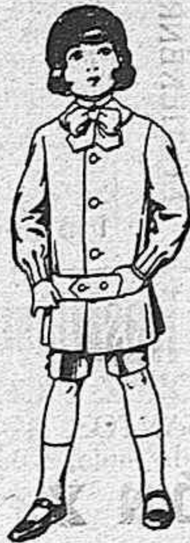
Trajes de lanilla vicuña o jerga, para niños de 4 a 9 años, de 6 a 31 pesetas