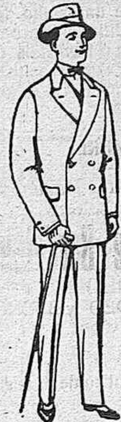
Trajes de estambre, vicuña o jerga, para niños de 10 a 16 años, de 17 a 48 pesetas.