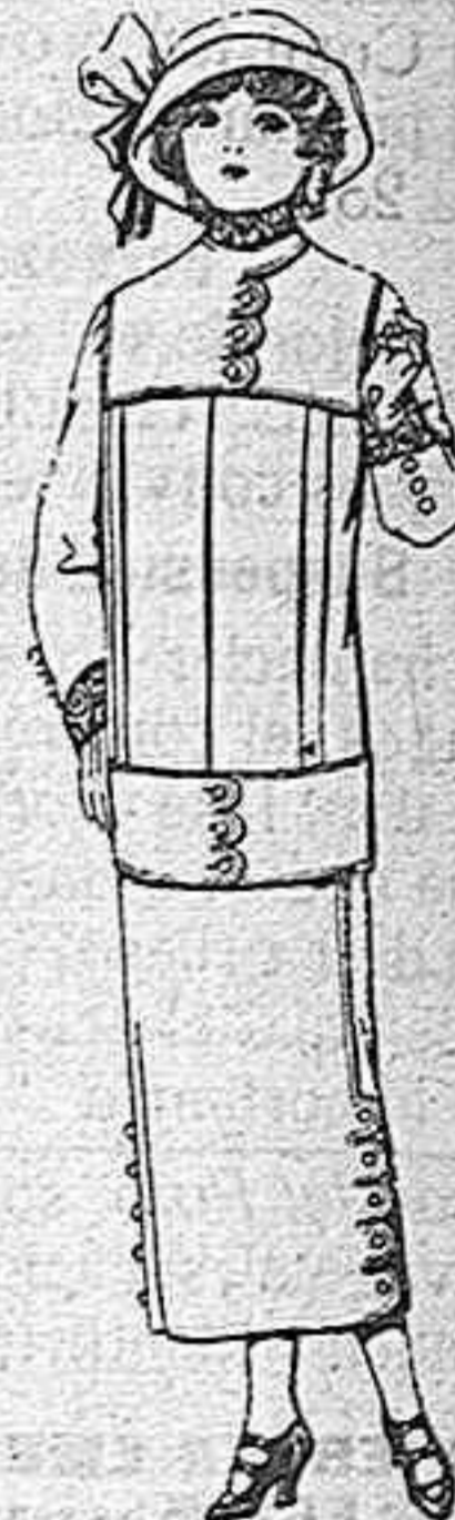
Trajes de lanilla para jovencita de 13 a 16 años, a 27 pesetas