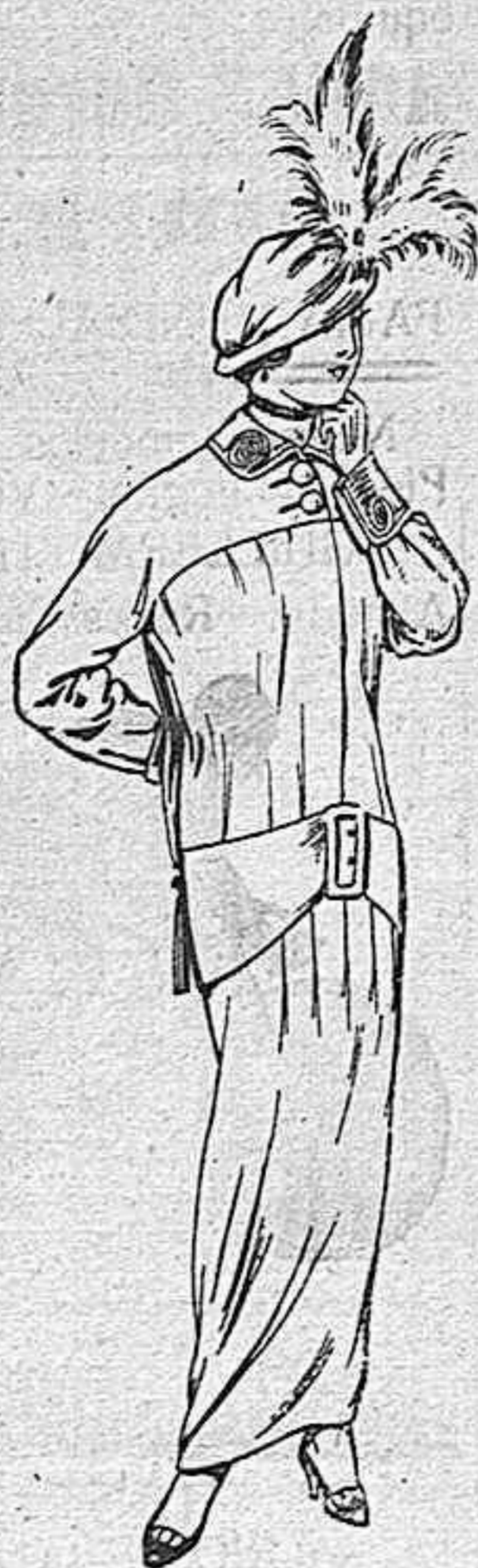
Traje de jerga azul o negra y lanillas para señora, a 40 pesetas