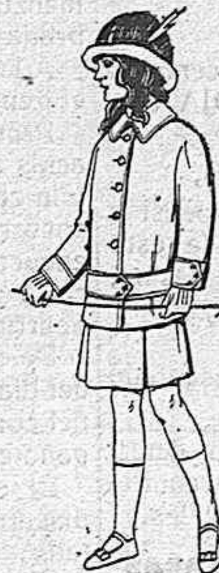
Vestidos de lanilla para niñas de 4 a 12 años de 19 a 21 pesetas.