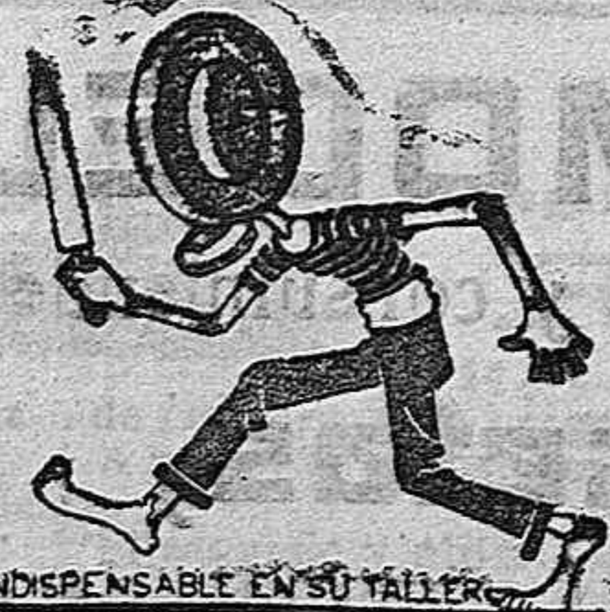
INDISPENSABLE EN SU TALLER

Depositario exclusivo de la gran Fábrica de piedras de afilar y demás aplicaciones marca ONENA, de Santander