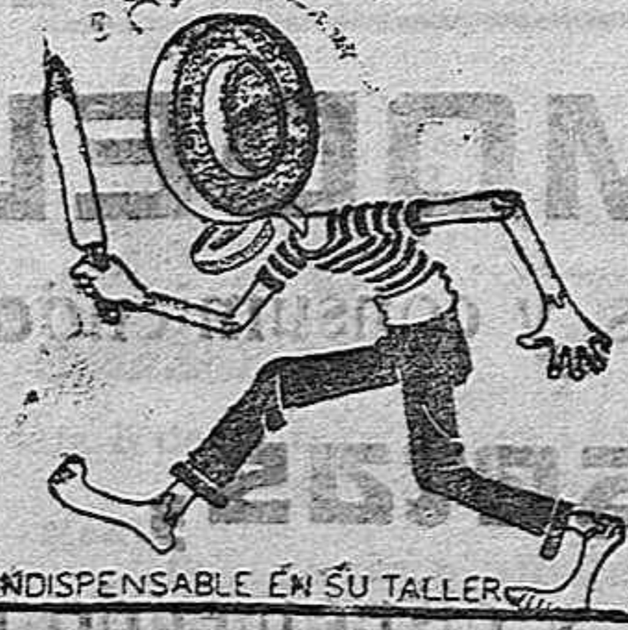
INDISPENSABLE EN SU TALLER.

Depositorio exclusivo de la gran Fábrica de piedras de afilar y demás aplicaciones marca ONENA, de Santander