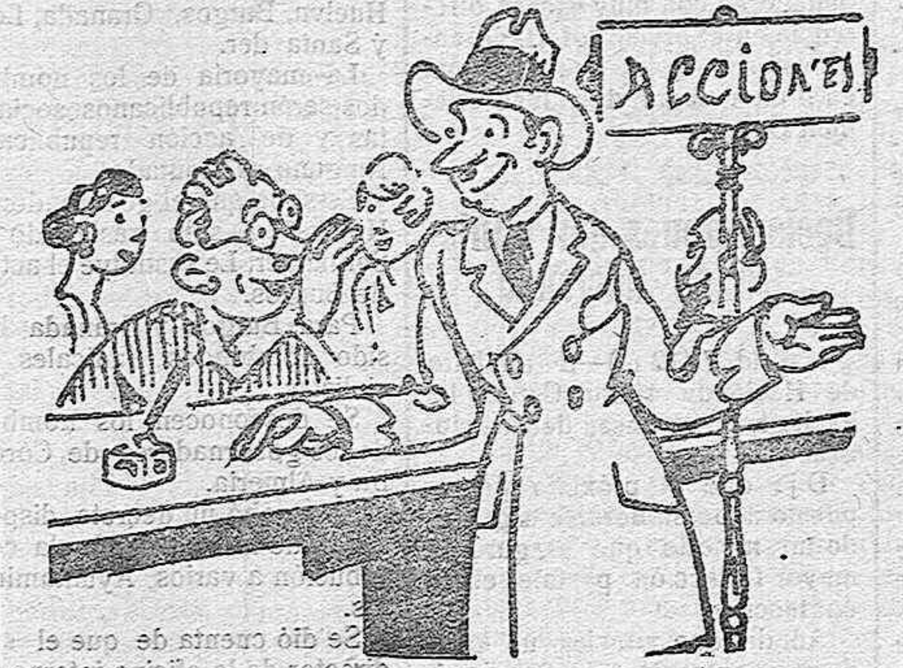
LAS MALAS ACCIONES