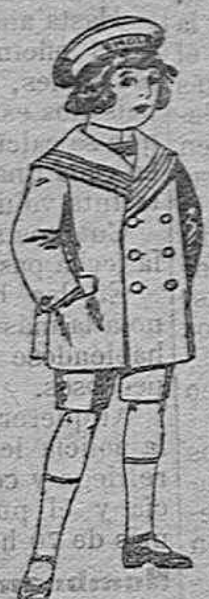
Trajes matelot de vicuña o jergal azul para niño de 4 a 9 años de 14 pesetas a 32.

Ropas confeccionadas para caballero, señora, niño y niña.