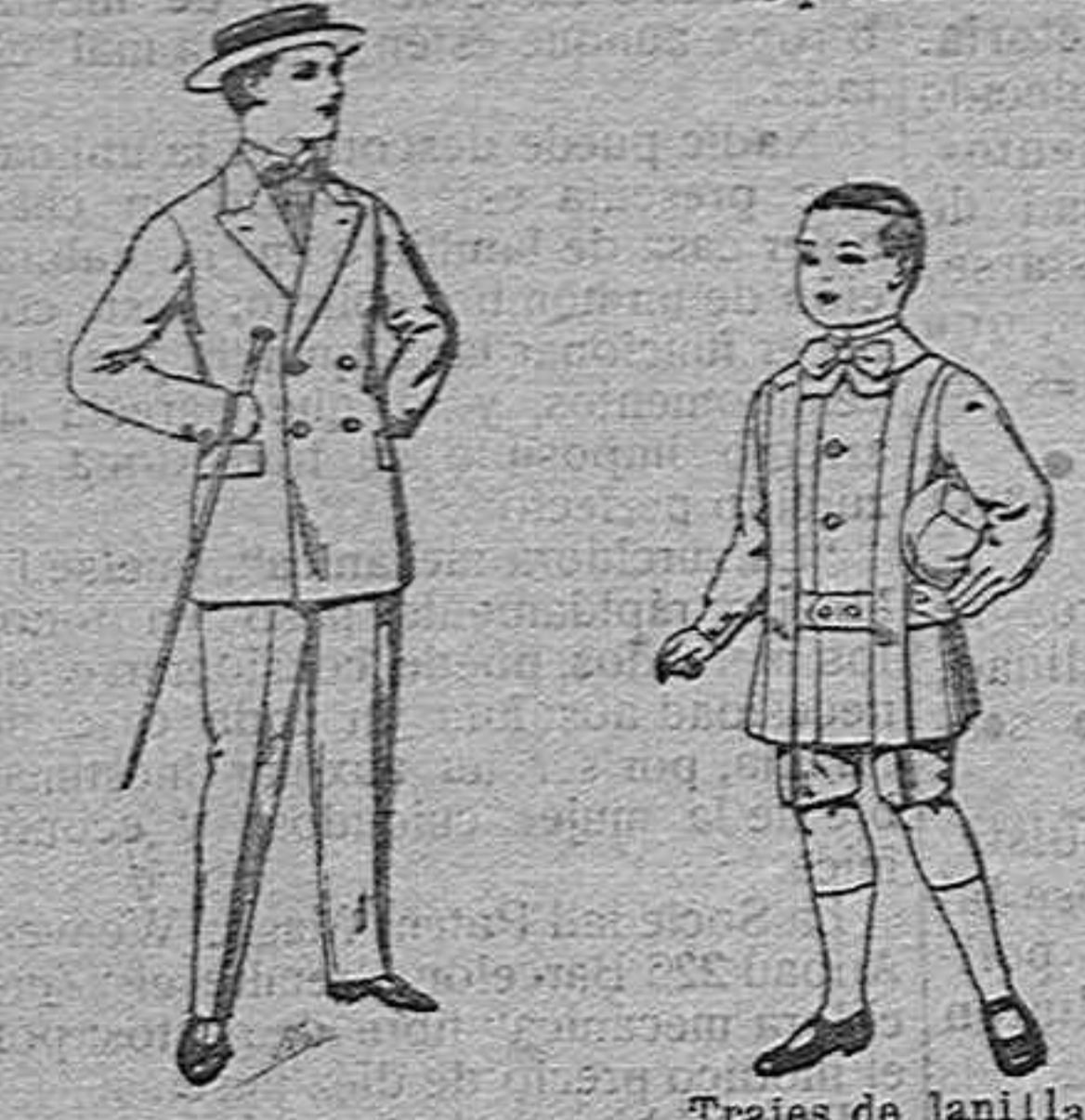
Traje de estambre, vicuña o jerga, para jovencito de 10 a 17 años de ptas 19 a 50. Trajes de lanilla para niños de 4 a 9 años de ptas. 12 a 31.