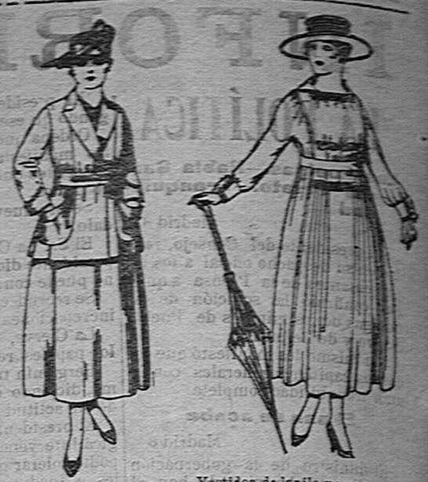
Traje de estambre negro, azul y color. de ptas. 70 a 70. Vestidos de lanilla negra, azul y colores de ptas. 60 a 70.