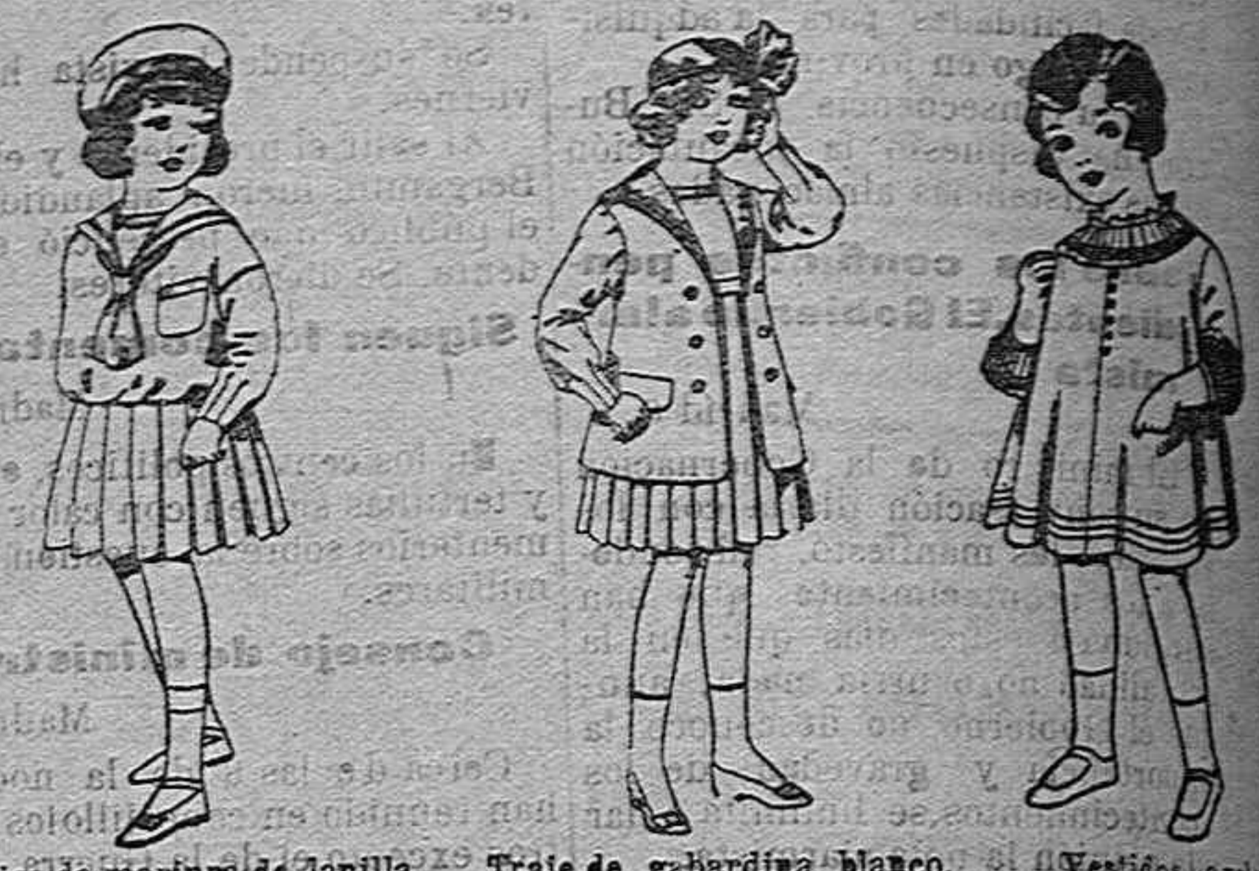
Trajes de marinera de lanilla azul para niñas de 4 a 9 años de pesetas 32 a 38. Los mismos de dril blanco de 13 a 24 pesetas. Traje de guardarina blanco, cuello de erandina bordado, para niñas de 4 a 9 años. de pesetas 22 r 24. Vestidos de lana blanca bordada para niñas de 4 a 9 años. de ptas. 60 a 70.

Camisería, Géneros de punto, Corbatería, Guantería Sombrerería, Zapatería, Paraguas, Bastones y Artículos de viaje.