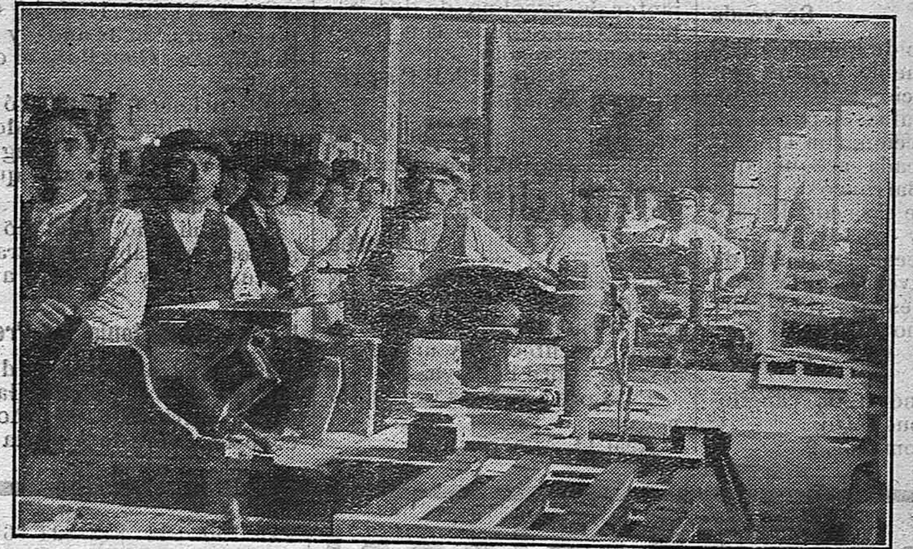
Otro aspecto del taller Ya quedan pocos minutos de jornada y los operarios se disponen a sacar los últimos metros de mosaicos para descansar de la intensa labor hoy simplificada con el concurso de las modernas maquinarias.