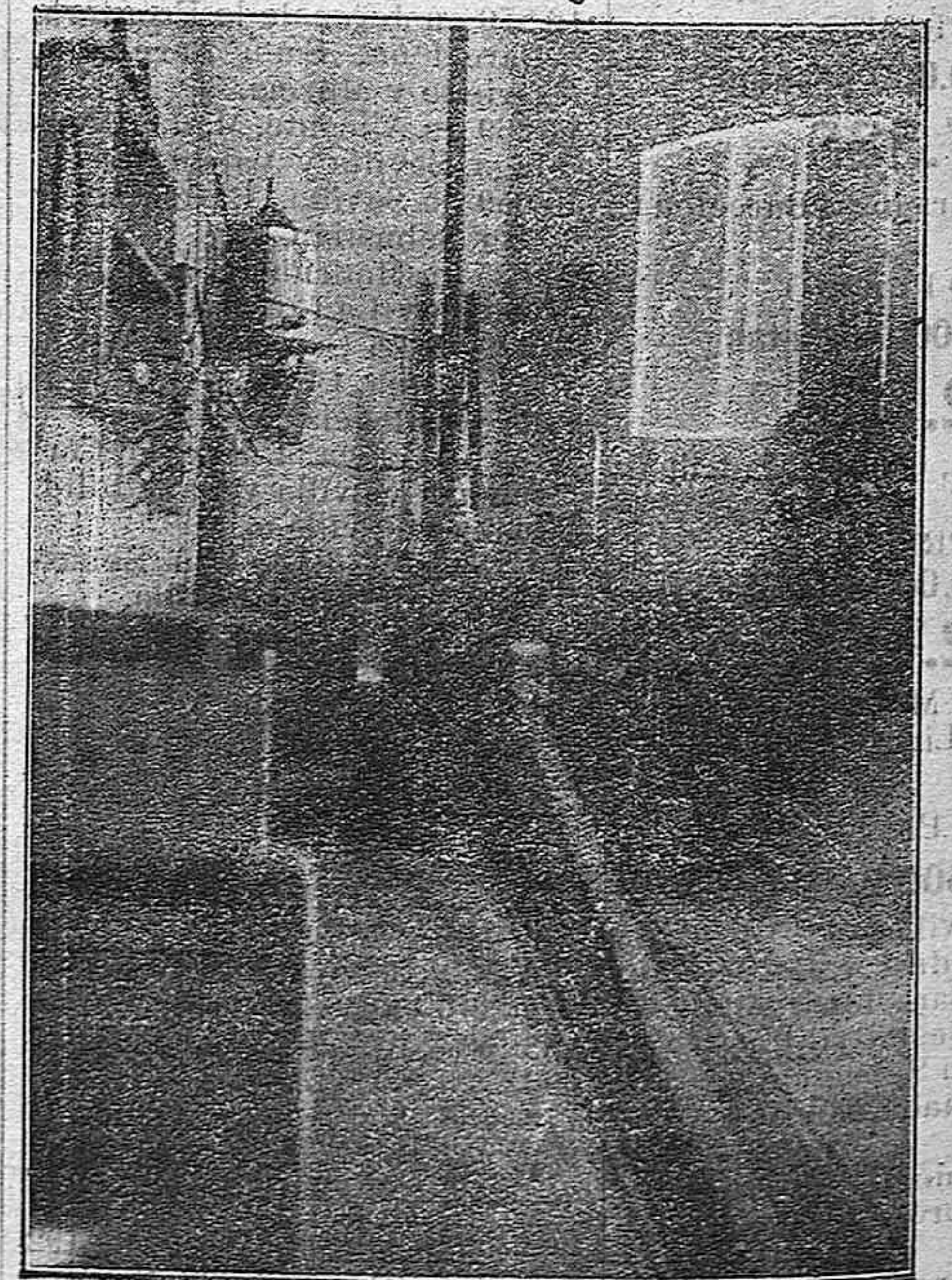
Sala de máquinas Donde los potentes motores trabajan sin cesar para dar actividad y vida a las prensas del taller cercano