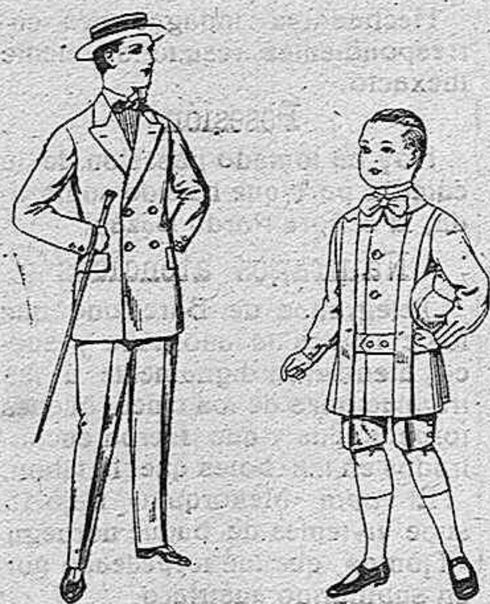
Trajes de lanilla para jovencitos de 10 a 16 años. De pesetas 17 a 48. Trajes de lanilla para niños de 4 a 9 años. De pesetas 12 a 31