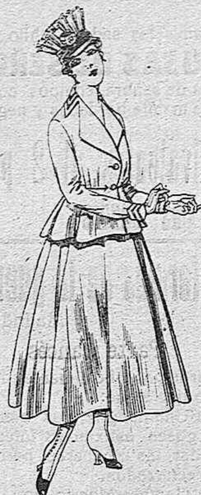
Trajes de lanilla para señora. A pesetas 80