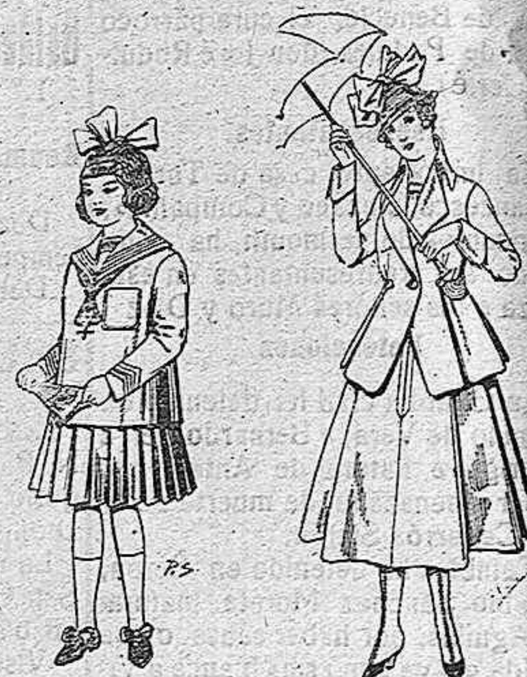
Trajes de lanilla para niñas de 4 a 12 años. De pesetas 32 a 40. Trajes de lanilla para jovencitas de 13 a 16 años. De pesetas 53 a 55