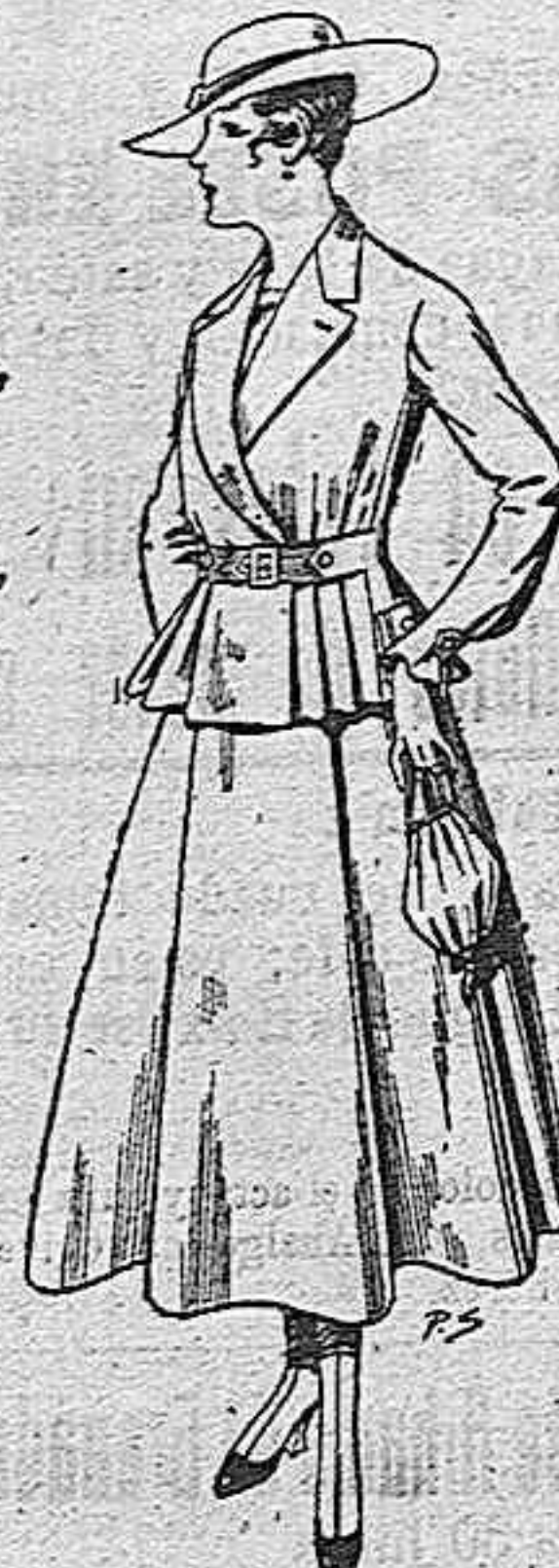
Trajes de lanilla para señora. A pesetas 70