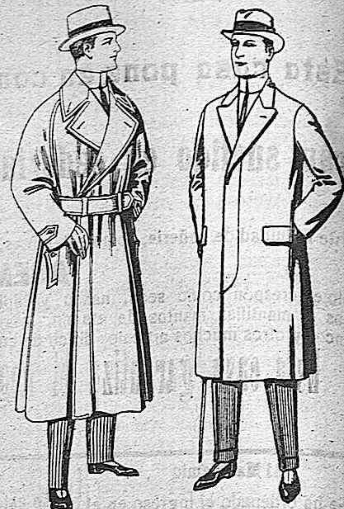
Gabanes Impermeabilizados en color blige. De pesetas 65 a 100. Pardessus de melton o vicuña. De pesetas 25 a 100