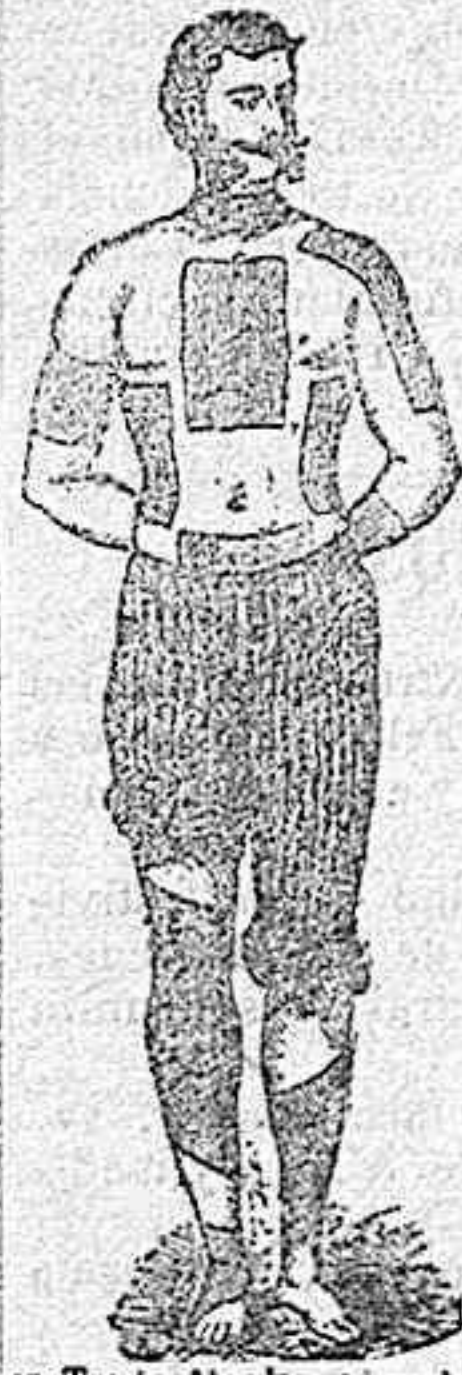
Yo Trade Mark Registered.