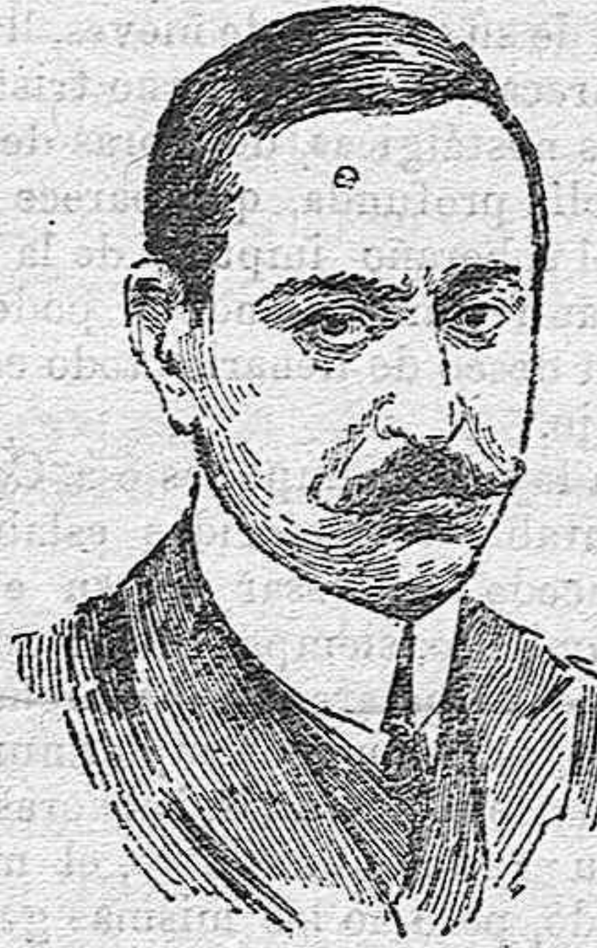
D. José Garcia Prieto, ministro de Fomento.