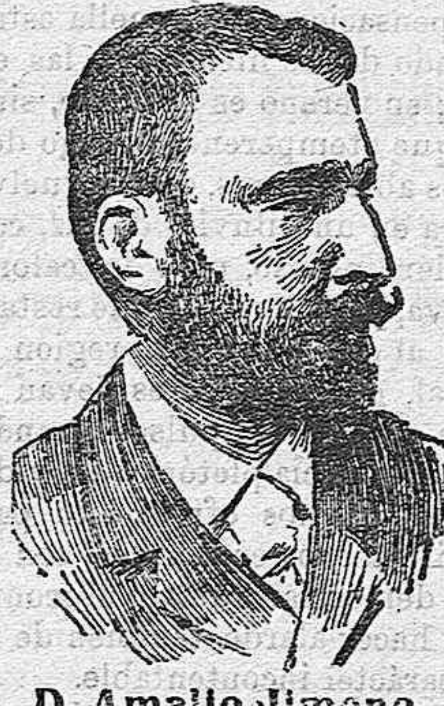
D. Amallo Jimeno, ministro de Instrucción Pública.