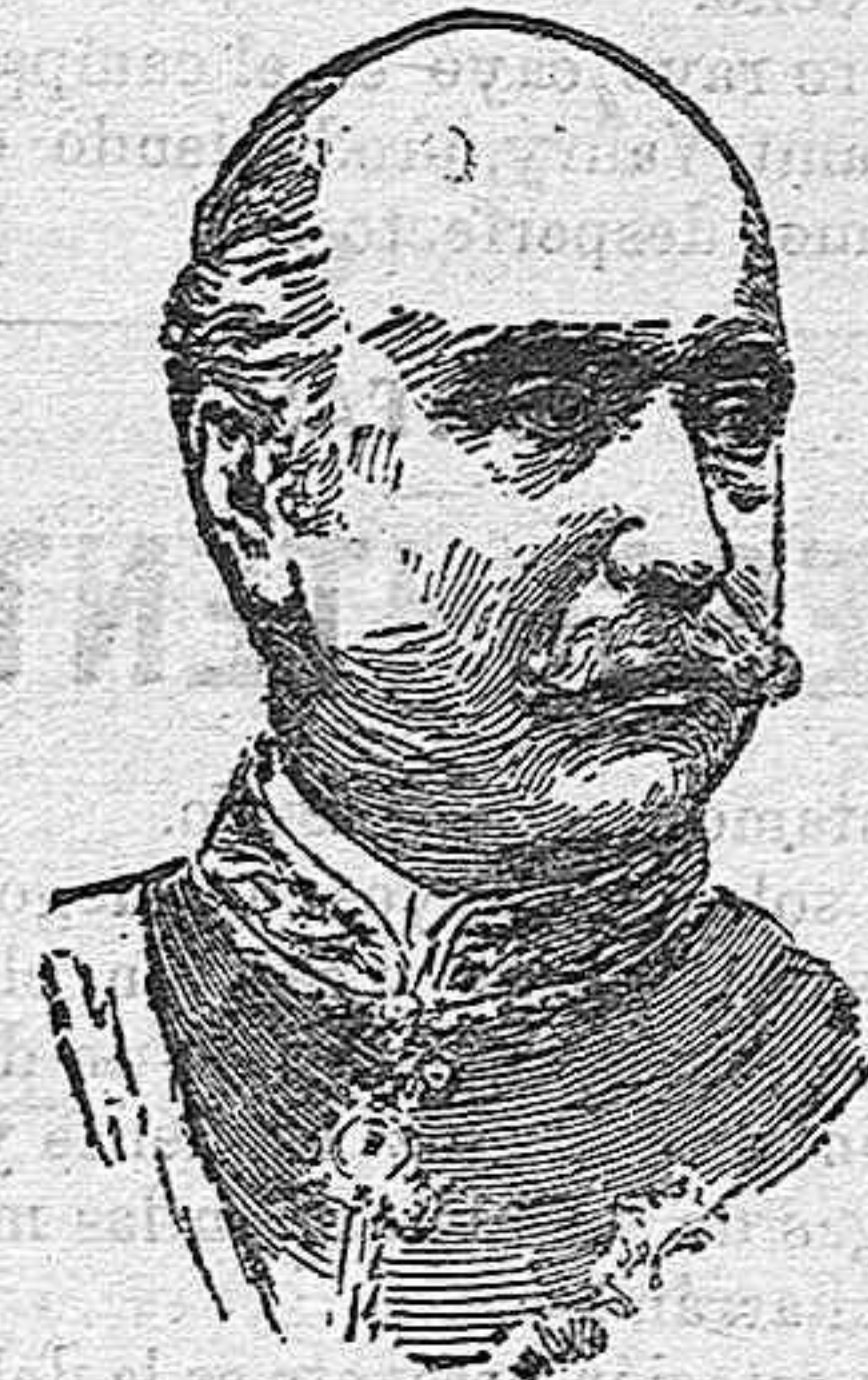
D. Juan Navarro Reverter, ministro de Hacienda.