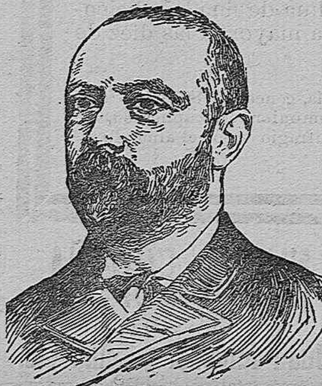
director de "El Motín."