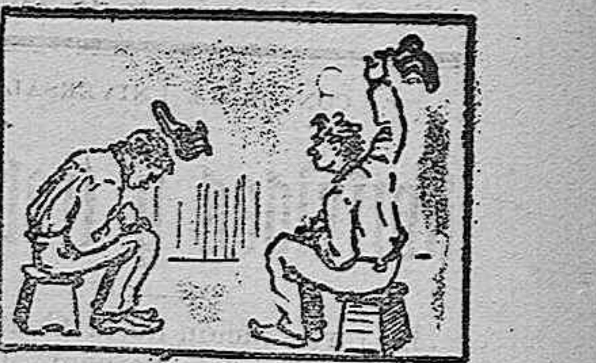
(La solución mañana.)