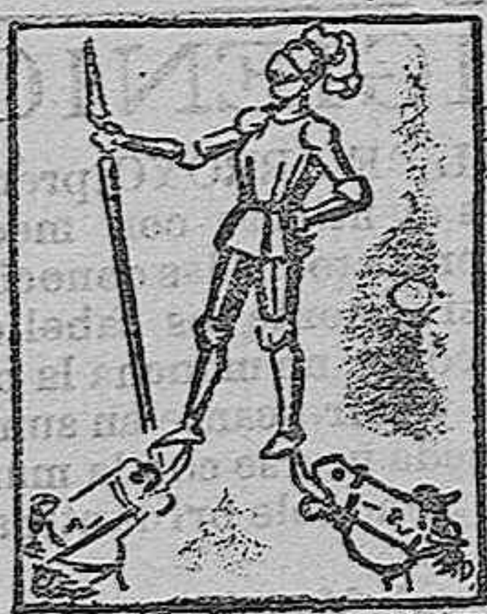
(La solución mañana.)

Solución al geroglífico último: A salto de mata. FRASE HECHA