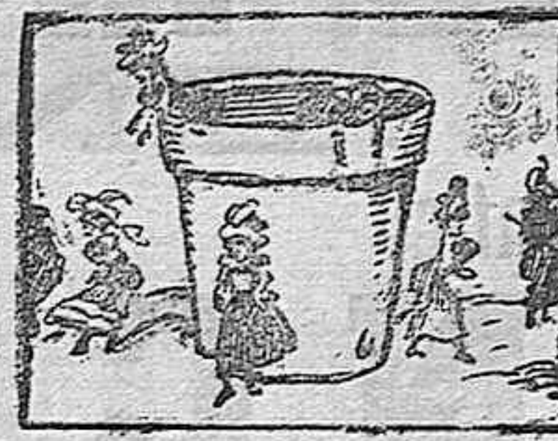
La solución mañana.