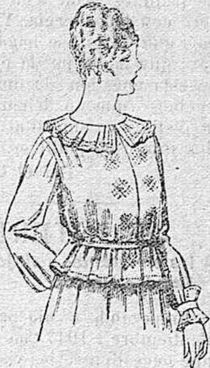
Blusa de crespón ó seda, en negro, azul y color. A ptas. 33.