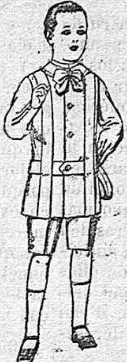
Trajes de lanilla, melton, etc. para niños de 4 á 7 años De ptas. 16 á 33.