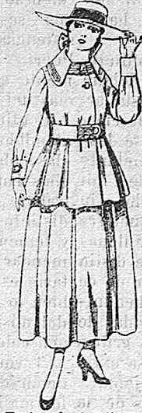
Trajes de lanilla negra, azul y color, para jovencitas de 13 á 16 años.