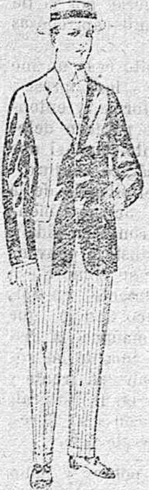
Trajes de lanilla, vicuña, etc., para jovencitos de 10 á 16 años. De pesetas 10 á 56