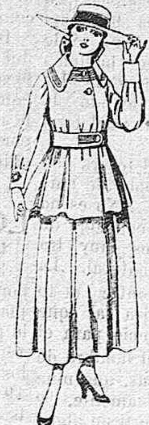
Trajes de lanilla negra, azul y color, para jovencitas de 13 á 16 años.