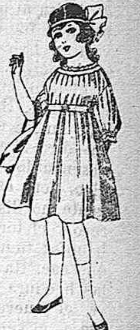
Vestidos de lana, azul, para niñas de 4 á 9 años De pesetas 22 á 25 Los mismos en voile. De pesetas 10 á 17