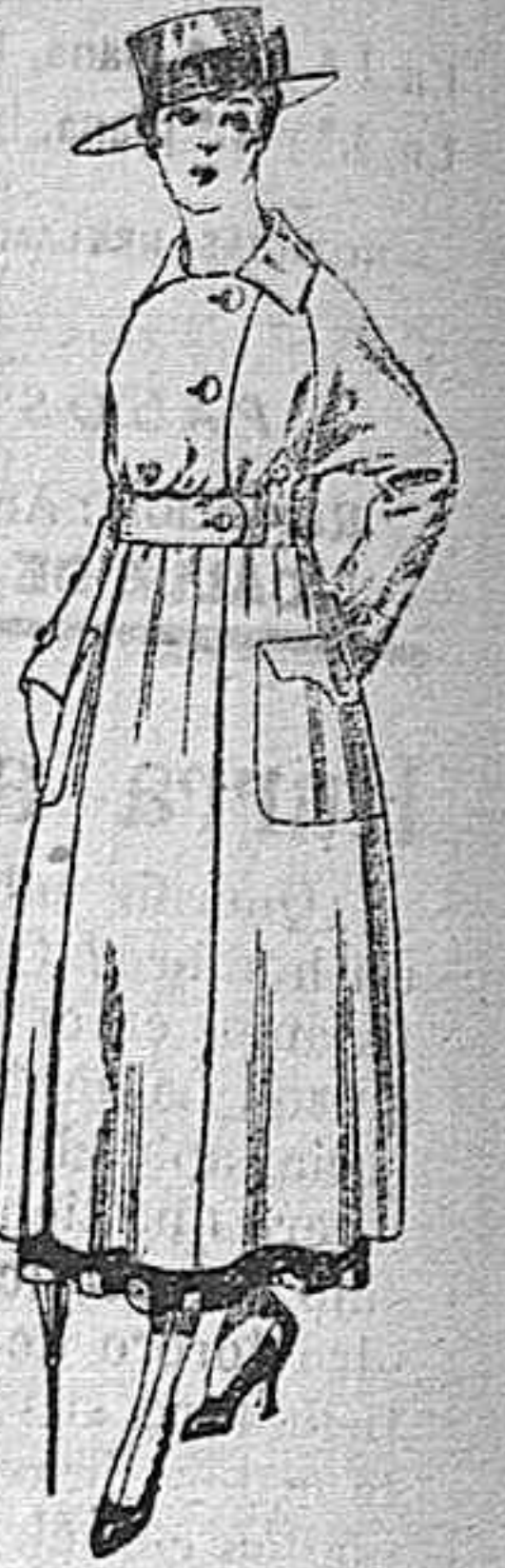
Vestido de estambre negro, azul y colores bordado De peseta 64 á 75