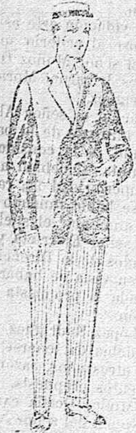
Trajes de lanilla, vicuña, etc., para jovencitos de 10 á 16 años. De pesetas 10 á 56