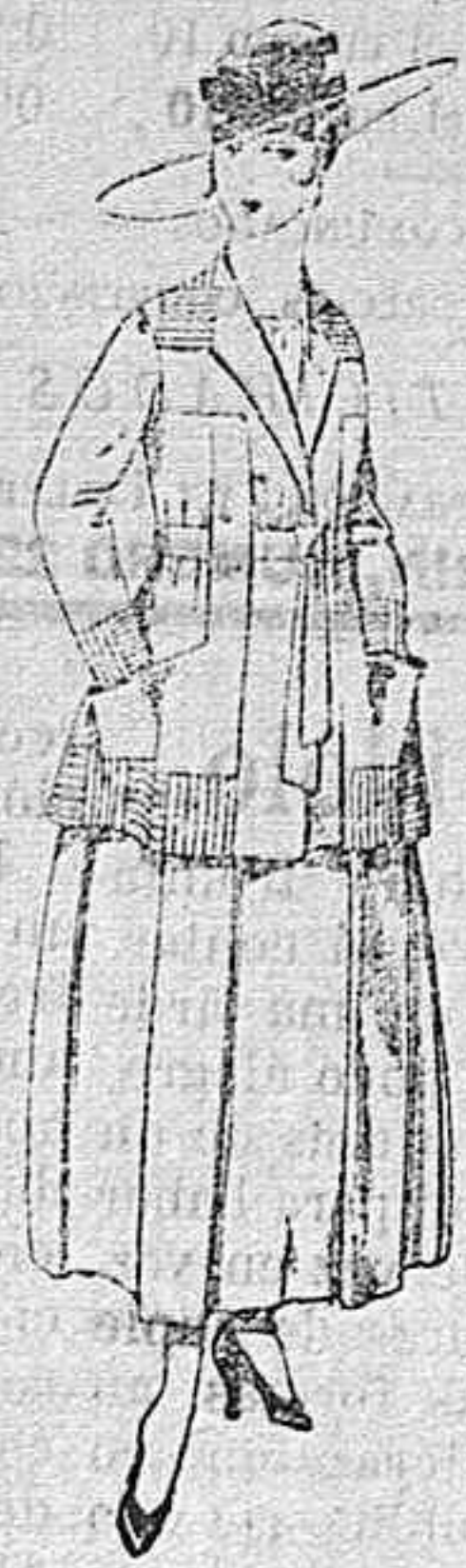
Trajes de lanilla negro, azul, y color, bordado, á pesetas 90.