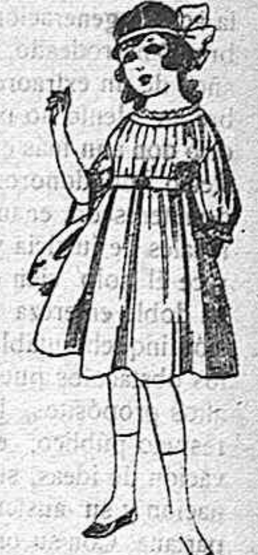
Vestidos de lana, azul, para niñas de 4 á 9 años. De pesetas 22 á 25. Los mismos en voile. De pesetas 10 á 17