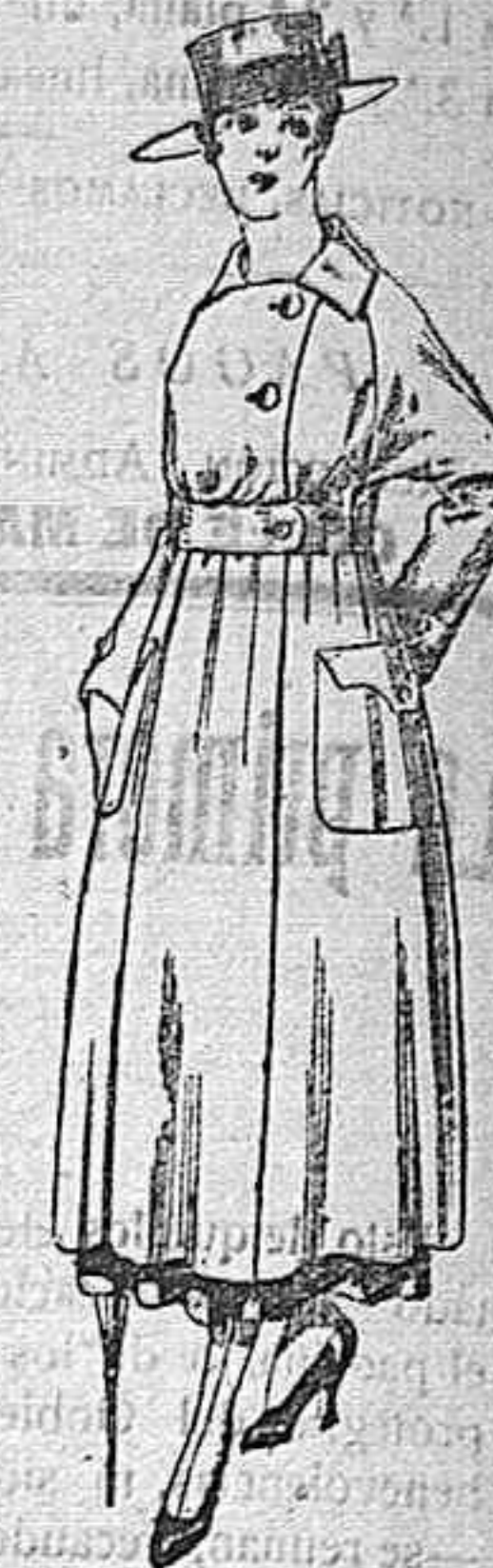
Vestido de estambre negro, azul y colores bordado. De peseta 64 á 75