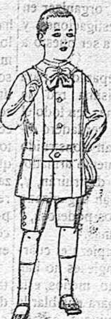
Trajes de lanilla, melton, etc. para niños de 4 á 7 años. De ptas. 16 á 33.