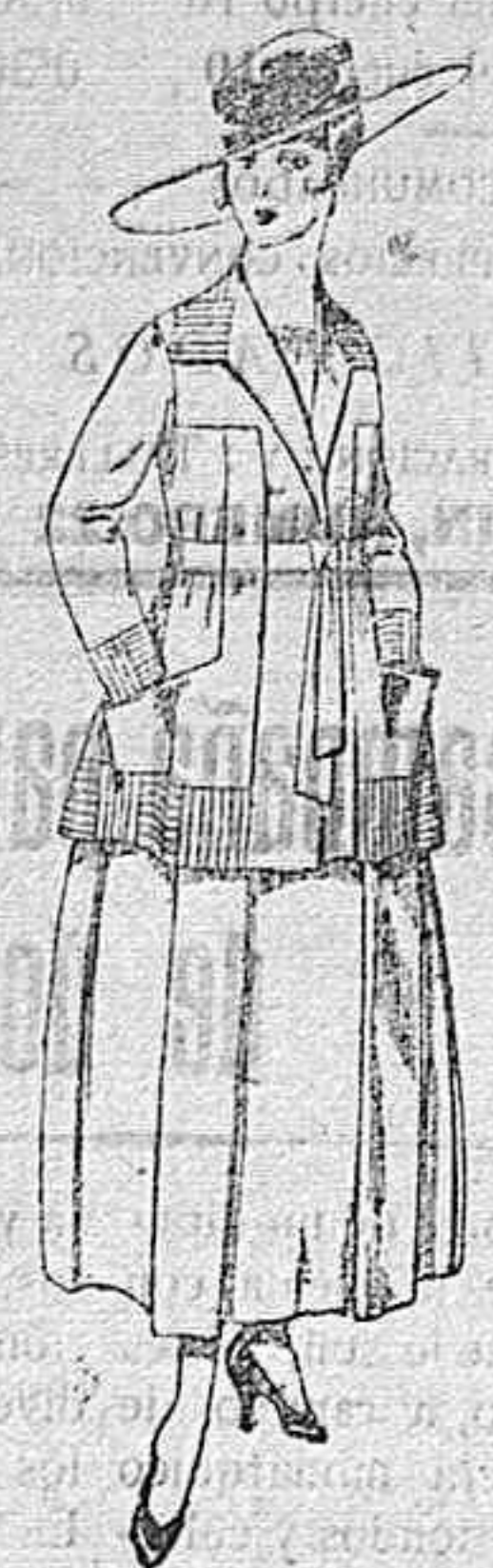
Trajes de lanilla negro, azul, y color, bordado á pesetas 90.