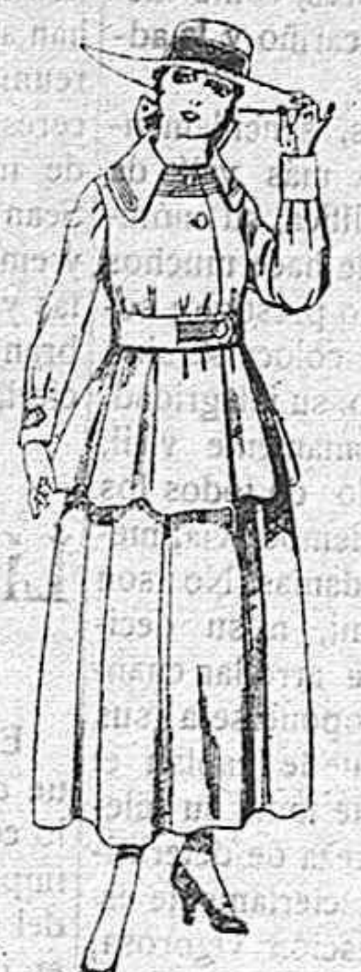
Trajes de lanilla negra, azul y color, para jovencitas de 13 á 16 años.