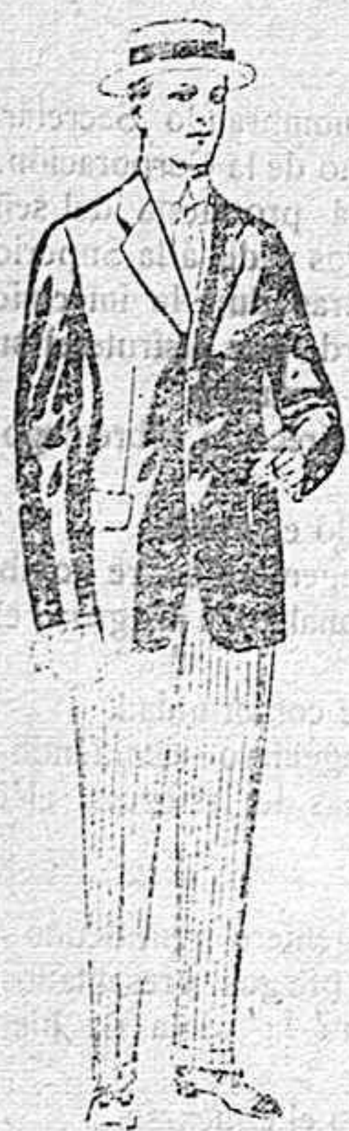
Trajes de lanilla, vicuña, etc., para jovencitos de 10 á 16 años. De pesetas 10 á 56