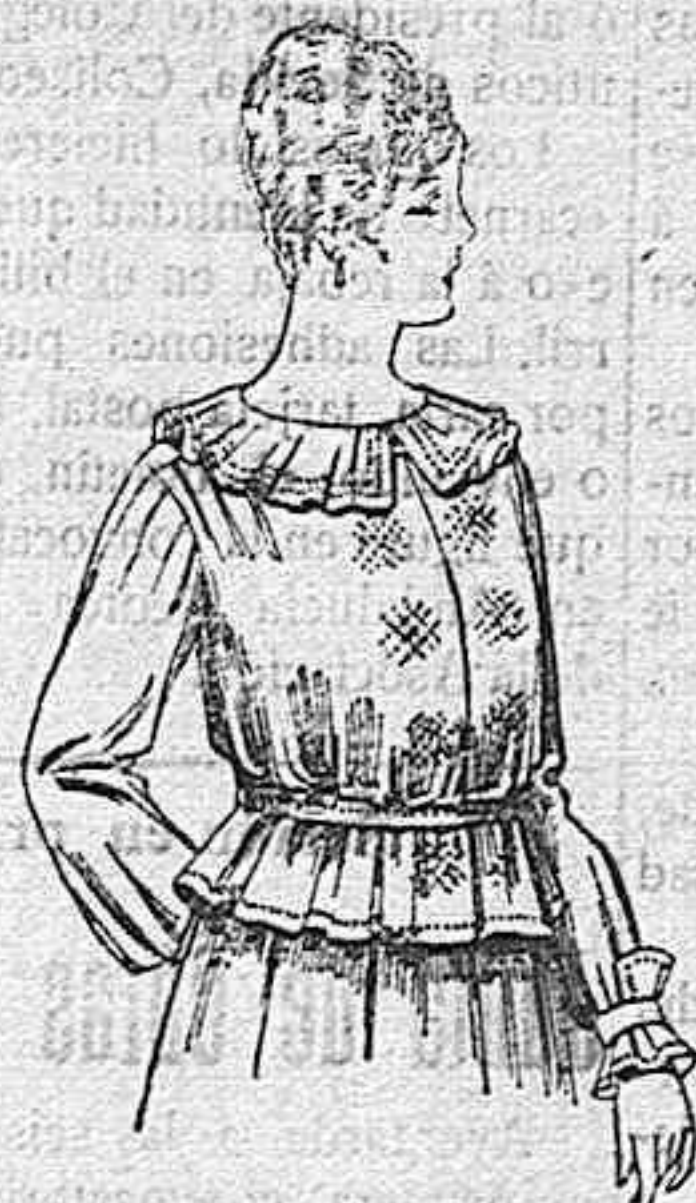
Blusa de crespón ó seda, en negro, azul y color. A ptas. 33.