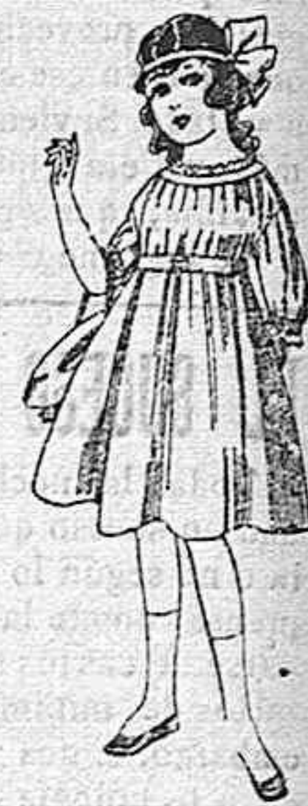
Vestidos de lana, azul, para niñas de 4 á 9 años. De pesetas 22 á 25 Los mismos en voile. De pesetas 10 á 17