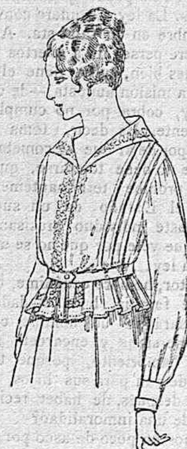
Blusa de voile blanco, bordados blancos, rosa ó azul A ptas. 9