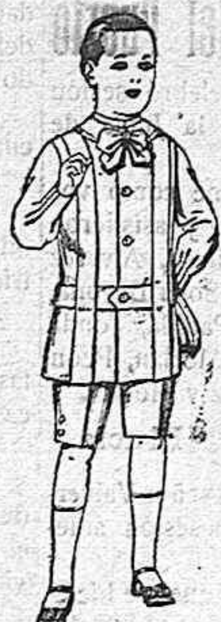
Trajes de lanilla, melton, etc. para niños de 4 á 12 años. De ptas. 16 á 33.