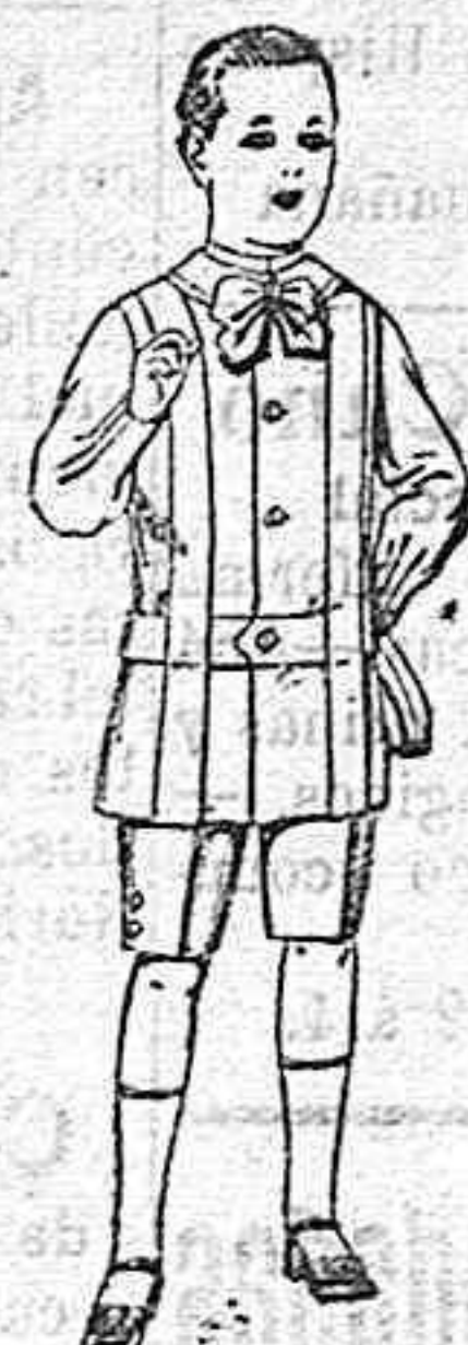
Trajes de lanilla, melton, etc. para niños de 4 á 7 años De ptas. 16 á 33.