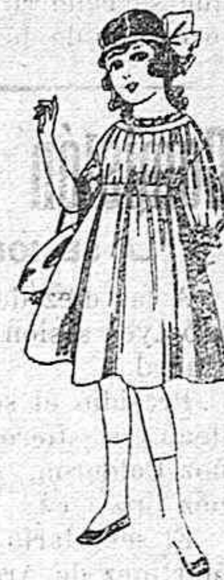
Vestidos de lana, azul, para niñas de 4 á 9 años De pesetas 22 á 25 Los mismos en voile. De pesetas 10 á 17