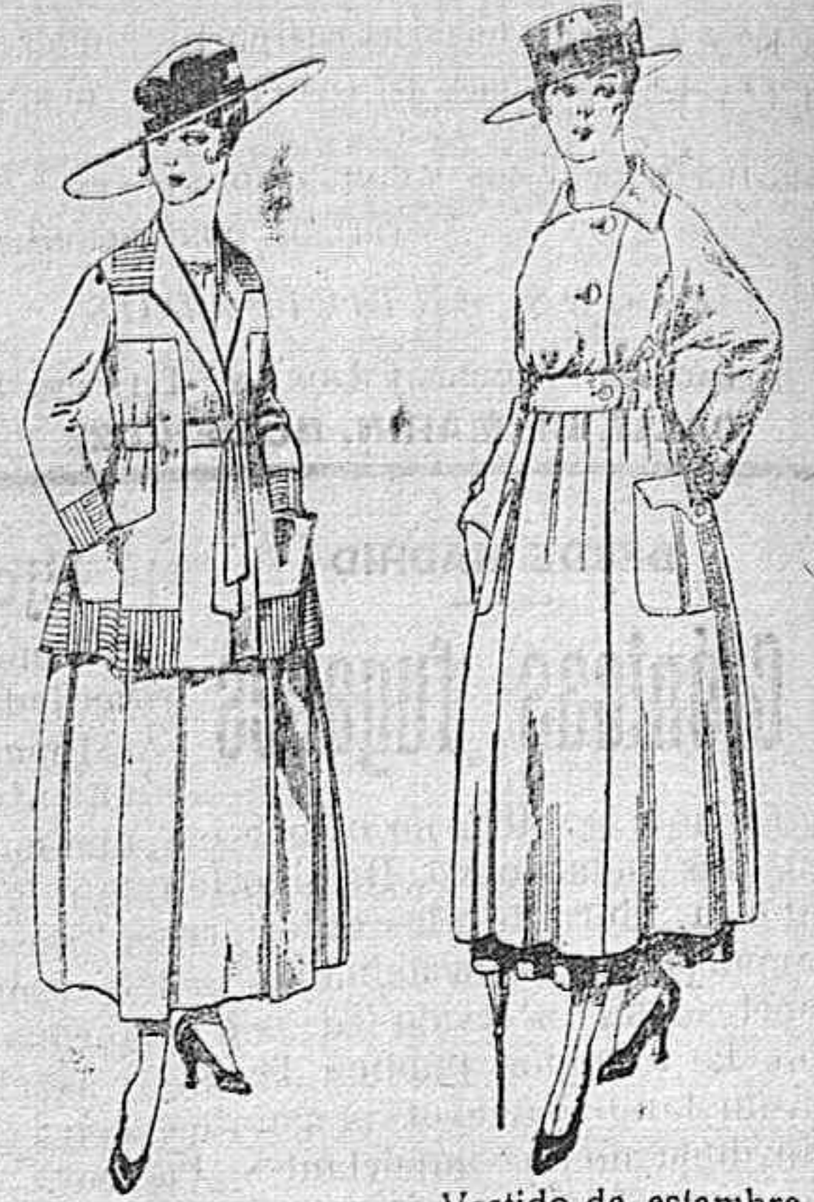
Trajes de lanilla negro, azul, y color, bordado, á pesetas 90. Vestido de estambre negro, azul y colores bordado De peseta 64 á 75