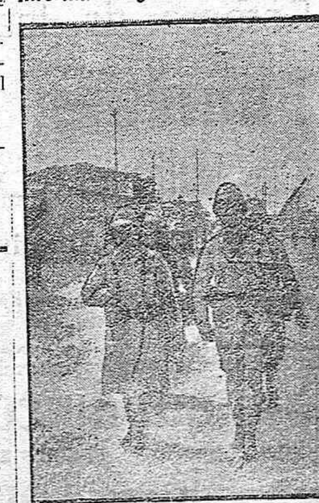
En Grecia.— Una patrulla en los muelles del Pireo.