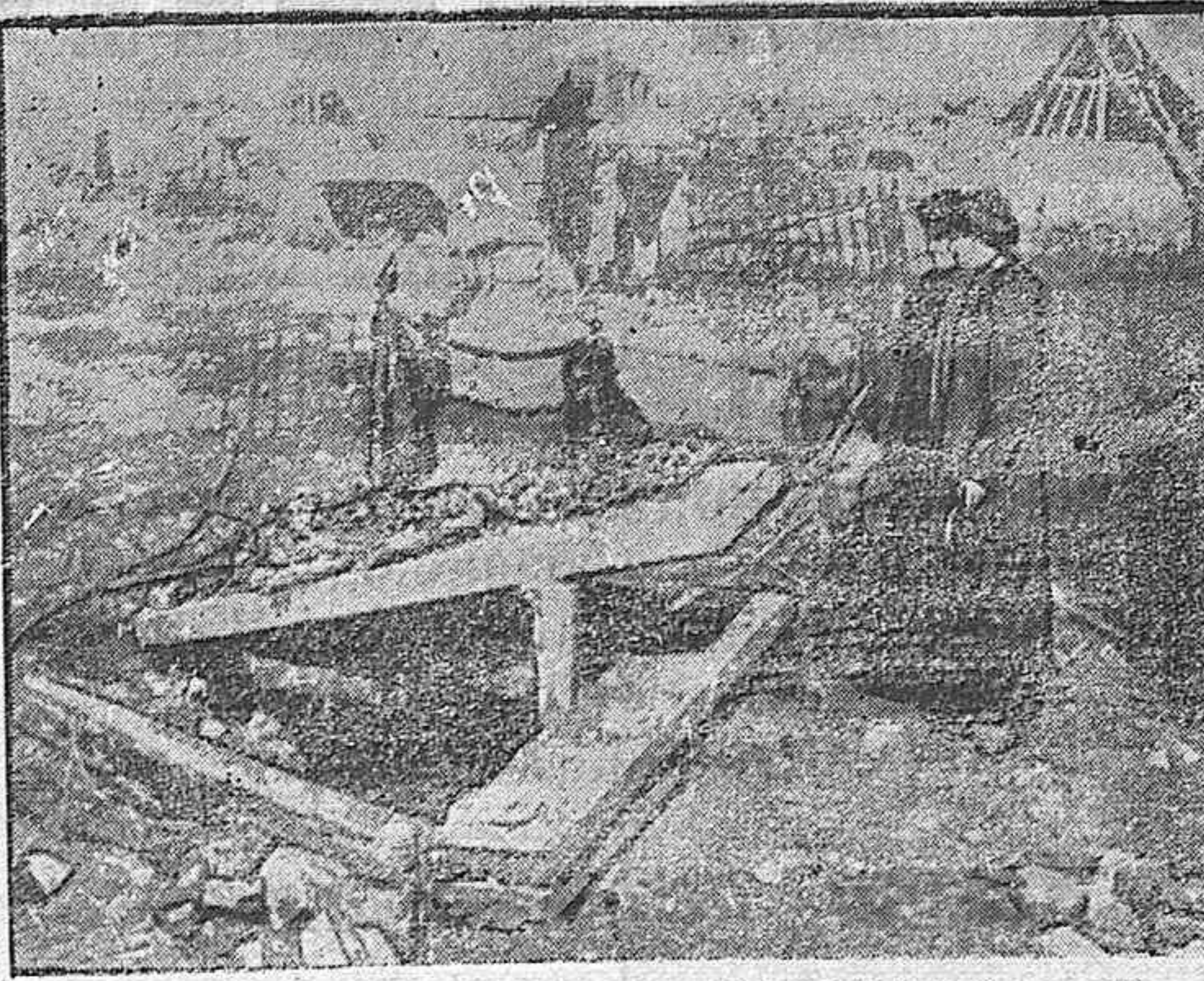
Cementerio profanado.