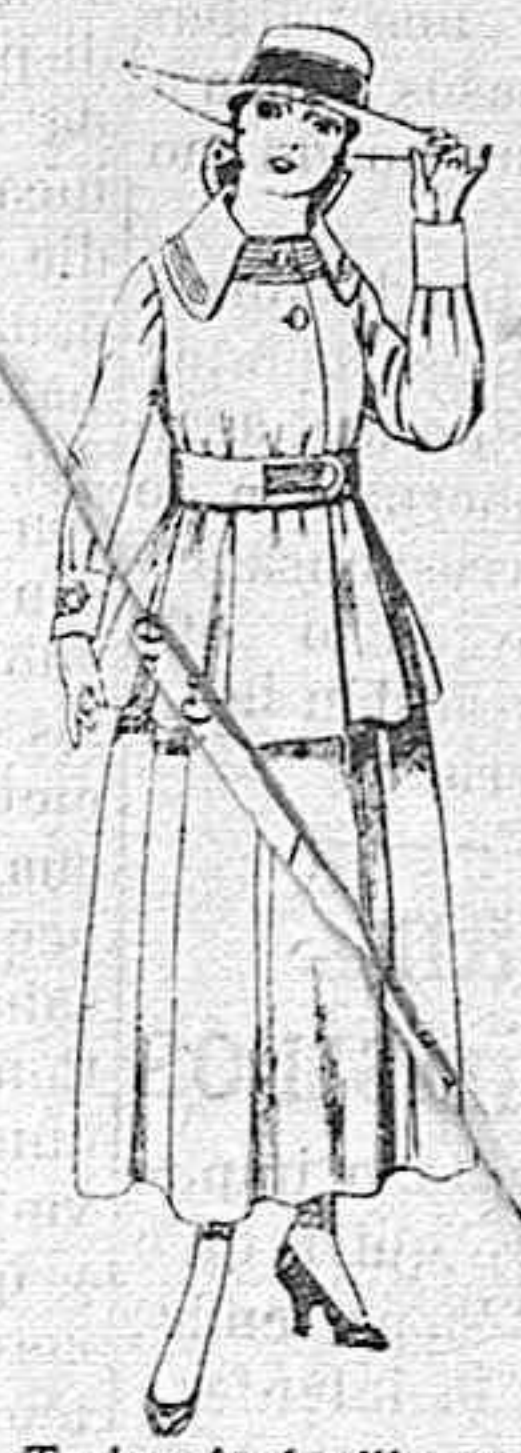
Trajes de lanilla negra, azul y color, para jovencitas de 13 á 16 años.