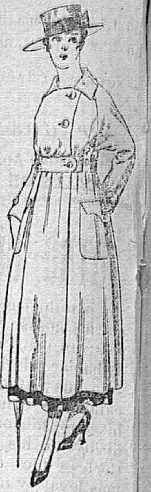
Vestido de estambre negro, azul y colores bordado De peseta 64 á 75