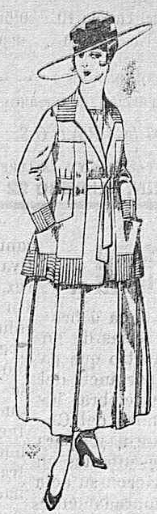
Trajes de lanilla negro, azul, y color, bordado, á pesetas 90.