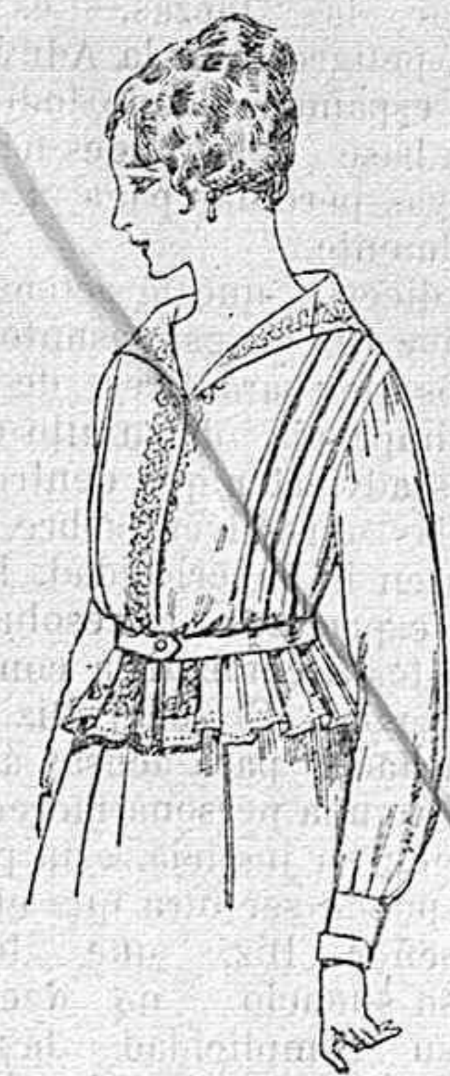
Blusa de voile blanco, bordados blancos, rosa ó azul A ptas. 9