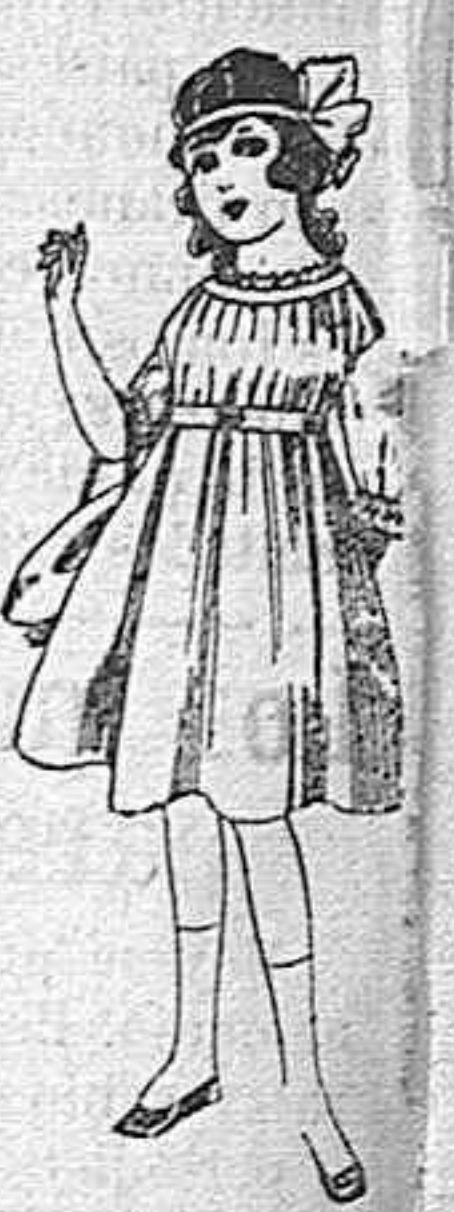
Vestidos de lana azul, para niñas de 4 á 9 años De pesetas 22 á 25 Los mismos en voile. De pesetas 10 á 17