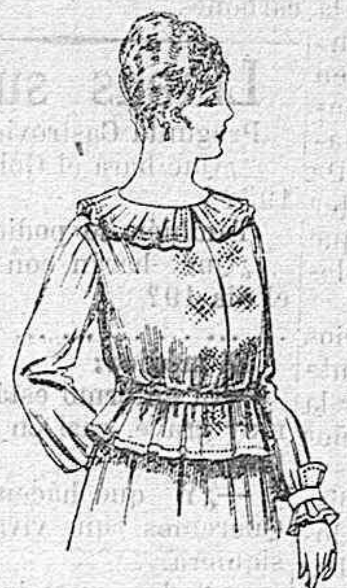
Blusa de crespón ó seda, en negro, azul y color. A ptas. 33.