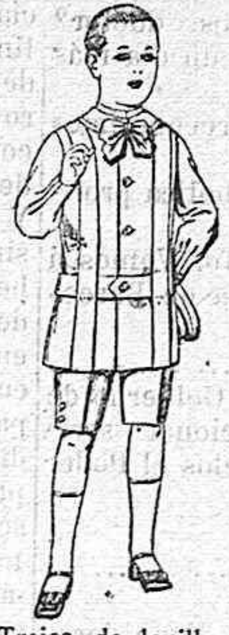
Trajes de lanilla, melton, etc. para niños de 4 á 7 años De ptas. 16 á 33.