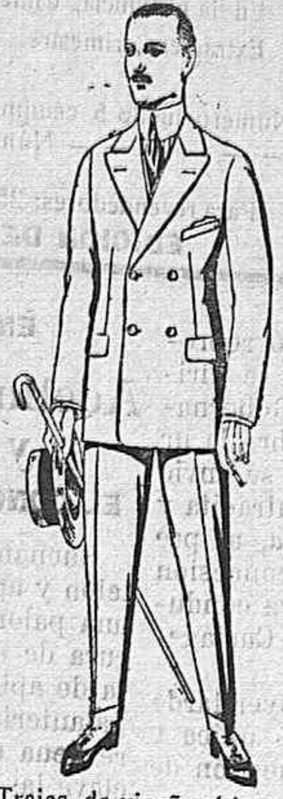
Trajes de vicuña ó jerga negros ó azules, de pesetas 38 á 80. Los mismos de melton ó estambre novedad, de pesetas 33 á 90.