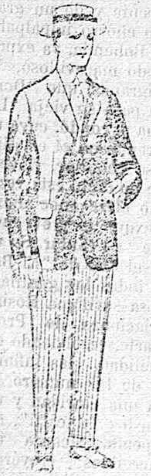
Trajes de lanilla, vicuña, etc., para jovencitos de 10 á 16 años. De pesetas 10 á 56