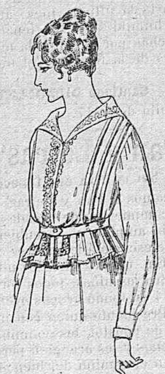
Blusa de voile blanco, bordados blancos, rosa ó azul A ptas. 9