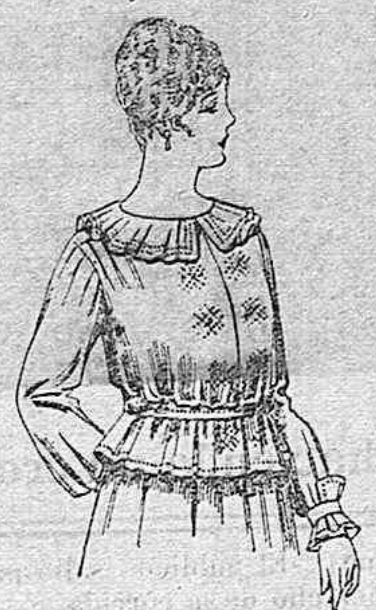
Blusa de crespón ó seda, en negro, azul y color. A ptas. 33.