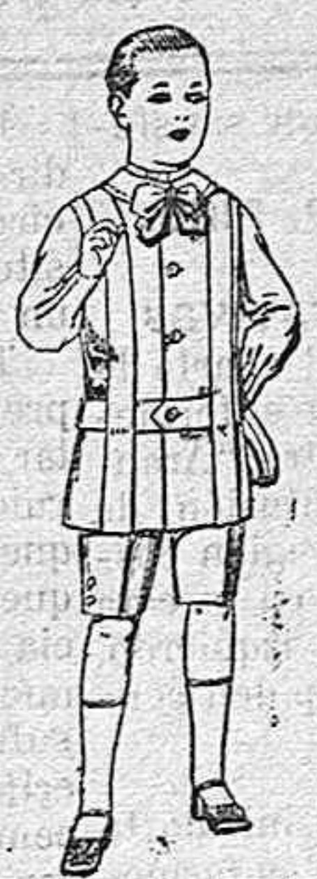
Trajes de lanilla, melton, etc. para niños d 4 á 7 años De ptas. 16 á 33.