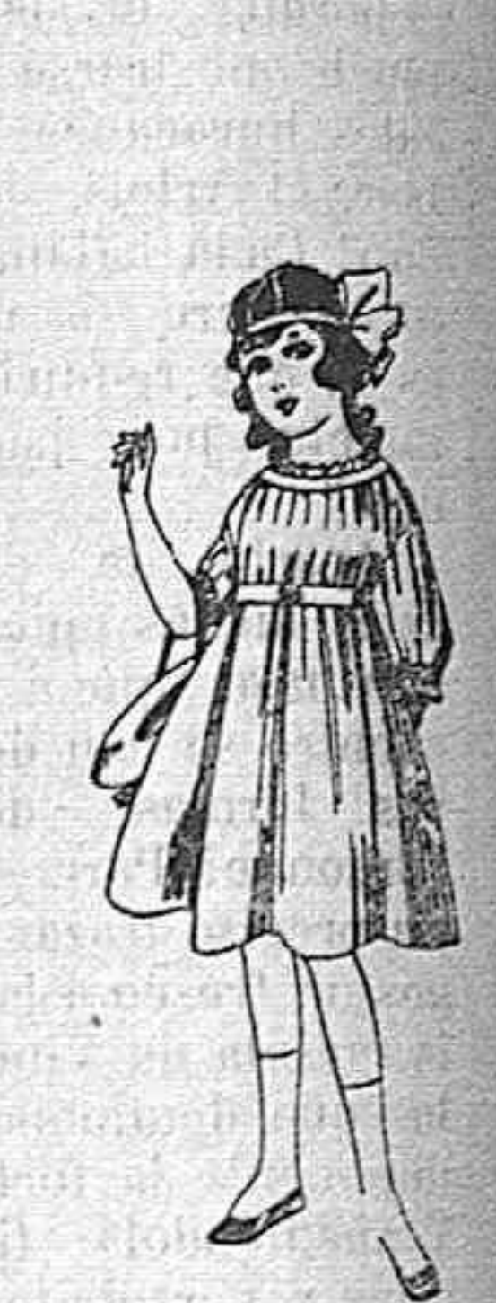
Vestidos de lana, azul, para niñas de 4 á 9 años De pesetas 22 á 25 Los mismos en voile. De pesetas 10 á 17