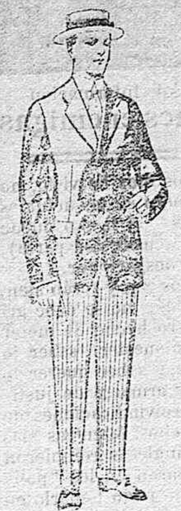
Trajes de lanilla, vicuña, etc., para jovencitos de 10 á 16 años. De pesetas 10 á 56