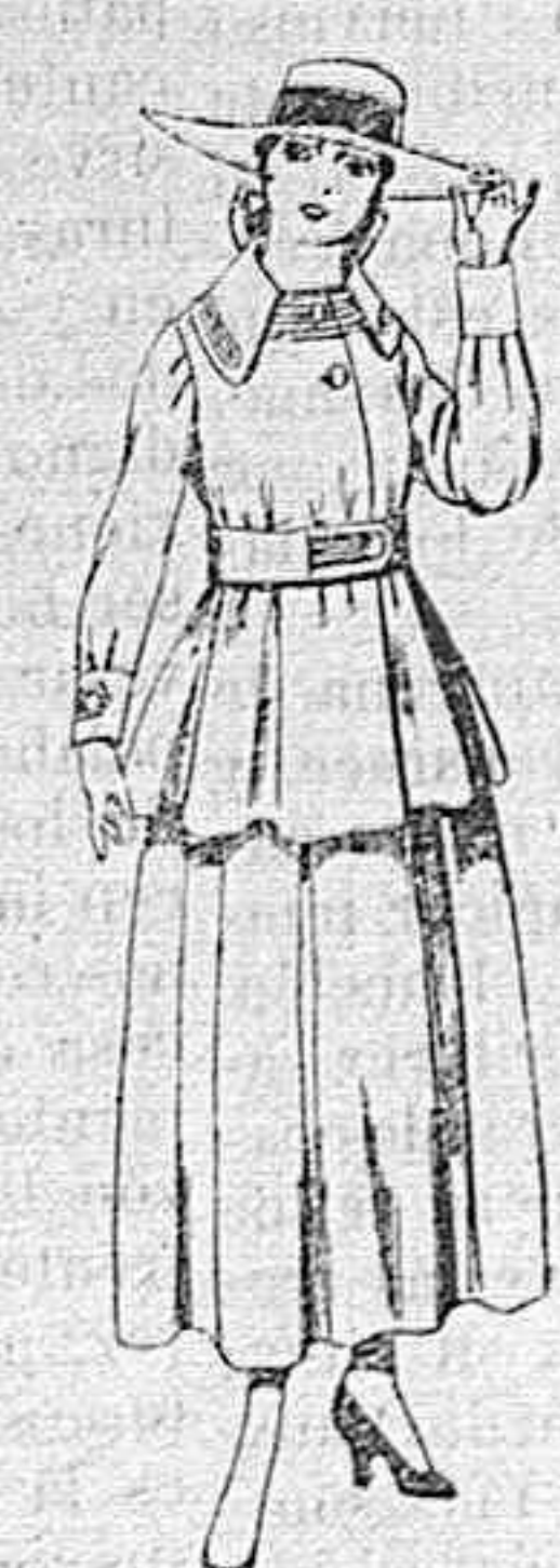
Trajes de lanilla negra, azul y color, para jovencitas de 13 á 16 años.