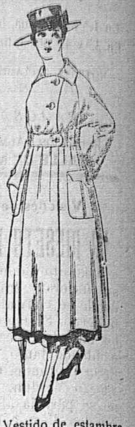
Vestido de estambre negro, azul y colores bordado De peseta 64 á 75