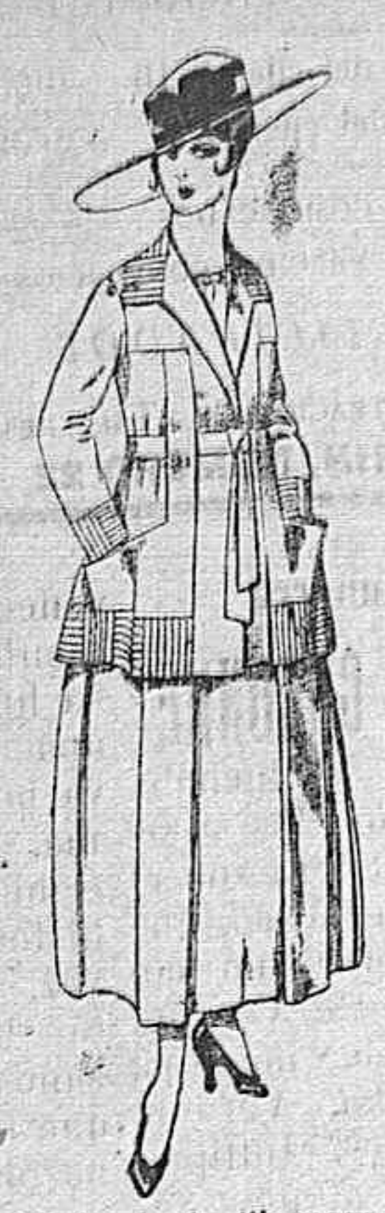
Trajes de lanilla negro, azul, y color, bordado, á pesetas 90.