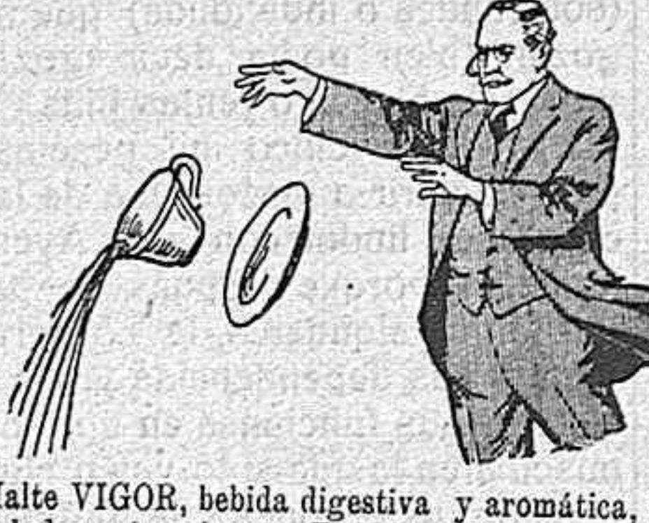
Malte VIGOR, bebida digestiva y aromática, de exquisito sabor y aroma que satisface al paladar más exigente. El Malte VIGOR constituye un excelente desayuno y es el único sustituto del café. Pida usted siempre el verdadero y legítimo Malte VIGOR del Dr. Falp.

Cuando hayais probado todos los medicamentos contra la bronquitis, Tos ferina y toses rebeldes de los catarros agudos y crónicos, sin obtener alivio, acudid al Ferinol. De venta en todas las farmacias y droguerías.