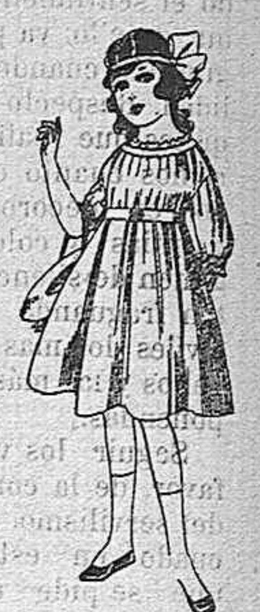
Vestidos de lana, azul, para niñas de 4 á 9 años. De pesetas 22 á 25. Los mismos en voile. De pesetas 10 á 17