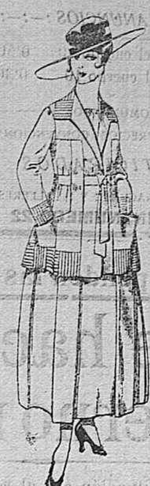
Trajes de lanilla negro, azul, y color, bordado, á pesetas 90.