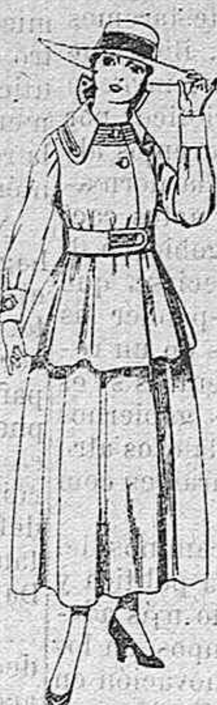
Trajes de lanilla negra, azul y color, para jovencitas de 13 á 16 años.