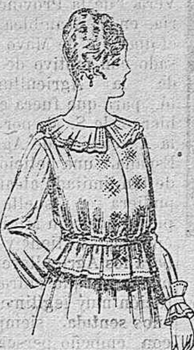
Blusa de crepón ó seda, en negro, azul y color. A ptas. 33.