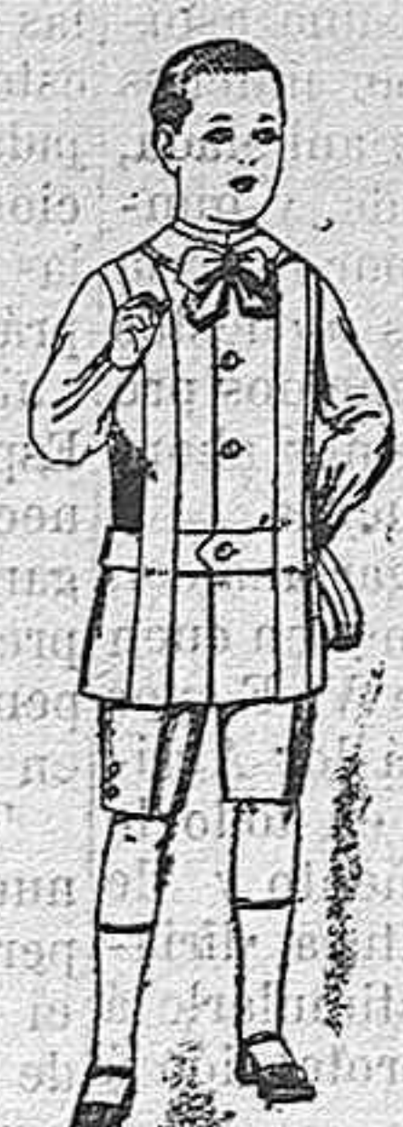
Trajes de lanilla, melton, etc. para niños de 4 á 7 años. De ptas. 16 á 33.