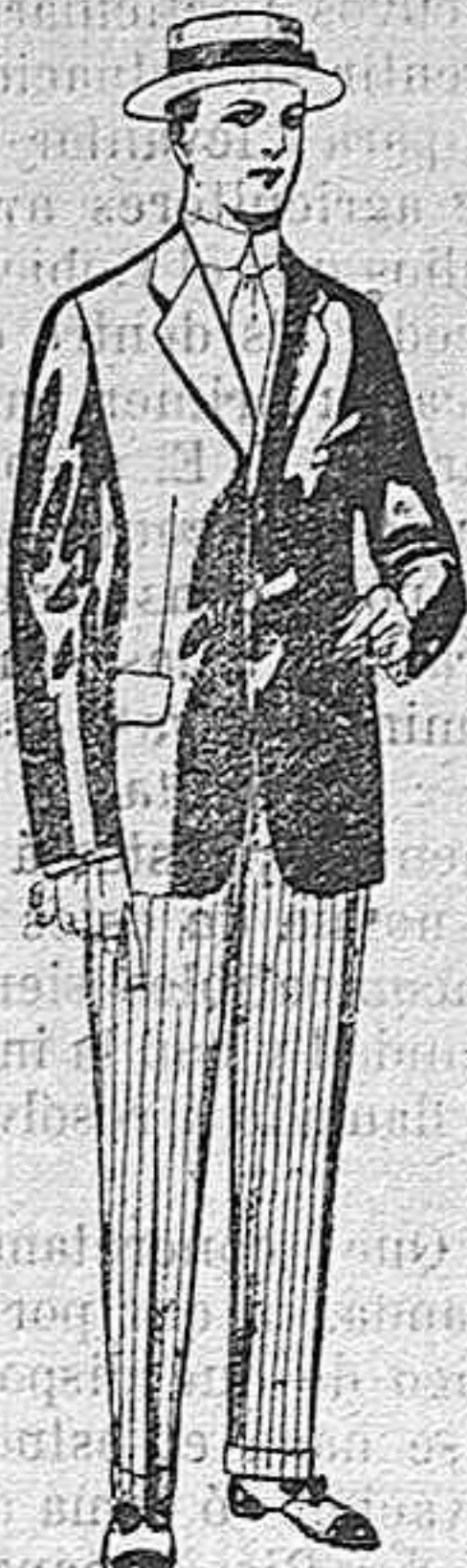
Trajes de lanilla, vicuña, etc., para jovencitos de 10 á 16 años. De pesetas 10 á 56