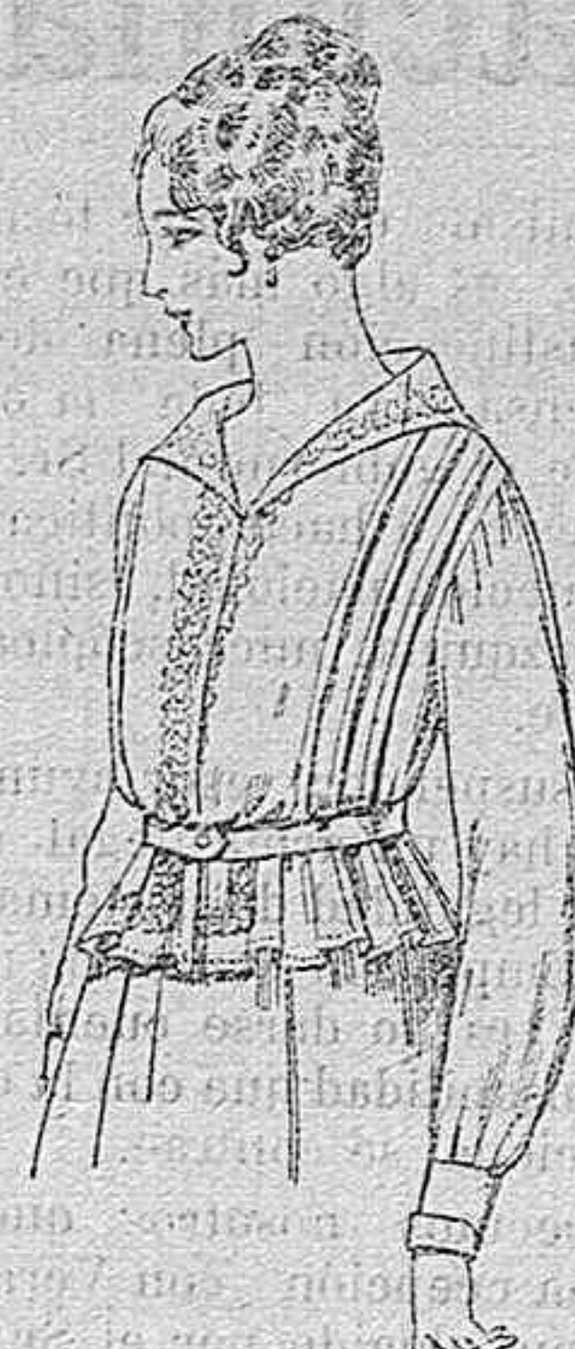
Blusa de voile blanco, bordados blancos, rosa ó azul. A ptas. 9