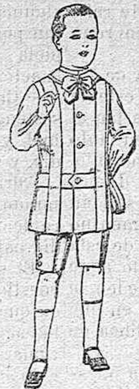
Trajes de lanilla, melton, etc. para niños de 4 á 7 años. De ptas. 16 á 33.