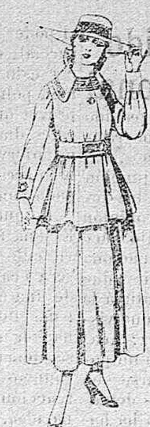
Trajes de lanilla negra, azul y color, para jovencitas de 13 á 16 años.