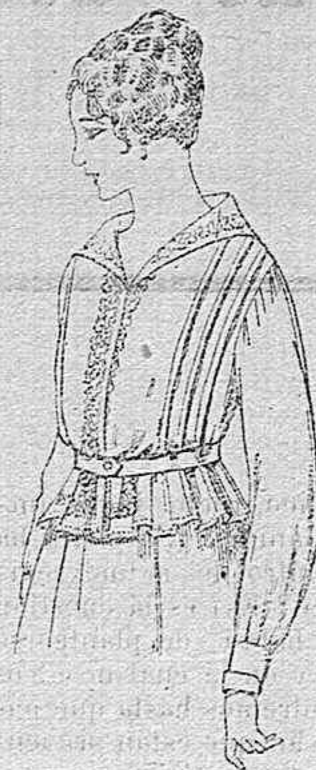
Blusa de voile blanco, bordados blancos, rosa ó azul. A ptas. 9