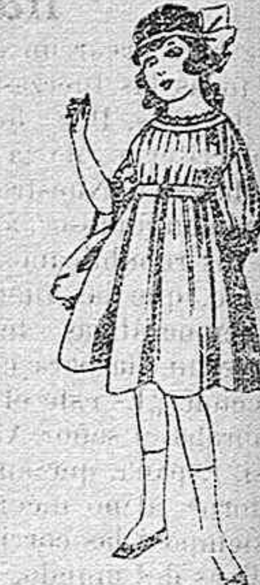
Vestidos de lanilla azul, para niñas de 4 á 9 años. De pesetas 22 á 25. Los mismos en voile. De pesetas 10 á 17