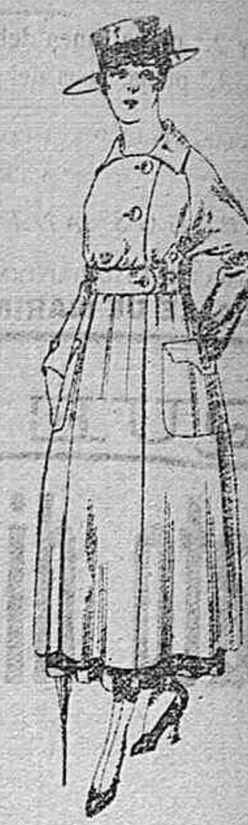
Vestido de estambre negro, azul y color, bordado. De pesetas 64 á 75