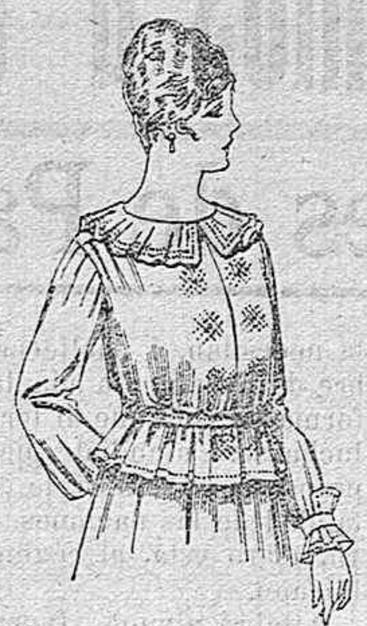
Blusa de crespón ó seda, en negro, azul y color. A ptas. 33.