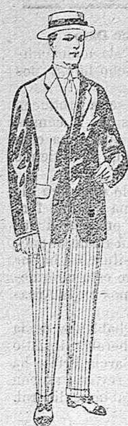
Trajes de lanilla, vicuña, etc., para jovencitos de 10 á 16 años. De pesetas 10 á 56