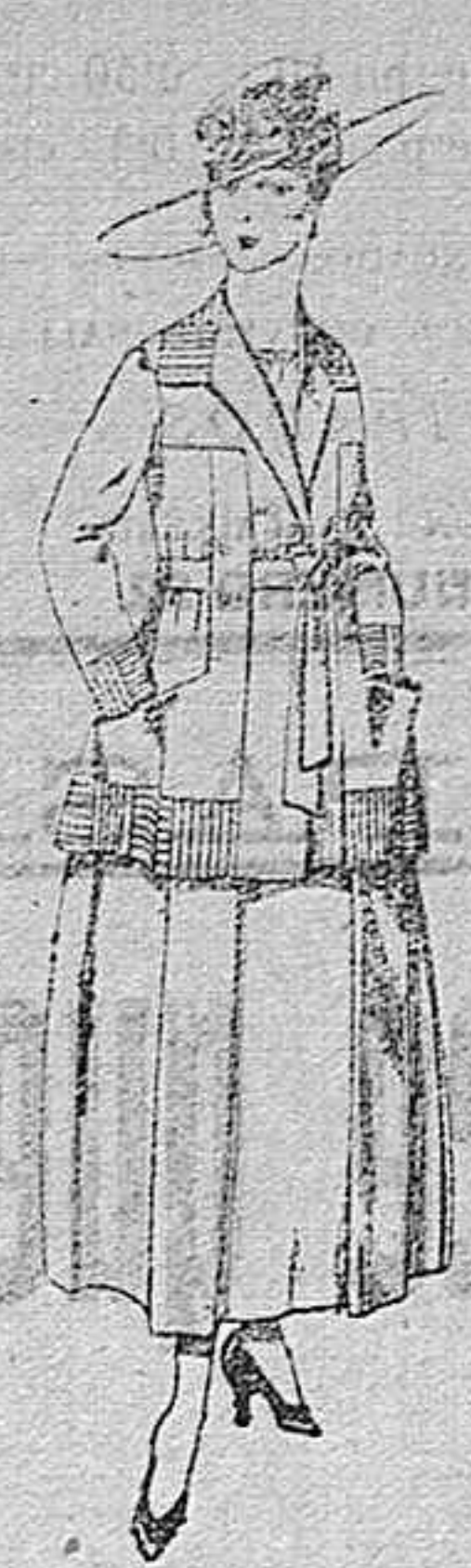
Trajes de lanilla negro, azul, y color, bordado, á pesetas 90.