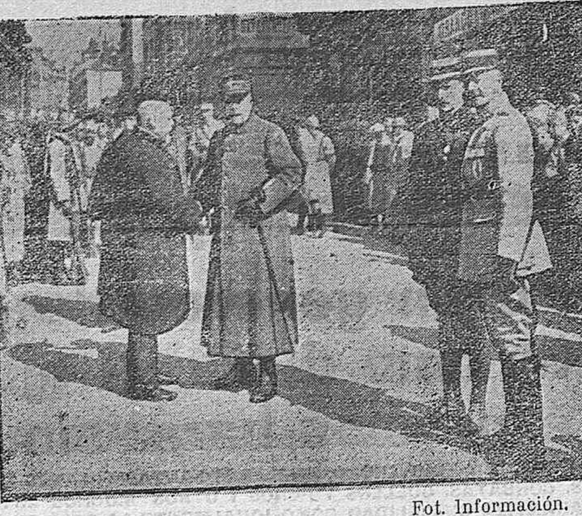
El alto mando francés en Noyon.