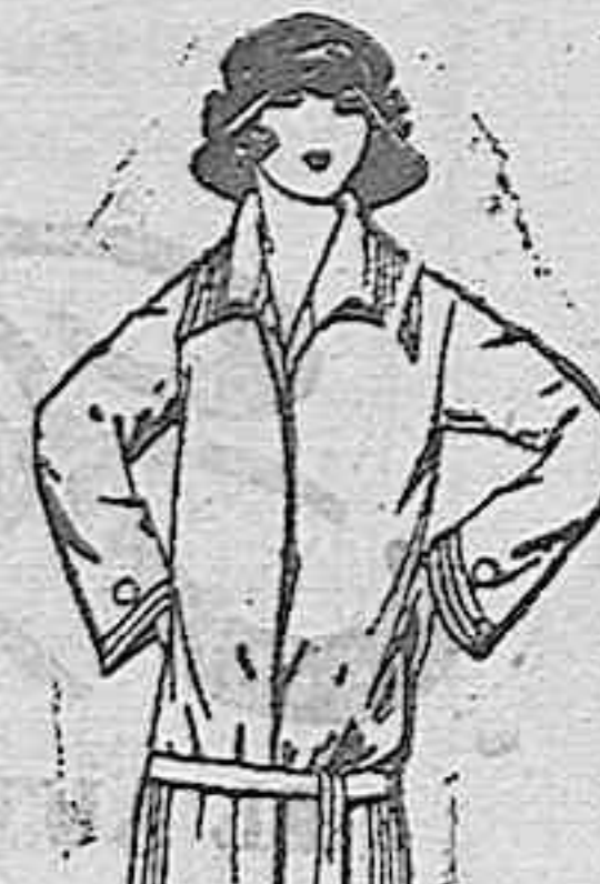
Abrigos de terciopelo de lana y gamuza colores gran fantasía, para jovencitas de 12 a 15 años. De ptas. 45 a 70