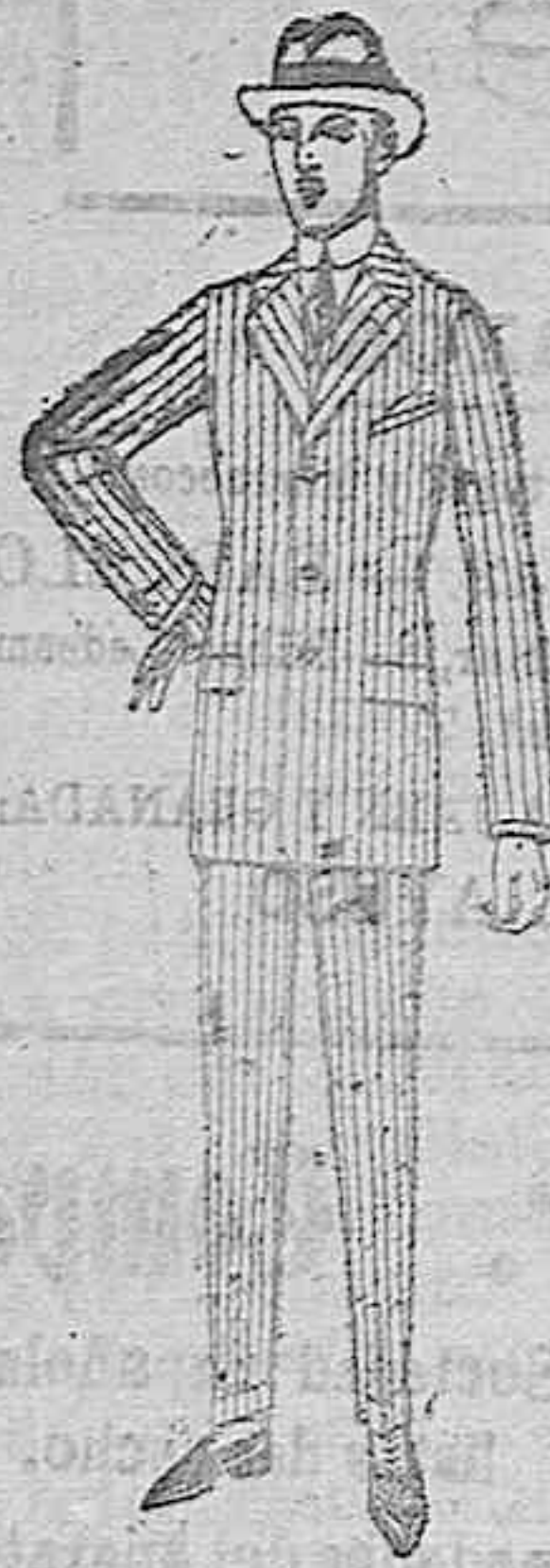
Trajes de cheviot, patúa, estambre, etc. De ptas. 33 a 135

SUCURSALES: Madrid, Barcelona, Alicante, Bilbao, Cádiz, Cartagena, Gijón, Granada, Málaga, Palma de Mallorca, Santander, Sevilla, Valencia, Valladolid, Zaragoza.