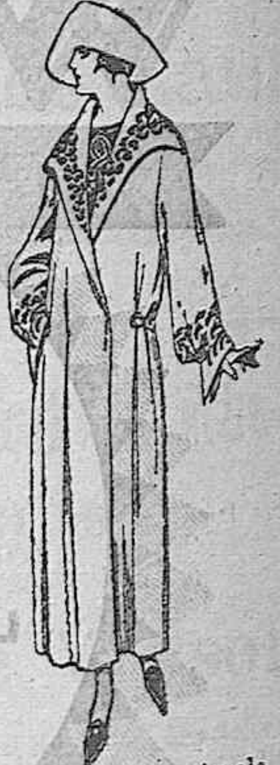
Abrigos de terciopelo de lana, gamuza, pañeta, en azul, negro y color, adornos bordados. De 80 a 95