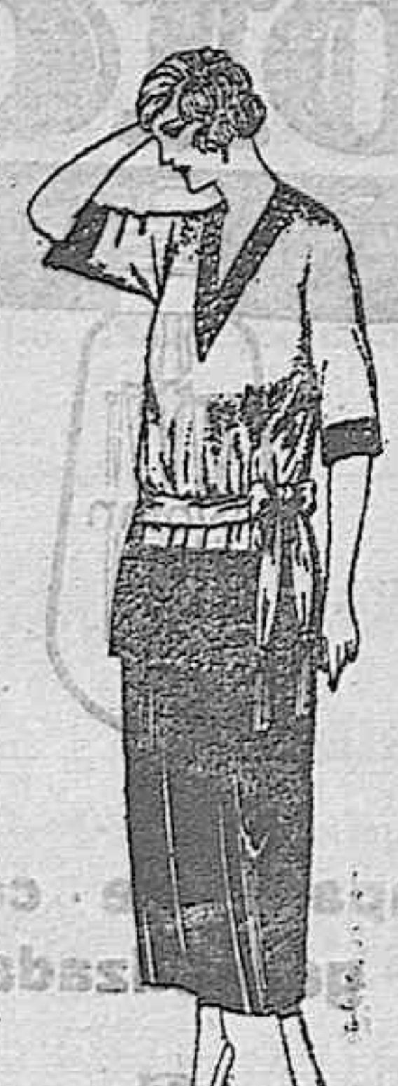
De ptas. 56 a 130