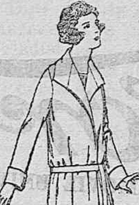
Trajes de estambre, lana, etc. en azul y color, para jovencitas de 12 a 15 años. De ptas. 58 a 100