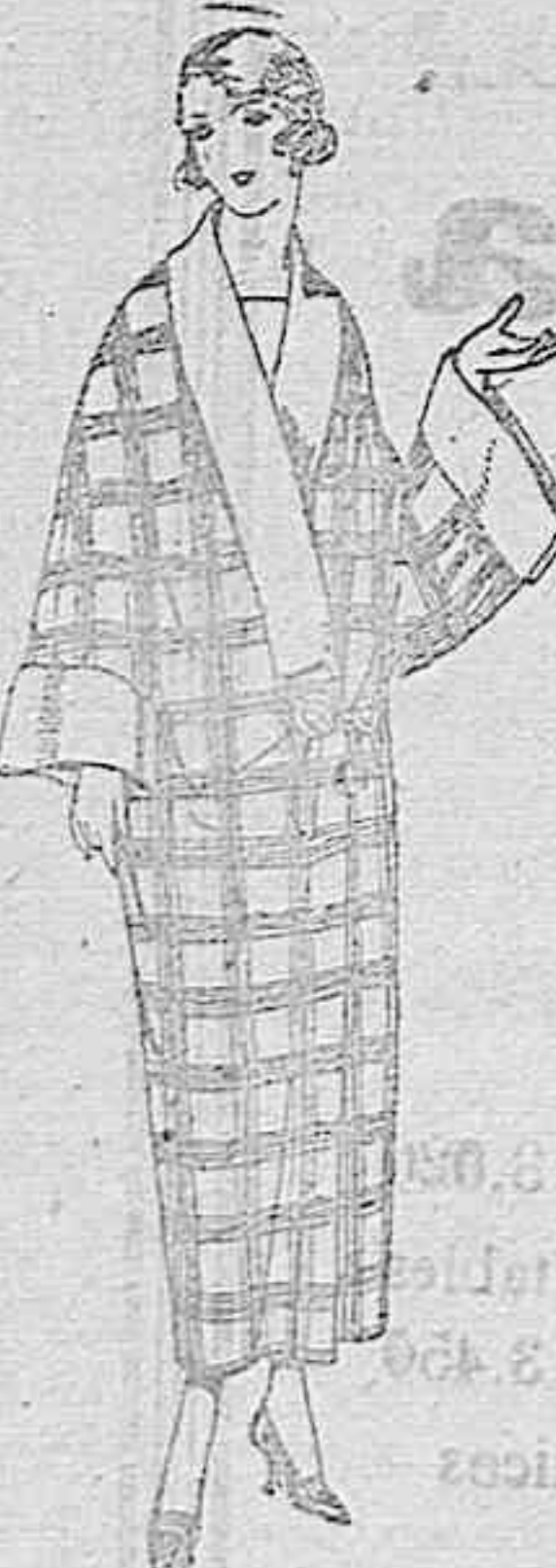
Batas de franela dibujos novedad. De ptas. 27 a 28