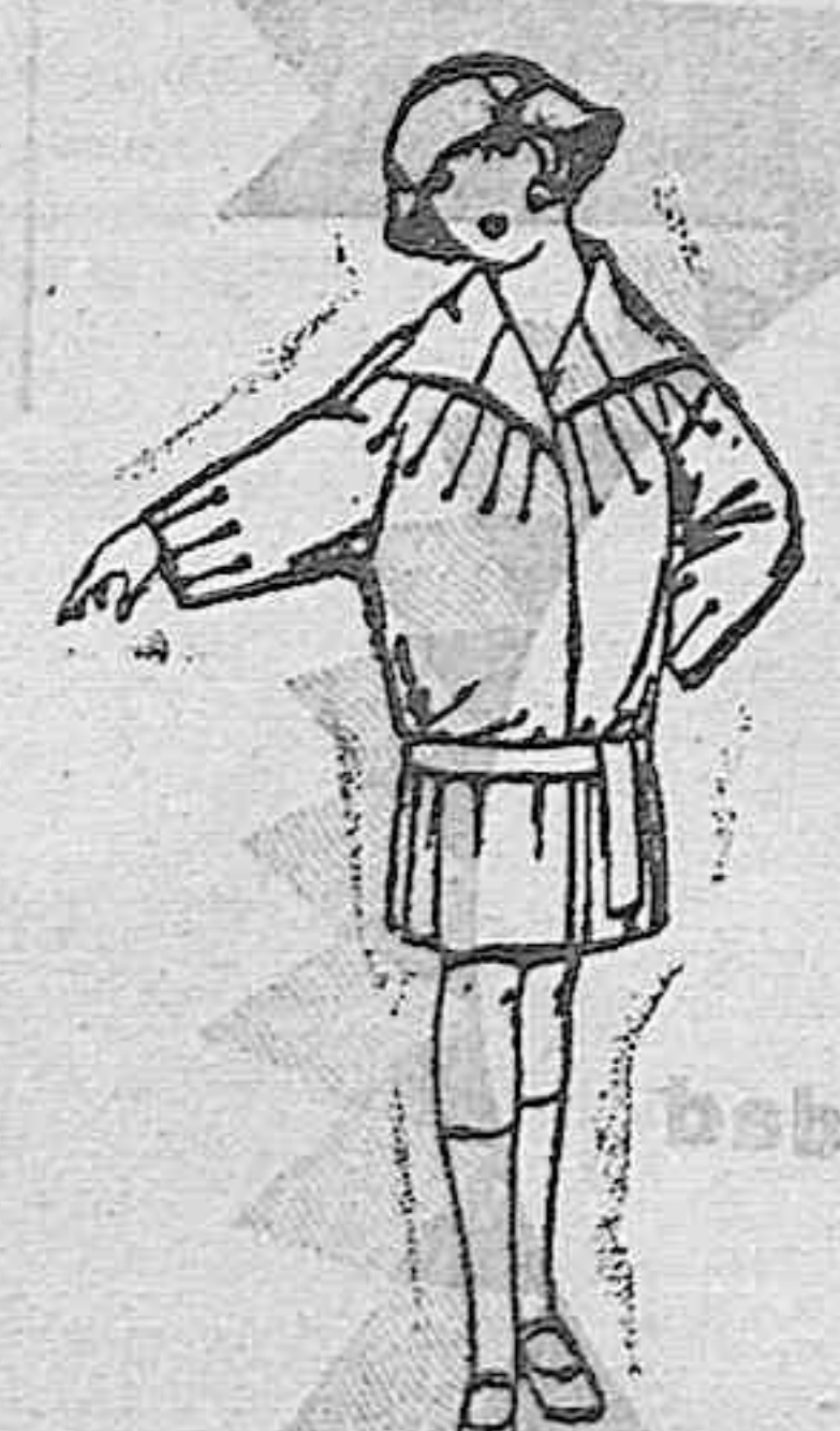
Abrigos de terciopelo de lana, en azul y color, adornos respuntes, Paletots de punto de seda, para niñas de 4 a 9 años. De ptas. 25 a 40