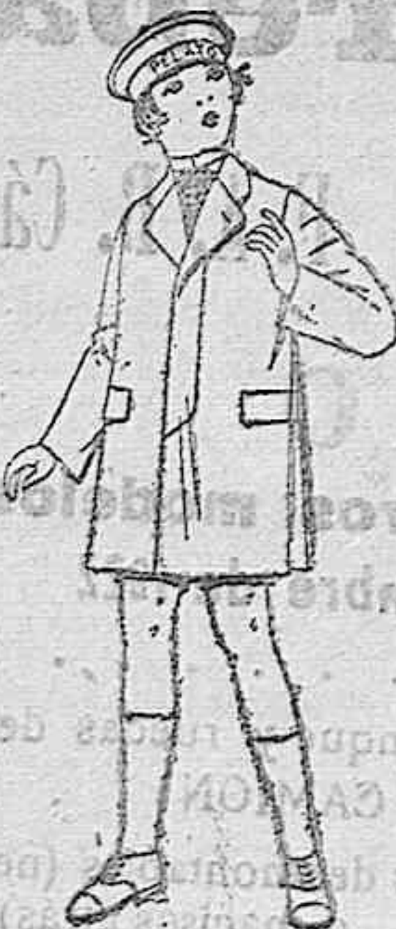
Gabanes de patén, gamuza, para niños de 4 a 9 años. De ptas. 20 a 50

Ropas confeccionadas para Caballero, Señora, Niño y Niña