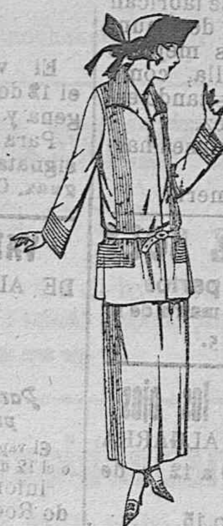
Trajes suaves, de popeline, estambre, en marino, negro y colores moda. De ptas. 125 a 160