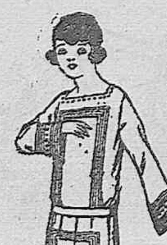
Vestidos de sarga inglesa, gabardina, en azul y color, para jovencitas de 12 a 15 años. De ptas. 60 a 80