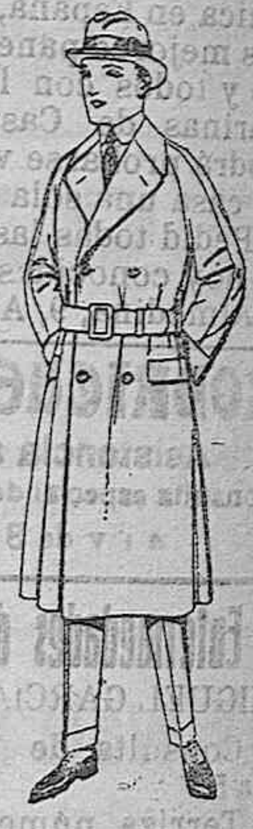
Gabanes cruzados de cheviot, cover o pluma. De ptas. 195 a 18