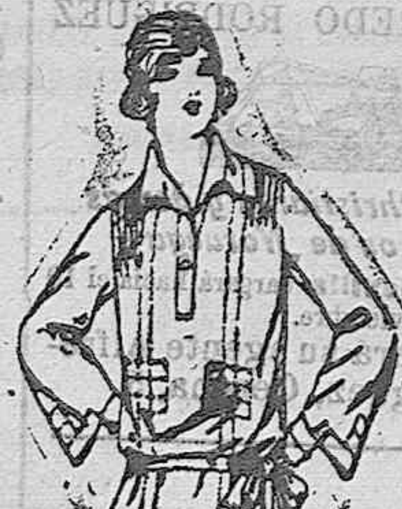
Blusas de crepón de seda, en negro, azul y color, adornos bordados. De ptas. 30 a 65