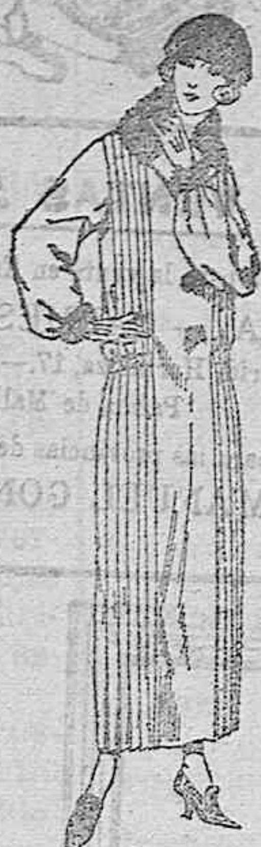
Vestidos de sarga, crepé, etc. en negro, azul y color De ptas. 195 a 160