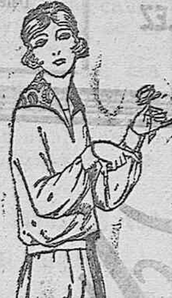
Blusas de punto de seda diferentes colores, adornos bordados. De ptas. 55 a 75