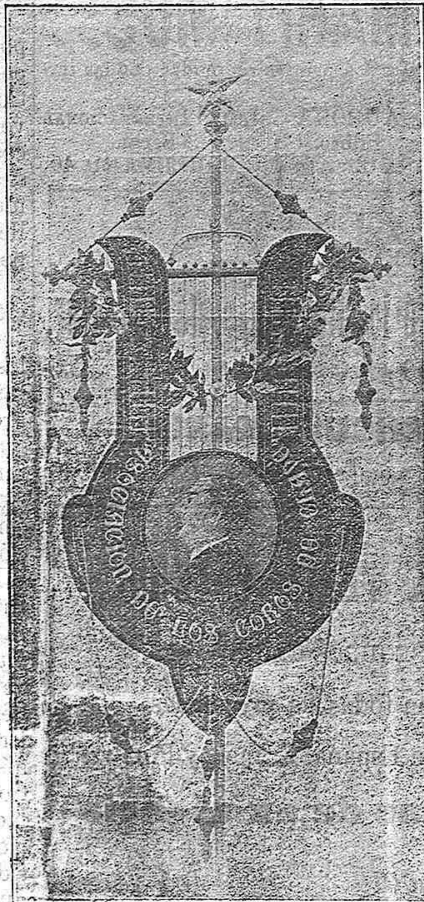
Estandarte de la Asociación.

Quando los expedicionarios que ascienden á 350, pusieron pié á tierra, aumentó el entusiasmo, dándose muestras de afecto por parte de la numerosa concurrencia que los esperaba.