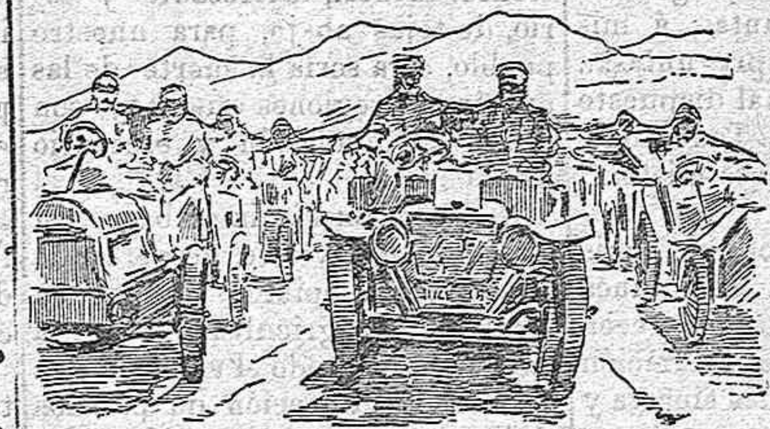
MITIN AUTOMOVILISTA DEL GUADARRAMA.—En el Alto del León.

El lugar escogido para esta curiosa y arriesgada experiencia no puede ser más apropiado para ella, por constituir, dada la inclinación de planos por los que puede correr un automóvil, una de las pendientes