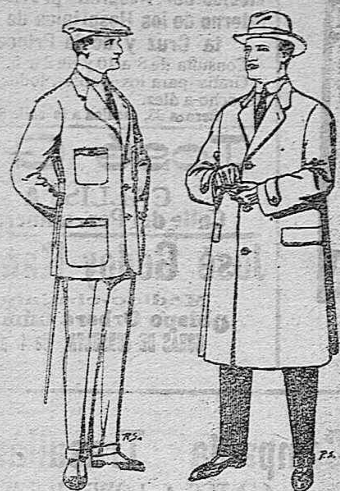
Trajes de cheviot... Gabanes de tejido de pluma o ratina...