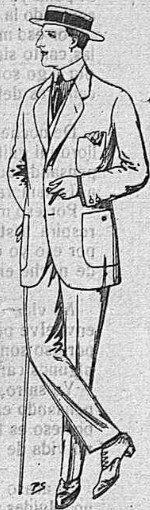
Traje de dril crudo kaki o listado de pesetas 10 a 32.

SOMBREROS DE PAJA PARA CABALLERO, DE 2'25 A 14 PESETAS.