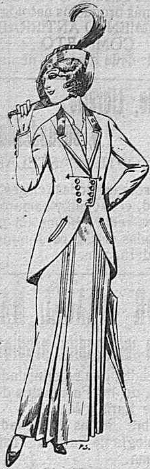
Trajes de lana negra azul y color para señora. A ptas. 80.

SECCIONES: Camisería, géneros de punto, corbatería, guantería, sombrerería, zapatería, bástones, paraguas y artículos de viaje.