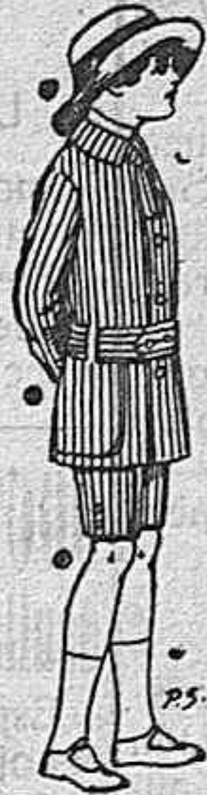
Traje de dril listado para niña. De 4 a 14 pesetas.