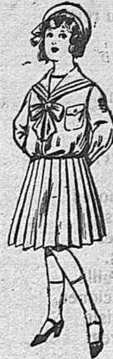
Trajes de lanilla para niños de 4 a 12 años. De pesetas 28 a 38