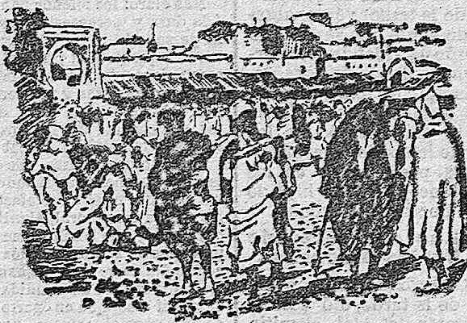
Concierto marroquí en el zoco grande de Tánger