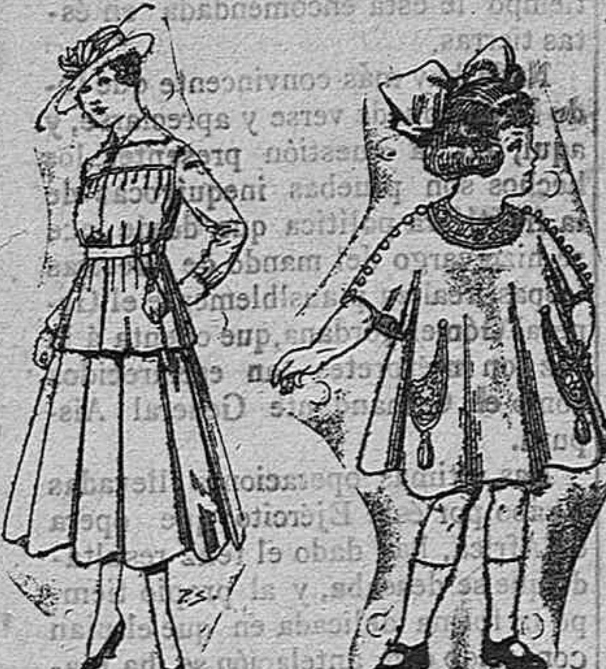
Trajes de lanilla Vestidos de lanilla para para jovencitas de niñas de 4 á 9 años 13 á 19. Pt. 50 á 55 De pesetas 30 á 38