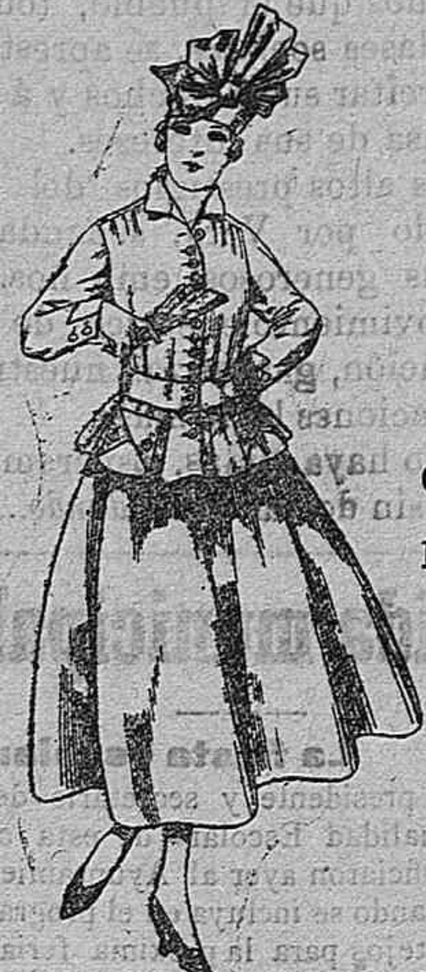
Trajes de lanilla negra, azul y color A pesetas 70