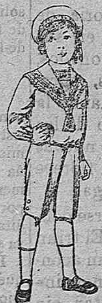
Trajes mari- nera de vieña azul, para ni- ños de 4 á 9 años. Pt. 6 á 20