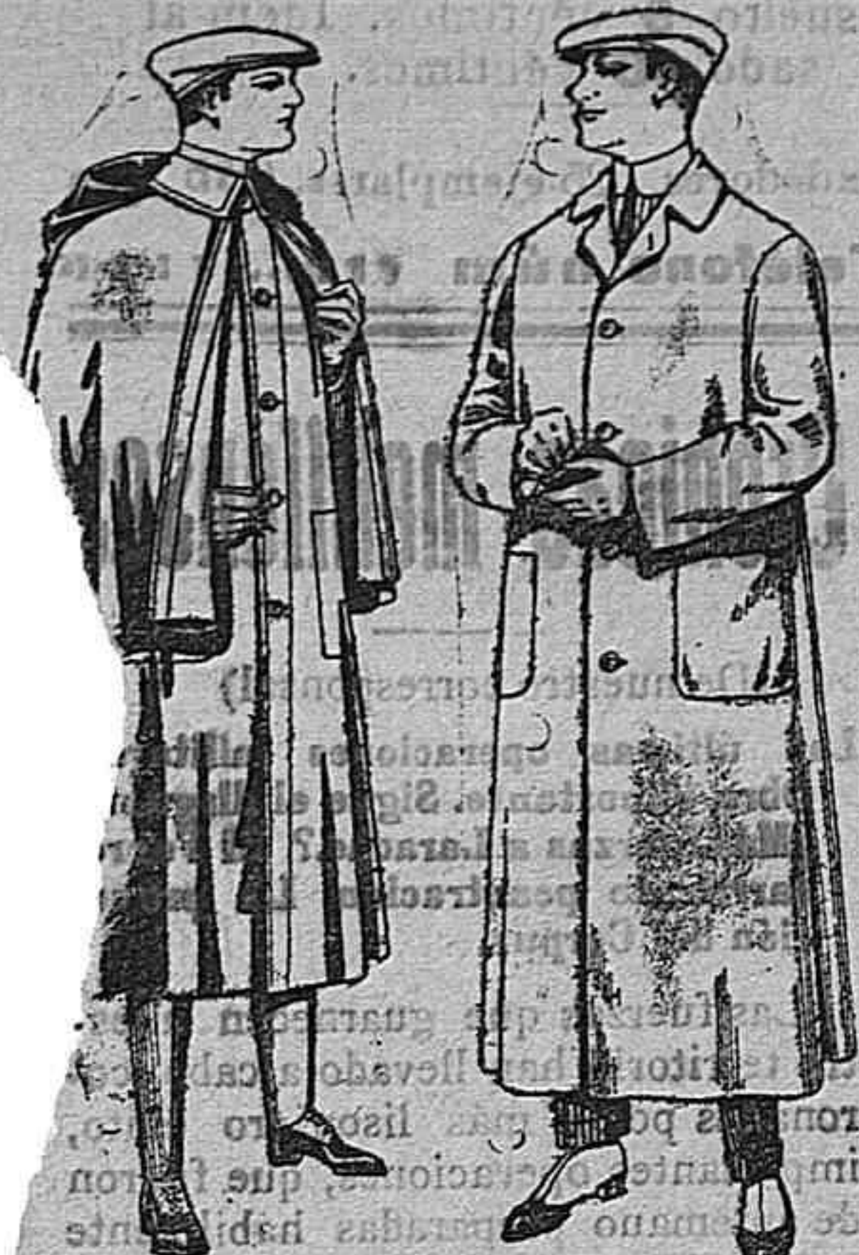
Impermeables forma Guardapolvos de dril "ackferland" en ne-igual al modelo gro y azul De pesetas 55 á 100 De pesetas 6 á 11

Gran exposición de artículos para la temporada