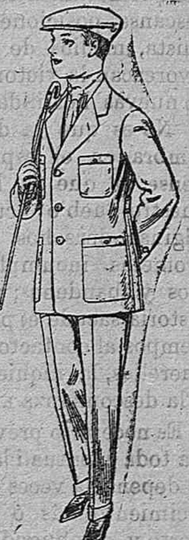
Trajes modelo Sport de dril listado para jovencitos de 10 á 16 años. De pesetas 11 á 17