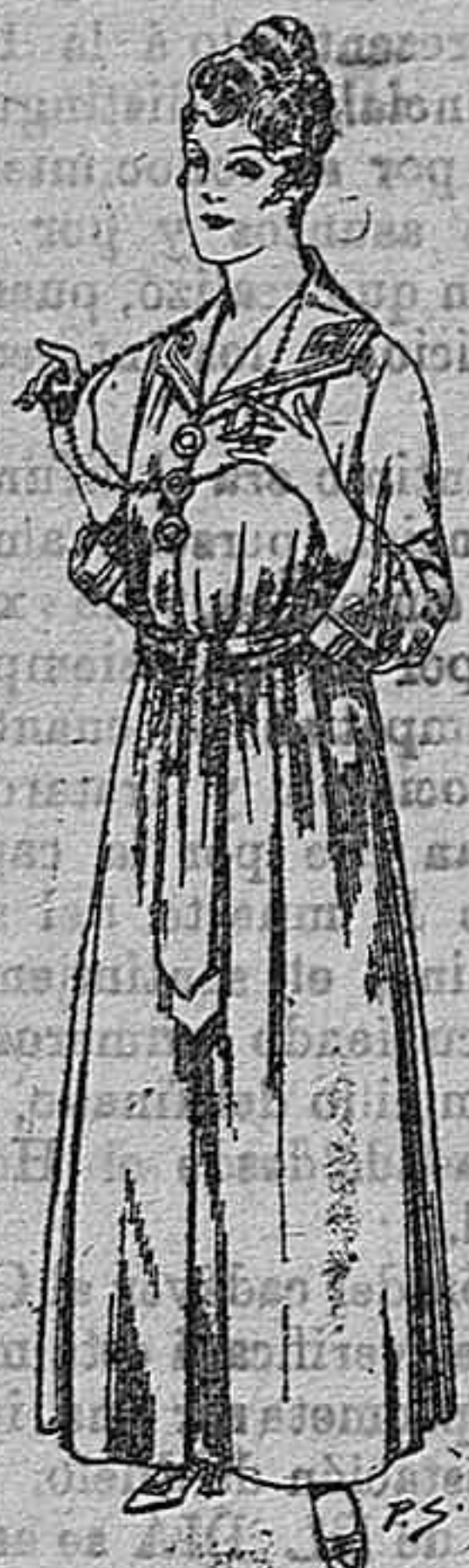
Bata de crespón co- lor, cuello bordado De pesetas 6 á 11

CAMISERIA, GÉNEROS DE PUJCO, CORBATERIA, SOMBRERERIA, ZAPATERIA, PARAGÜAS BASTONES Y ARTÍCULOS DE VIAJE