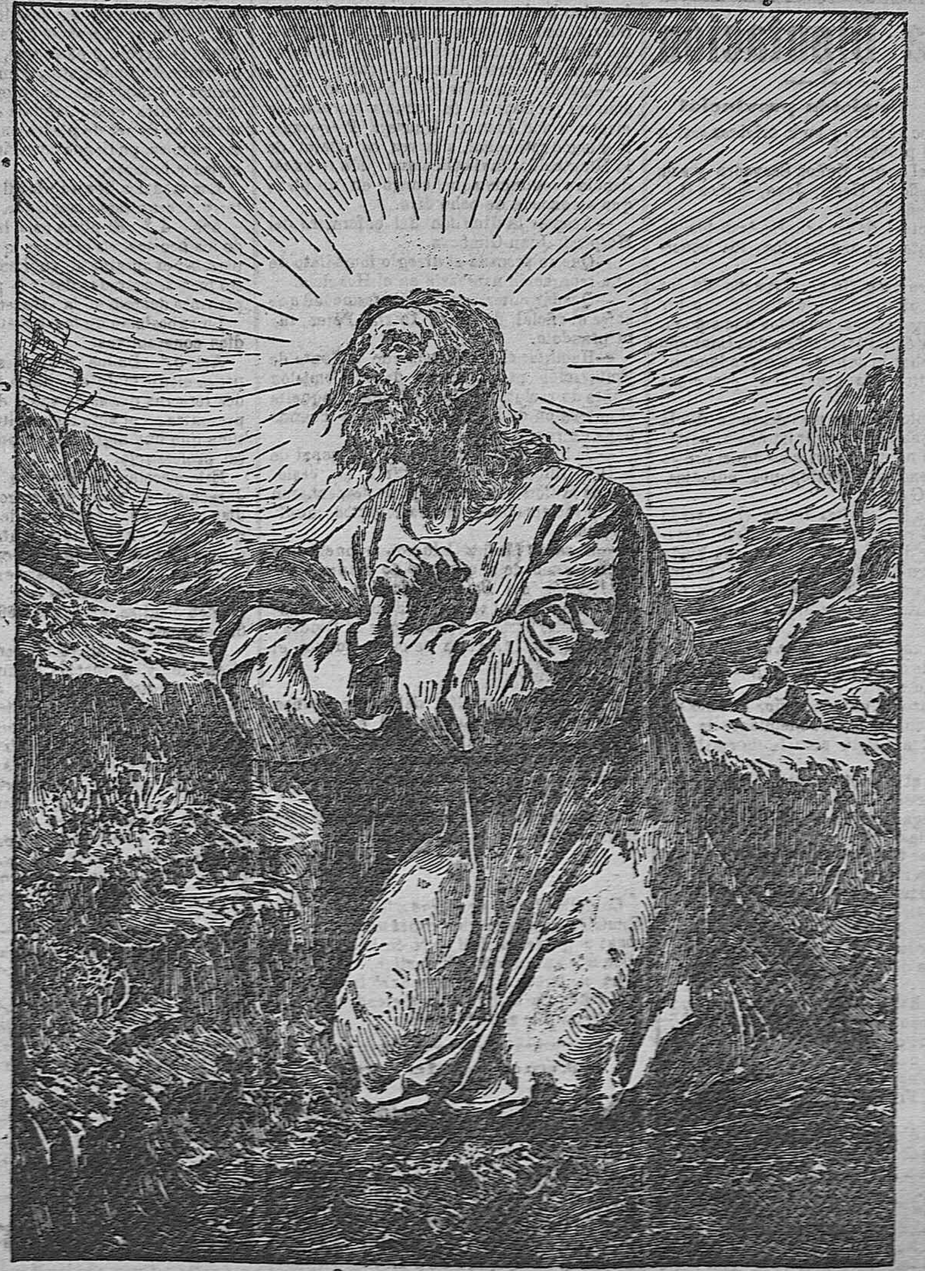
JESUS ORANDO EN EL HUERTO