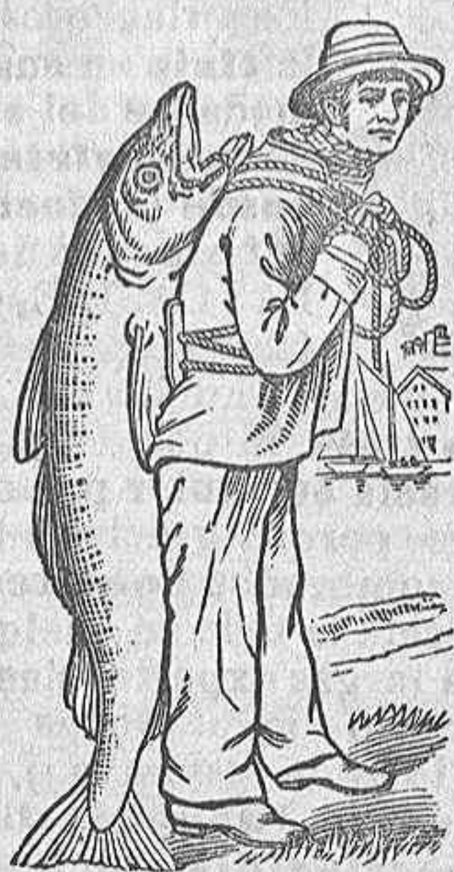
Islas de Lofoden (Noruega) 1902.

Desde muchos años yo pescó para ustedes el mejor bacalao que nada en estos mares, y este bacalao de Lofoden es el mejor del mundo. De estos bacalao que yo pescó con anzuelos y largo curricán, yo reservo para Vds. exclusivamente los de primera calidad. En todos los años que trabajo para Vds. nunca les he dado un pescado de calidad inferior. Esta es la razón de la extraordinaria calidad curativa del aceite que yo extraigo para Vds. de los higados de esos pescados y siempre ha sido de primera calidad de la producción noruega, que es la más superior del mundo. Si el buen pueblo español quiere cosas de primera y no de inferior calidad, pedirá siempre la Emulsión Scott que lleva en el envoltorio la etiqueta que representa un gran bacalao de Lofoden á cuestas de su S. S. EL PESCADOR.