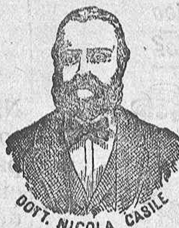
DR. NICOLA CASILE

han logrado que el Dr. Casile de Nápoles descubriera los milagrosos medicamentos que curan infaliblemente la tisis en cualquiera de sus periodos y todas las enfermedades del estómago. A la más pequeña manifestación de un resfriado, tos, catarro, bronquitis, gripe asma (sofocaelom), expectoraciones y de cualquier enfermedad del pecho, tomar inmediatamente las PERLAS CASILE, que no solo curan infaliblemente estas enfermedades, sino que se tendrá la completa seguridad de no encontrar otras mucho más graves. Siguiendo este método se podrá decir no mas tisis. Si por desuido no se hubiera seguido este tratamiento y por desgracia cualquier persona se encontrara atacada de tisis, no tiene que apurarse porque gracias á los constantes estudios hemos podido encontrar los renombrados Confites Casile que asociados á las Perlas combaten con eficacia la tisis en cualquiera de sus periodos.